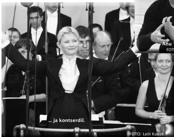
Anu Tali proovis.