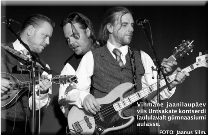
Vihmane jaanilaupäev viis Untsakate kontserdi laululavalt gümnaasiumi aulasse.