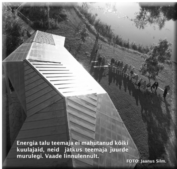
Energia talu teemaja ei mahutanud kõiki kuulajaid, neid jätkus teemaja juurde murulegi. Vaade linnulennult.