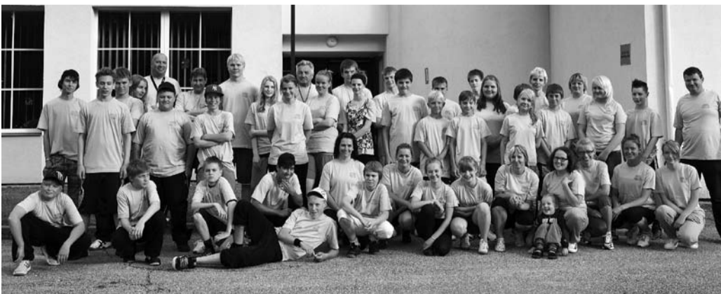
Jokioise ja Suure-Jaani valla noored esimesel laagripäeval.