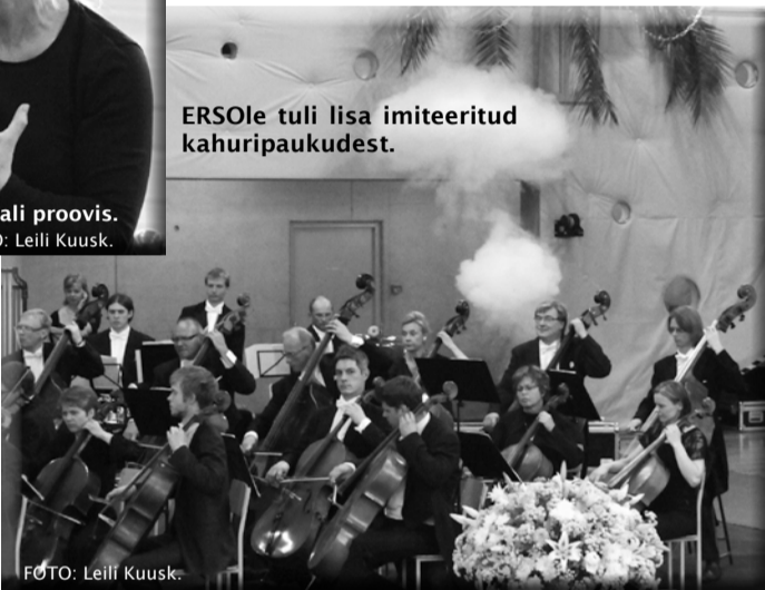
ERSOle tuli lisa imiteeritud kahuripaukudest.