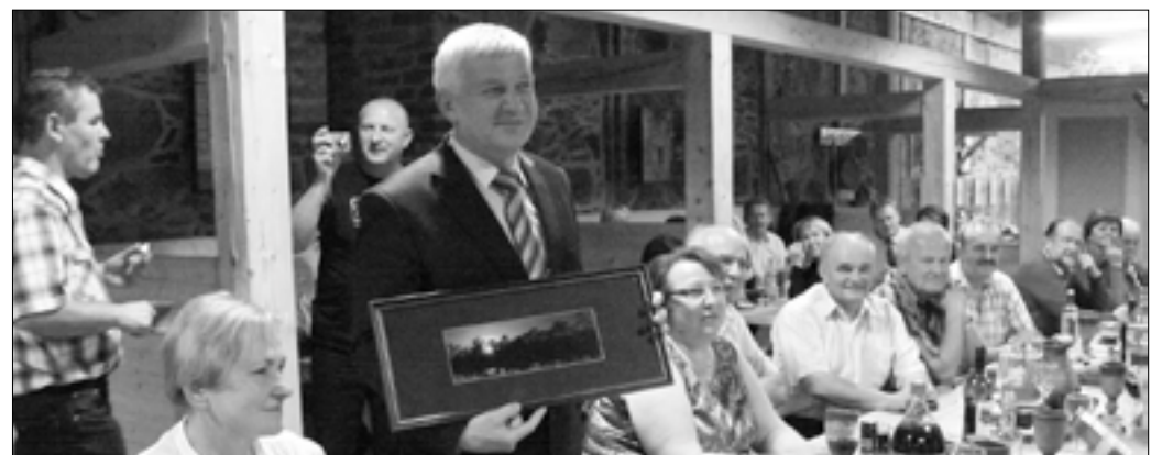
Külalised Hajnowkast Olustvere leivakojas.