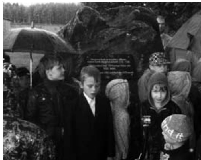
Õpilased vastavatud mälestuskivi juures.