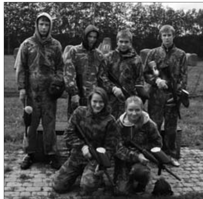
Paintballturniiri võitjad Suure-Jaani noortekeskusest.