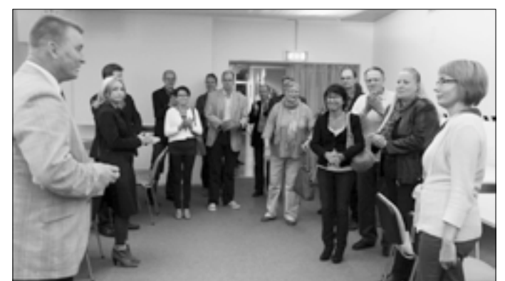
Jokioise külalised Suure-Jaani gümnaasiumi konverentsisaalis.