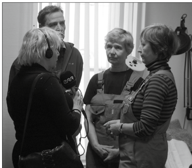
Kiirabibrigaad pälvis tähelepanu Rahvusringhäälingult nii helis kui ka pildis.

Inimestele teadmiseks ütlesid asjaosalised, et üldjuhul teenindatakse inimesi siiski vastavalt väljakutsetele, brigaadi paiknemiskohta kohale tulnud inimest võivad ees oo-