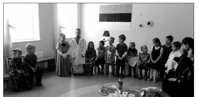
„Presidendipaar“ ja külalised.