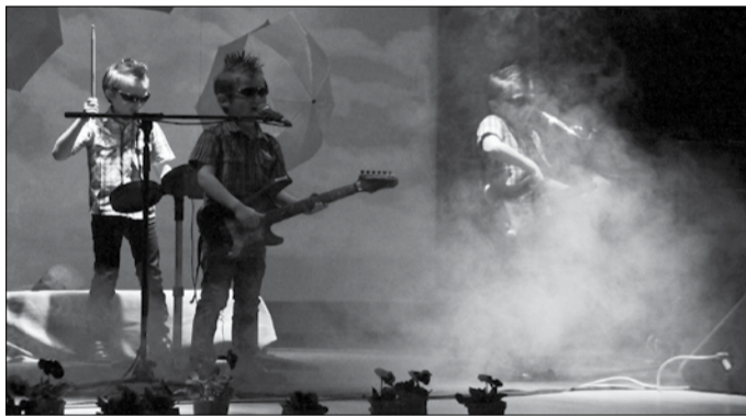
Karmid rokimehed Olustvere lasteaiaast.