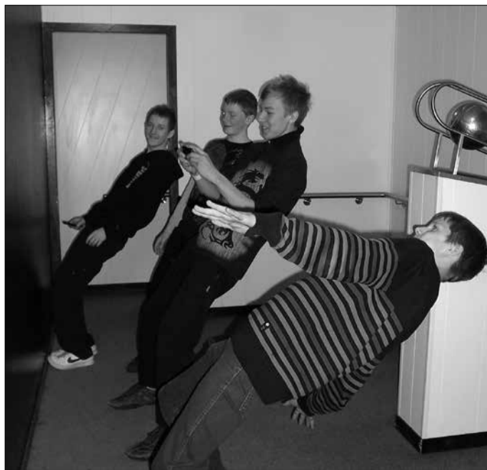
Viltuses toas.