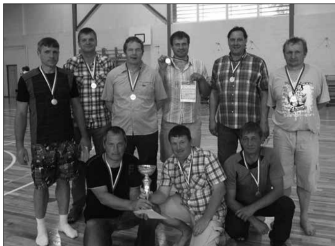
Kuldne finaali Sakala mängudele - Suure-Jaani valla korvpallivõistkond.