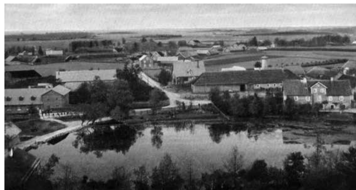
Vaade kiriku tornist Pärnu tänava suunas.