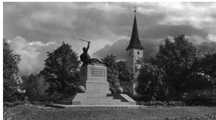
Vabadussõja mäletussammas aastal 1931.