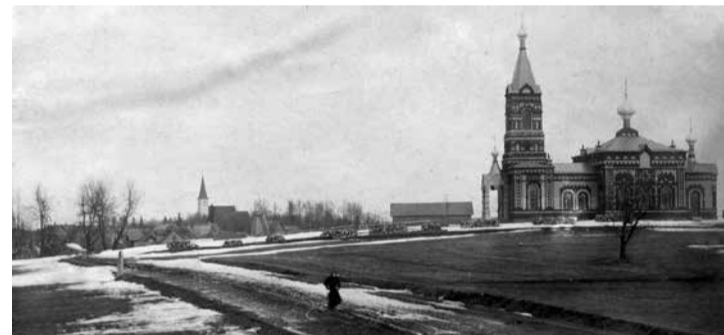
Õigeusu kirik aastal 1908.