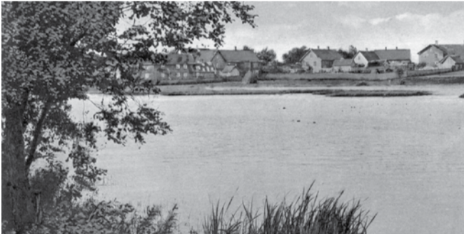
Vaade Tallinna tänavale teiselt poolt järve.