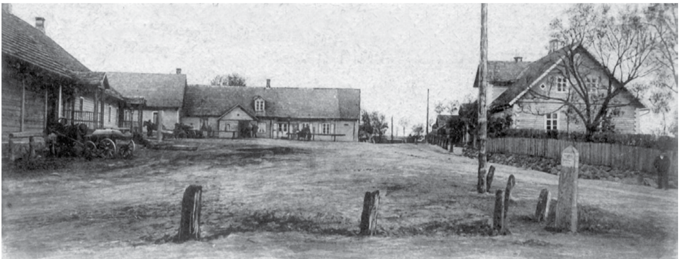
Keskväljak aastal 1903.