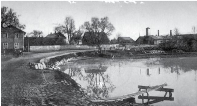
Vaade Tallinna tänavale veskitammilt.