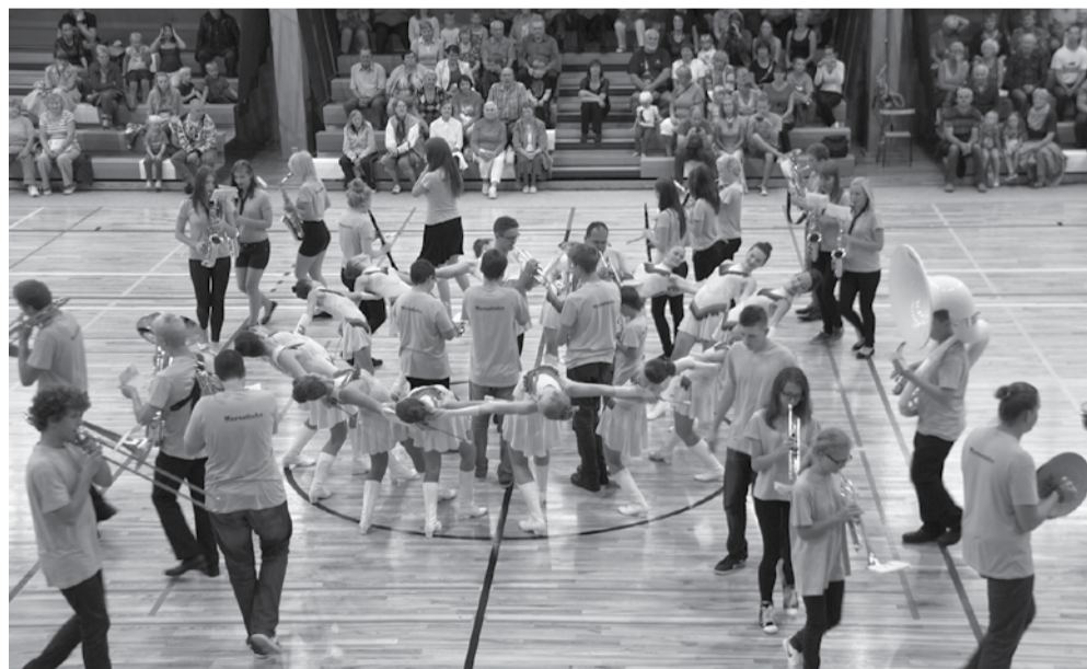
Kujundmarssimine Suure-Jaani gümnaasiumis.

Juba kaheksandat korda osalesid Suure-Jaani vallast pärit noored rahvusvahelise noorte puhkpilliorkestri Wersalinka töös. Orkestrile andis nime Wersal Podlaski nimeline loss Poolas Bialystoki linnas, kust orkestri tegemised kaheksa aastat tagasi algasid. Loss omakorda on nime saanud ühelt teiselt lossilt, sest meenutab kuulsat Versailles` lossi Prantsusmaal. Et nimi iseloomustab hästi ka orkestrit, sai eriti selgelt nähtavaks neile, kes sel aastal Suure-Jaanis Wersalinka kontserdil käisid. Vihma tõttu toimus kontsert spordisaalis. See tegi aga eriti hästi jälgitavaks kujundmarssimise mustrid, mis rullusidki vaatajate ette nagu Versailles` või Wersal Podlaski lossi kaudu lillepeenrad. Tuleb tunnistada, et elamus oli erakordne ka allakirjutatule – vaatamata sadu kordi nähtud proovidele ja kümnetele esitatud kujundmarssimistele kaheksa aasta