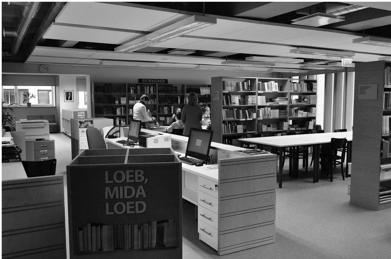
Olustvere raamatukogu oktoobris 2013.