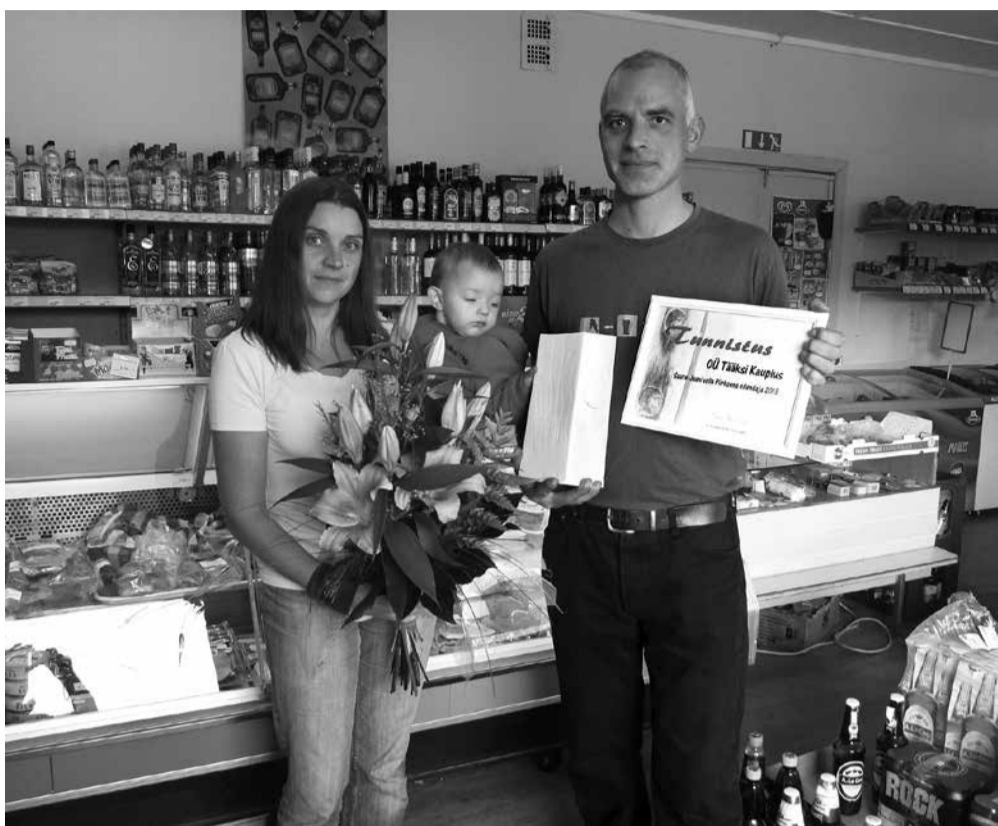
Piirkonna edendaja tiitliga pärjatud OÜ Tääksi Kauplus.

Seekordse ettevõtluskonverentsi peateemaks oli „Julge katsetada uut ja ole pildil!“ Konverentsi tõi kokku 90 osalejat, rõõmu tegi, et suure delegatsiooniga olid esindatud