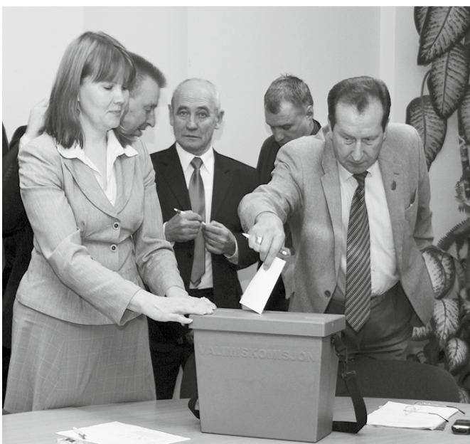
Täidetud sedelid valimiskasti.