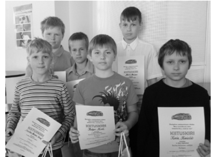
Suure-Jaani poisid Tartus autasustamisel.