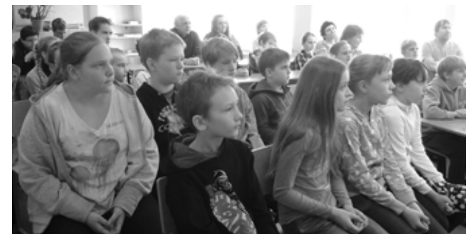
Pranglijad tulemusi ootamas.