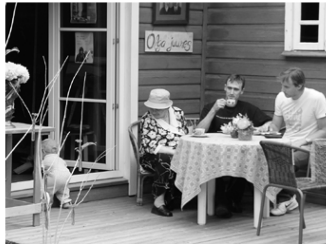
Õdus nurgake eelmisest kohvikute päevast: „Olga juures“.

Erla Soots Suure-Jaani gümnaasiumi õpetaja ja treener