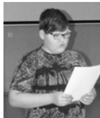
Taavi Eller Sürgevare põhikooli 6. klass

meestega ühes toas. Kodus võiksid saada terve maja, mul pole rohkemat tarvis kui ainult oma kamber. Põllud on kõik sööti kasvanud, tuul kõvasti metsa räsitud, traktor rattaid pidi pooleldi maasse vajunud ... ja eks minagi pole enam see ... Tuleksid ikka koju, nainegi sul veel võtmata, ehk näen siis minagi veel lapselapsi?” kurtis isa. „Küllap me kuidagi ikka toime tuleme, pojake, mul ju võlukaart ka!” lausus vana mees kelmikalt.