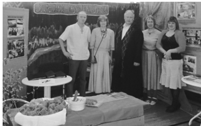
Suure-Jaani valla rahvas messiboksis.

Messi avas põllumajandusminister Ivri Padar, kes hindas kõrgelt „Maale elama“ algatust ja kiitis kogukondi, et nad aktiivselt oma piirkondadesse elanikke kutsuvad.