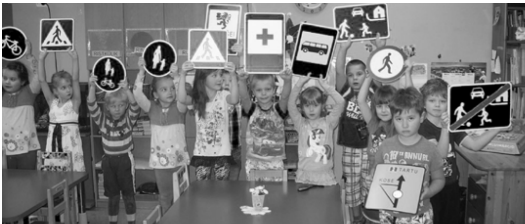
Sipsikud uute õppevahenditega.