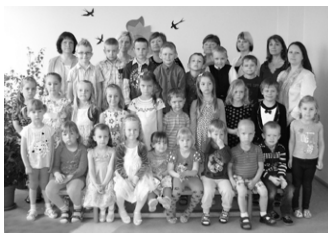
Selline sai 12. mail tehtud foto Päevalille väikestest ja suurtest.

8. mail toimus Vastemõisa rahvamajas saalis Vastemõisa lasteaias „Päevalill“ ja Kildu põhikooli poolt korraldatud ühine emadepäevale pühendatud kontsert. Lasteaias olid tublid. Kildu kooli poolt oli lapsevanematele ja külarahvale ette valmistatud imeline