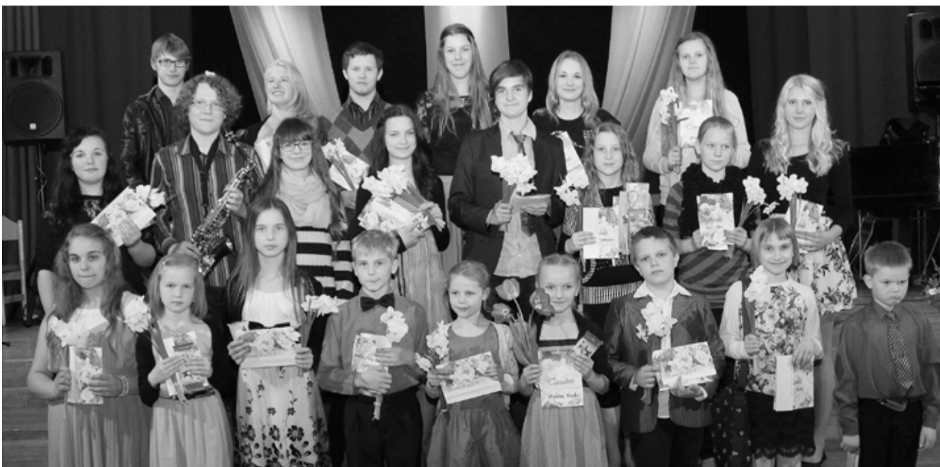
Nooruse Laul 2014 parimad.