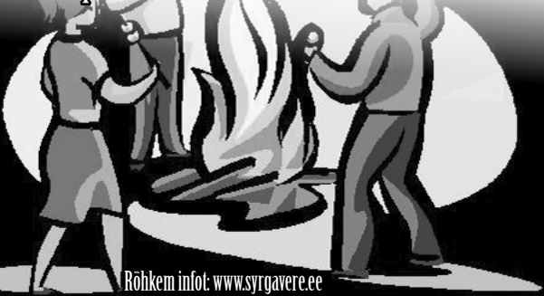
Rõhkem info: www.syrgavere.ee

Esinevad kohalikud taitlejad, sportlikud mängud nii lastele kui täiskasvanutele ja palju muud põnevat.