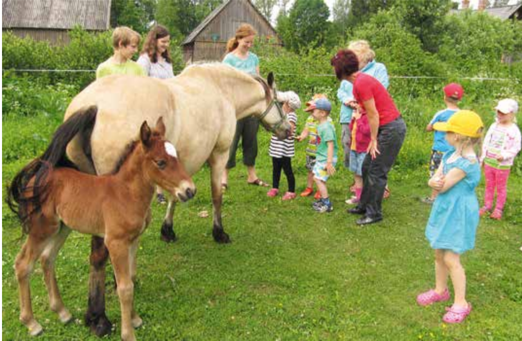
Tuudeveres uudistamist jätkus.

Perepoeg oli grillimeister. Tema küpsetatud viinerid maitsesid