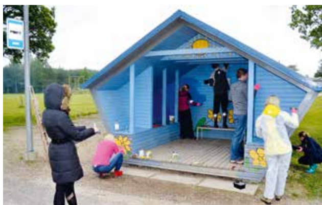
Muuhulgas sai Asi KredExi töötajate abiga värske näo ka Kildu bussipaviljon.