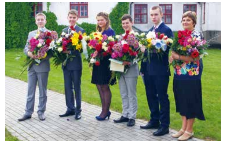
Täaksi põhikooli lõpetajad.