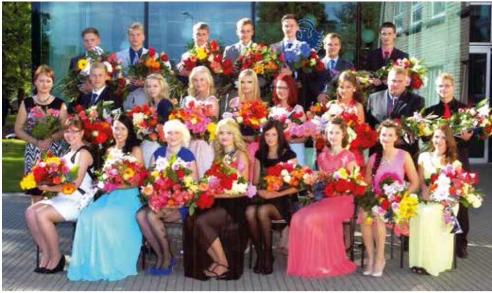
Suure-Jaani gümnaasiumi lõpetajad.