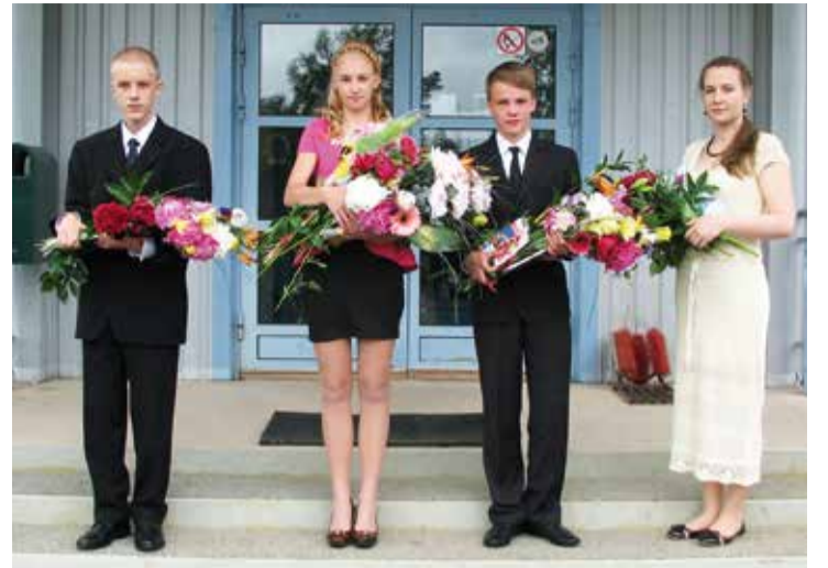
Kildu põhikooli lõpetajad.