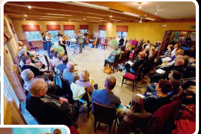
Vanaõue puhkekeskuse saalist sai esimest korda muusikafestivali kammersaal.