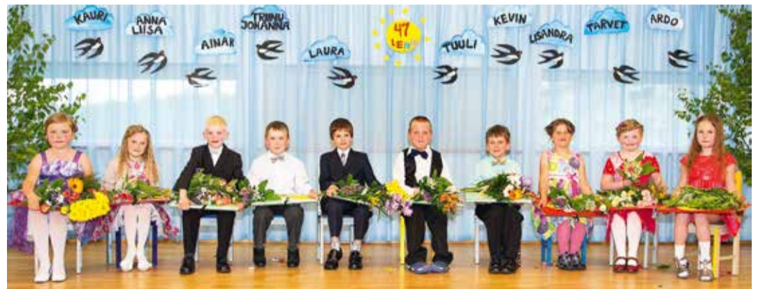
Lasteaia Piilu lõpetajad.