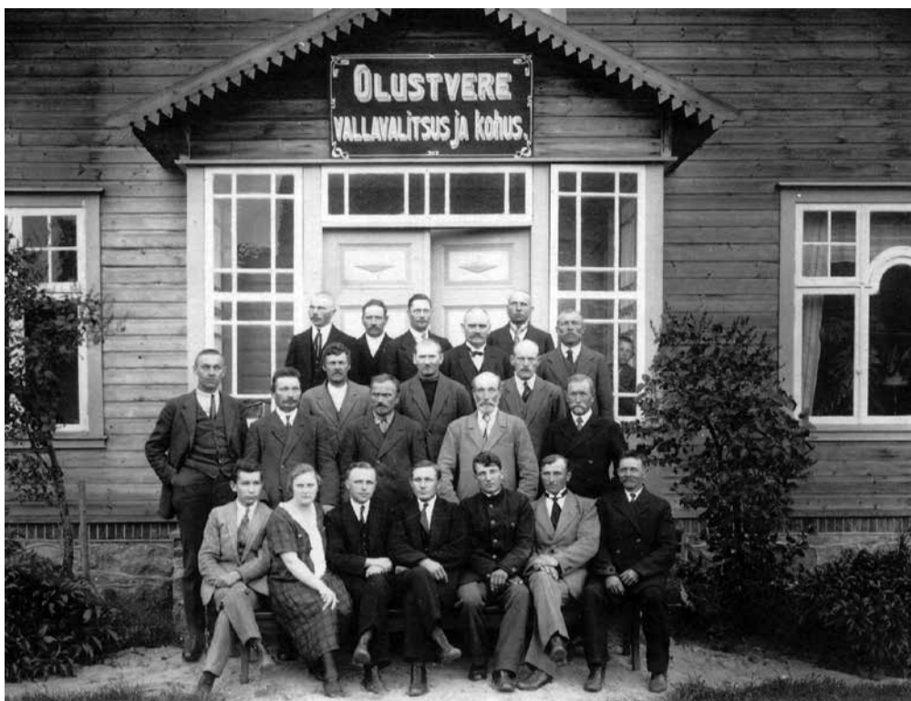
Olustvere vallavalitsus ja kohus 1920. aastal.

1. detsembril 1911 valis Olustvere volikogu enda seast kolme-