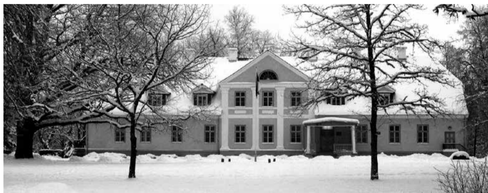
Lahmuse kooli peahoone

Lahmusele tasub vaatama tulla. Ega siis vaatamatulek pole veel õppimaasumine. Laps, kellele riikliku õppekava omandamine valmistab tõsiselt raskusi, vajab samuti igapäevaelus positiivseid