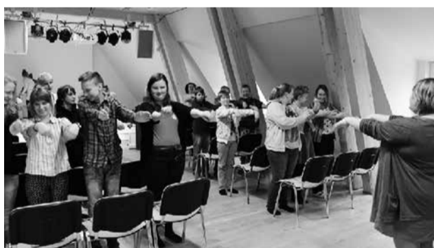
Jutuvõistluse autasustamisüritus noortekeskuses.

Neist inspireerivamaks osutus suvevaheaja teema. Lapsed käisid oma lugudes reisimas välismaal ja külas vanaemal, püüdsid kinni loomaia kassavargad ja kohtusid kaheksajalg-tulnukatega. Üks töö oli kirjutatud ka luulevormis. Kõik lood olid huvitavad ja neist pingerida teha oli raske.