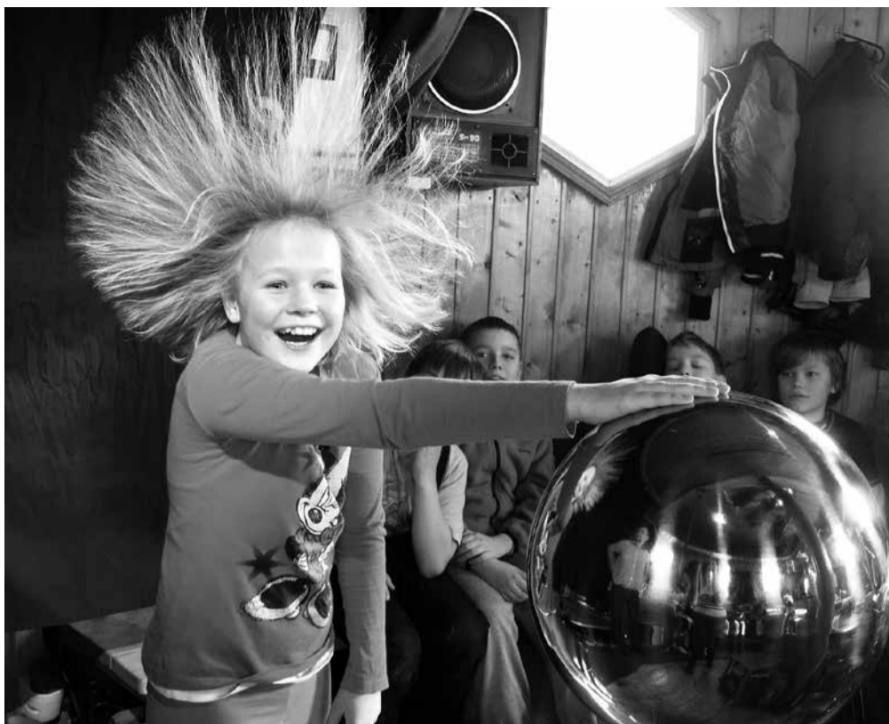
Elekter on päris osav juuksur!

Keraamikakojas voolisin ma istuva kassi, kellel on kroon peas ja padi käpade vahel. Padja peale voolisin kuldsõrmuse. Siis läksime klaasikotta ja tegime ise klaasist vaase. Klaasikojas oli suur ahi, kus oli üle 2000 kraadi sooja. Ahjus oli pajatäis klaasi, mis oli vedelaks sulatatud. Seal võeti ühe pulga otsa klaasi ja kasteti sellise värvipulbris, milliseks klaasi sooviti. Siis tuli seda natuke