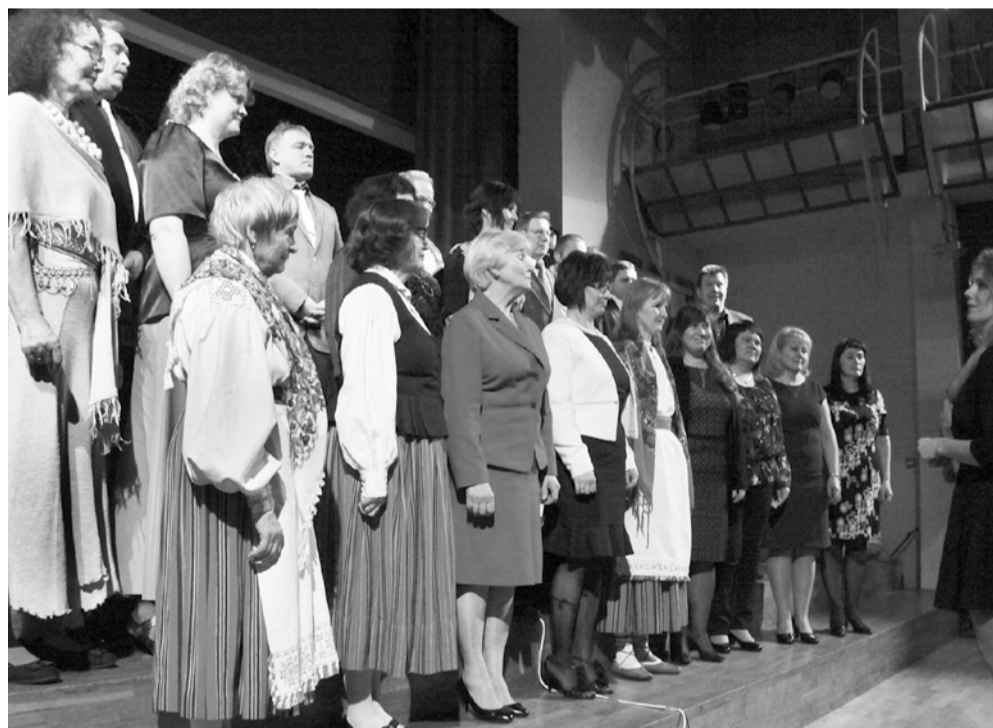
Lehola Suure-Jaani valla isetegevuslaste kontserdil Vastemõisas.

111. hooaega alustasime Lehola raamatu esitlusega leivakojas. Hilissügisel osalesime viie koori päeval