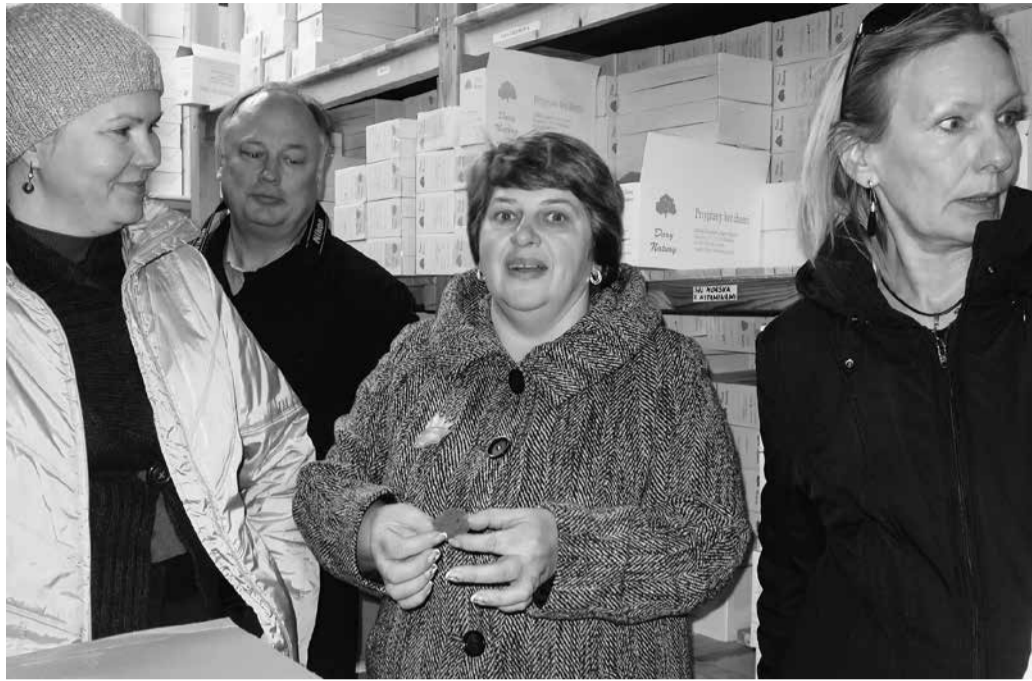
Kõige suuremat elevust tekitasid loodustooteid tootva ettevõtte laos tammeterujahust küpsised ja tammeterujahu. Küpsised maitsesid head.

Silma jäi, et pea kõiki neid inimesi, kelle tegemisi meile tutvustada sooviti,