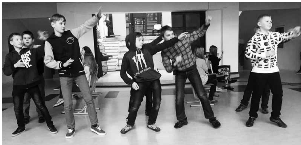
5. klassi tants.

Ettevalmistused tantsuturniiriks algasid juba jaanuaris. Tants tuli ju selgeks õppida! Turniir toimus kahel vahetunnil. Tantsuturniiri avas muusikaõpetaja Agnes Kurg. Kõigepealt tantsisid 1. klassi lapsed loo „Mutionu pidu“ järgi. Nad olid loomakesteks maskeerunud. Järgmisena tantsisime meie, 4. klassi õpilased, tuntud filmiloo „Ghostbusters“ järgi. Meil olid parukad ja maskid. 5. klassi õpilased esinesid loo „Albatroz“ järgi. Nende loos olid räpparid ja beebid. Viimasena tantsisid 9. klassi õpilased, kes olid oma truppi võtnud ka paar 7. ja 8. klassi õpilast. Nende tantsu pealkiri oli „Seenes“.