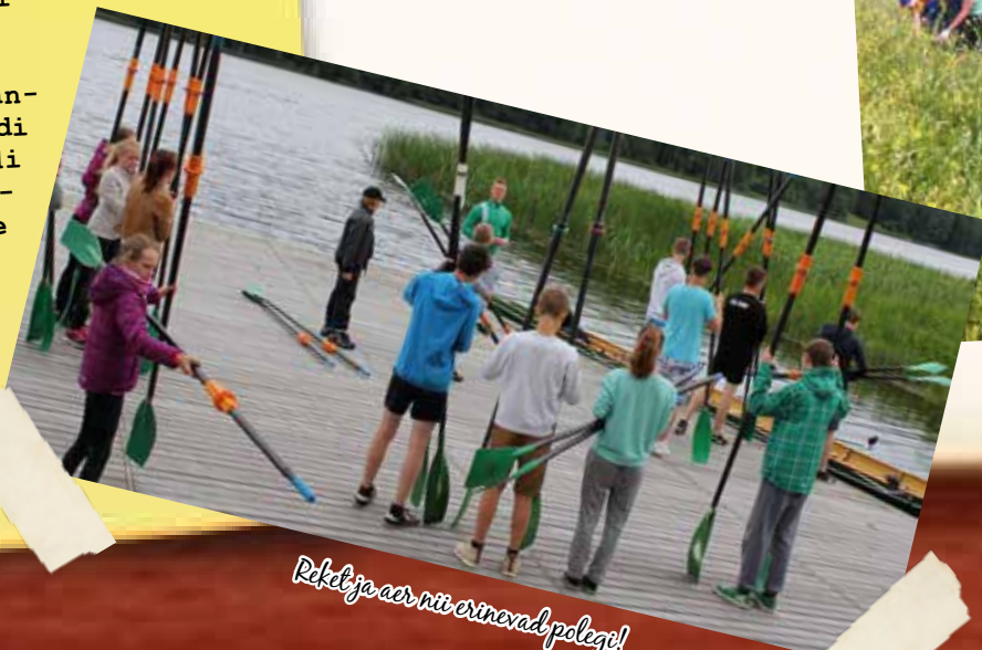
Reket ja aar nii erinevad polegi!

Käidi Jakobsoni uues mängukeskuses kinos ja Viljandi järvel sõudmas, võisteldi sopsus, velokartidega sõitmises, T-rajal ja erinevate teatevõistluste ülesandeid sooritades. Oma oskused pandi proovile laagri lõpus toimunud üksik- ja paaris-mängu turniiridel.