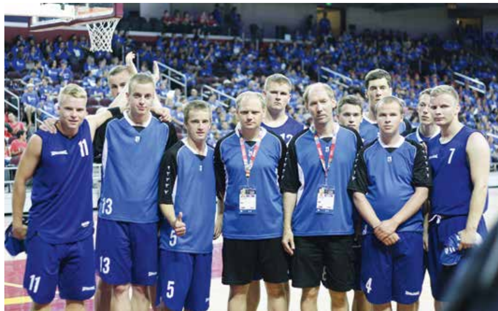
Ühendatud korvpallivõistkond ja treenerid.

Mängude avamine oli suurejooneline. Toimus see Los Angelese olümpiaa stadionil. Samas kohas, kus 1984. aastal avati olümpiamängud. Avamise juurde kuulus kõik, mis ühel avamisel olema peab: de-