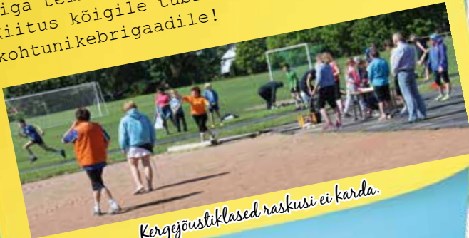
Kergejõustiklased raskusi ei karda.

Pühapäeval, 7. juunil toimus 42. Leho-la-Lembitu mängude kergejõustikuvõistlus vanal ja paraku mitte heas seisukorras Suure-Jaani staadionil. Kokku võistles tugevat tuult trotsides oma külade eest 67 sportlast (38 meest ja 29 naist). Üldarvestuses võitis võistluse Põhja Suure-Jaani 976 punktiga, Kildu oli 974 punktiga teine ja Aimla 940 punktiga kolmas. Kiitus kõigile tublidele sportlastele ja kohtunikebrigaadile!