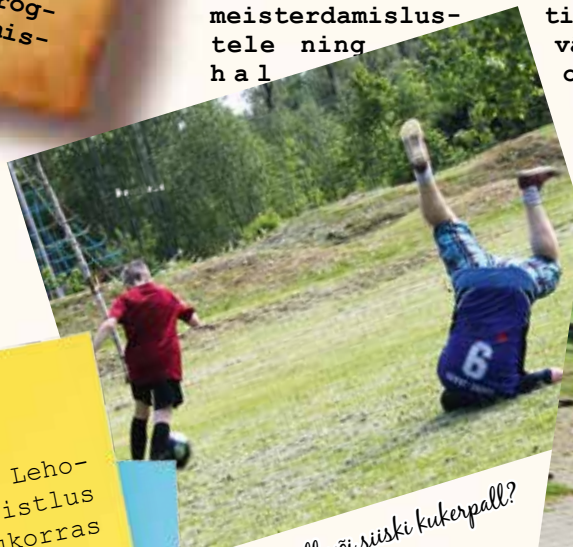
Jalgpall või siiski kukerpall?

politseitöötajad. Esmakordselt püstitati Suure-Jaani hüppetorn Marumägi, kus tehti meie valla pikimad suvised suusahüpped. Tänavakorvpalliväljakul selgitati Suure-Jaani valla parimad pallurid. Loomulikult ei saanud mööda ka paarisajast portsust kookidest. Päeva lõpetas traditsiooniline sõpruskohtumine jalgpallis valla noorte ning volikogu liikmete ja ametnike vahel. Tänavu pidid ametnikud tunnistama noorte osavust ja kiirust ning võtma vastu 3:1 kaotuse. Perepäeva lõpus tõi