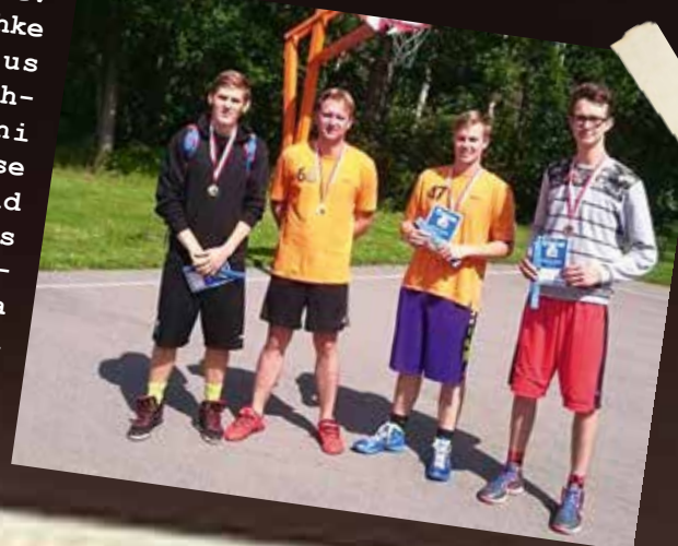
Võidukas Kõidama tänavakorvpalli meeskond.

Seekordsetel valla kodukandipäevadel võisteldi mitmel erineval alal. Selgusid parimad Lehola-Lembitu mängudel nii jalgpallis, kalapüügis, tänavakorvpallis kui ka petankis. Lisaks said kergejõustikusõbrad end proovile panna vanadel olümpiaaladel võisteldes ning kõik huvilised põnev ja osalejaterohke turniir peeti staadionil, ni esindusele. Järgnesid Lõuna Suure-Jaani ja Aimala võistkonnad. Kalapüügivõistluse võitis kindlalt Kõidama esindus Kildu ja Sürgavere ees. Tänavakorvpalliski ei lasknud Kõidama mehed kellelgi end üllatada ja võitsid esikoha Kildu ja Olustvere korvpallurite ees. Põnev ja osalejaterohke petankivõistlus tõi esikoha Põhja Suure-Jaani esindusele. Teise kohaga lõpetasid üldkokkuvõttes Lõuna Suure-Jaani mängijad ja kolmanda kohaga Olustvere esindus. Täname kõiki korraldajaid ja osalejaid!