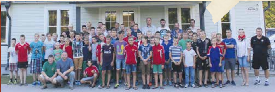
Rõõmus seltskond kolmestriigist

Külalised lahkusid positiivsete muljetega ning jääme lootma, et meie noortel on ka edaspidi võimalik rahvusvahelises seltskonnas end proovile panna. Tegu pole sugugi üksnes spordiga – noored said oma inglise ja vene keele oskust testida ja edasist suhtlust jätkatakse interneti abil. Maailm avardub meie noorte jaoks, kel sõpru juba mitmes riigis, ning selle üle on siiralt hea meel.