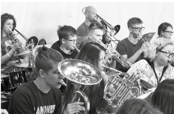
Orkester proovi tegemas.