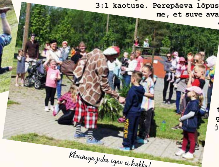
Klouniga juba igav ei hakka!