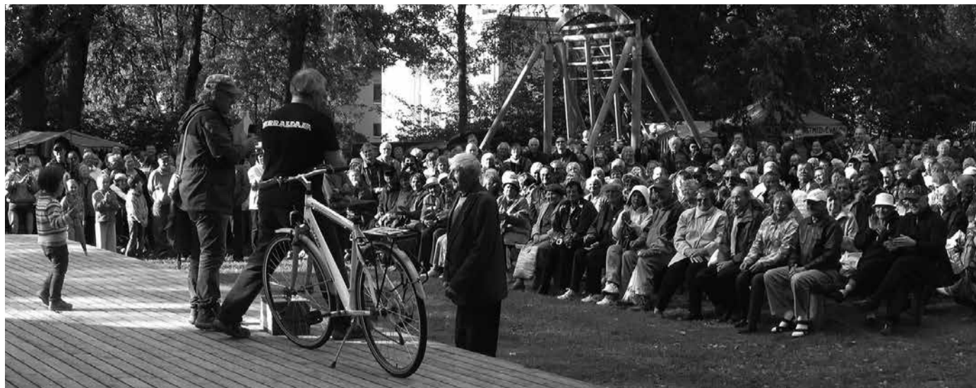
Laadaloterii peavõit on omaniku leidnud.