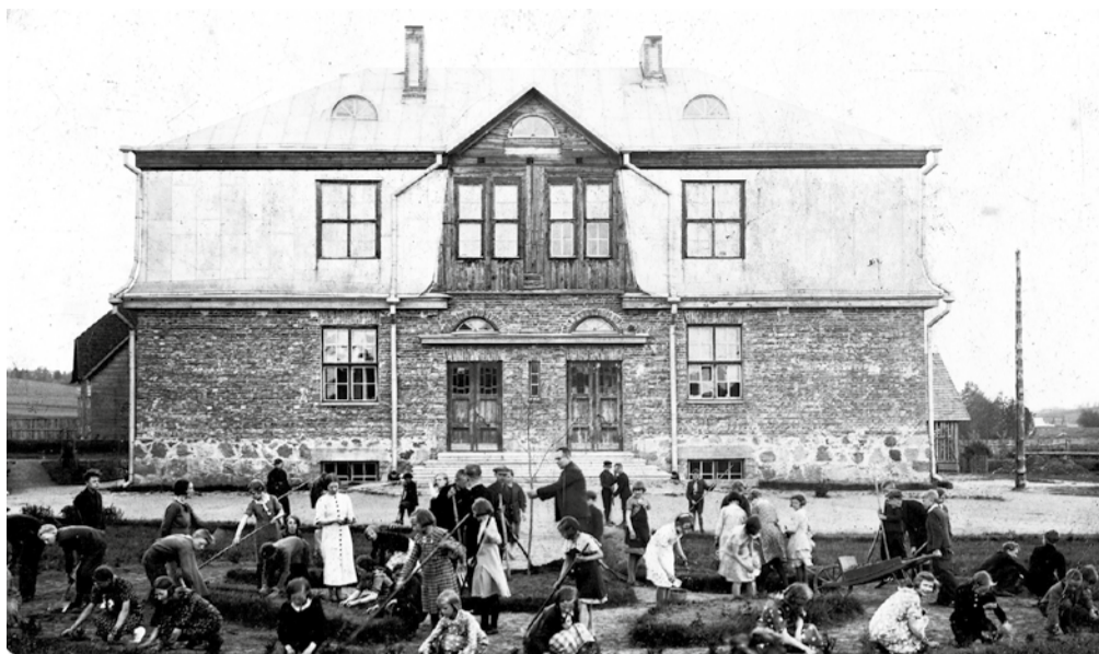
Tääksi kooli õpilased 1932. aastal elupuuhekki istutamas.

Istun jalga puhkama Lutsu mäele, kust avaneb vaade kunagi Eestimaa Šveitsiks kutsutud külale. Silm märkab muutusi võrreldes lapsepõlves