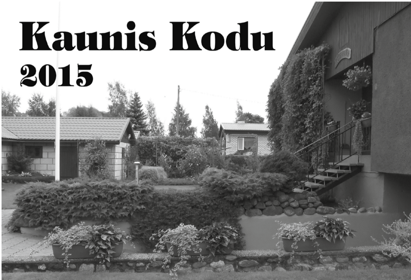
Küpressi Vastemõisa külas.