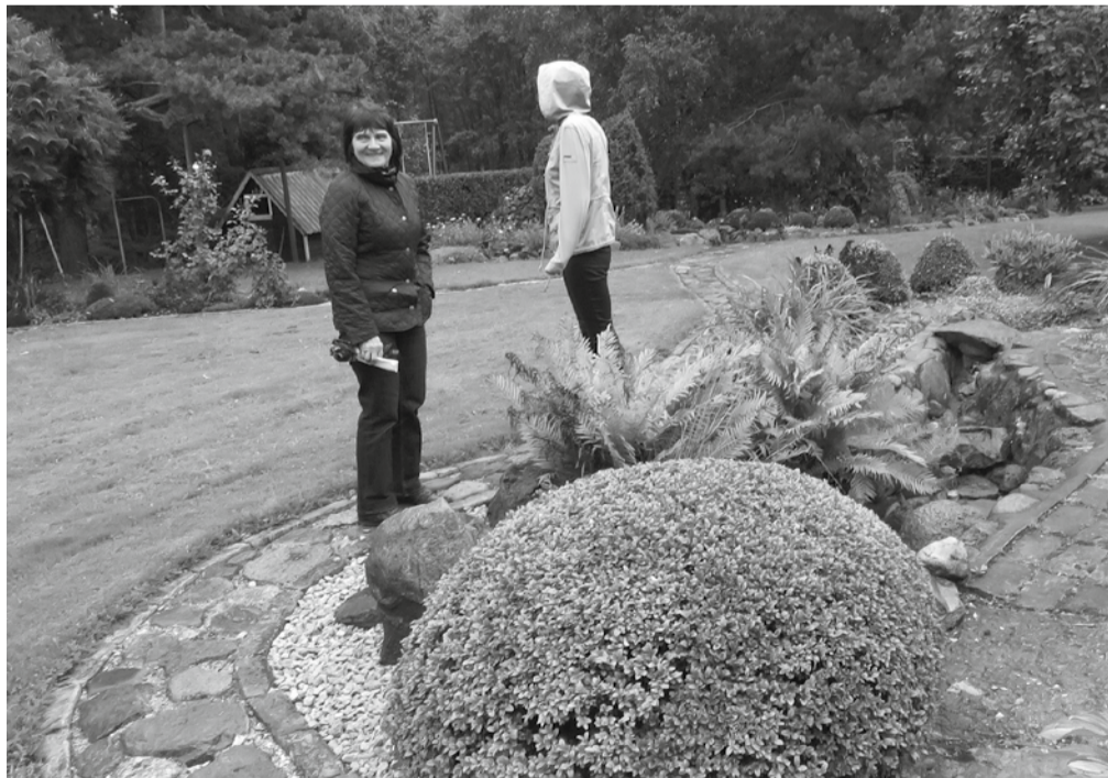
Komisjoni liikmed Mäekalda aias.