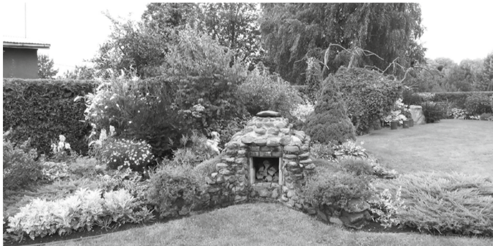
Nurgake Küpressi aias.