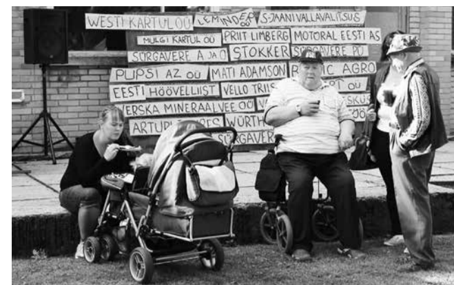
Laada toetajad on kõigile näha-teada.