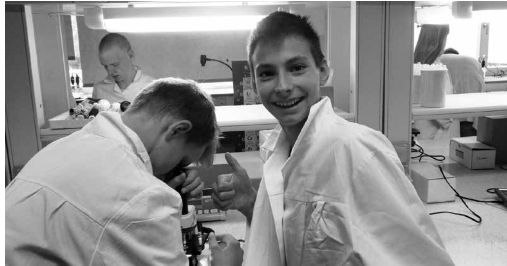
Laboris on põnev.

Kolmapäeval, 30. septembril kohtusid Olustvere TMK keemialaboris Suure-Jaani kooli ja gümnaasiumi, Olustvere põhikooli, Võhma kooli ning Olustvere Teenindus- ja Maamajanduskooli bioloogiahuvilised õpilased ning tegid algust esimese bioloogia õpikojaga. Esimese kokkusaamise teemaks olid taimed. Tutvusime taimede maailma ja olumusega. Uurisime mikroskoobiga taimede ehitust ja nende parasiite. Kasutada oli ka üks väga võimas elektronmikroskoop. Eksperimenteerisime taimedega, uurides nendes toimuvat fotosünteesi ja transpiratsiooni, kasutades selleks Verner'i andmekogureid ja sensoreid. Lõpuks korjasime õuest värvilisi lehti ja tegime kromatograafia abil kindlaks, milliseid pigmente ja plastiide sügisestest lehtedes leidub.