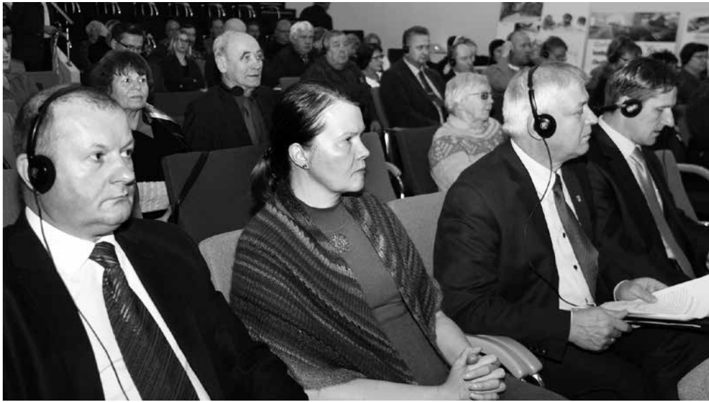
Konverentsil osalejate hulgas esiplaanil külalised Hajnówkast.