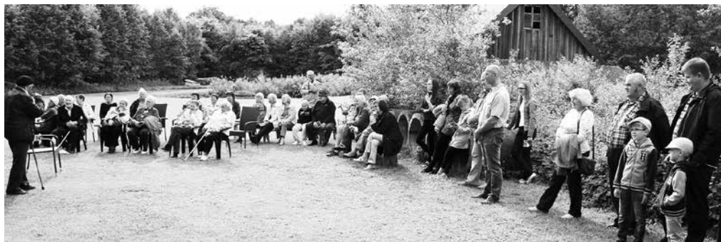
Kokkutulnud Margna talu õuel.

Koolmeisterite ettevalmistamist oli Eestis alustatud juba Rootsi ajal. 1684. aastal avas Tartus koolmeisterite seminari Forselius. Esimese eestikeelse aabitsa oli 1641. aastal välja andnud Eestimaa piiskop Ihering. 1787. aastal kehtestatud kooliseadus nõudis küla- ja kihelkonnakoolide rajamist, kus neid veel polnud. Selle seaduse järgi oli ka Kõpu mõisal, kuhu Metsküla maad kuulusid, käsk avada koolid.