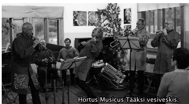
Hortus Musicus Tääksi vesiveskis.