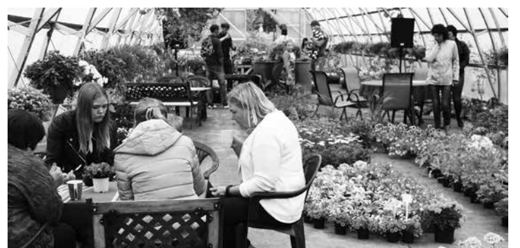
19. juunil toimunud aiakohvikute päeval oli kõige lillilisem kohvik Rohekalda aiandis.