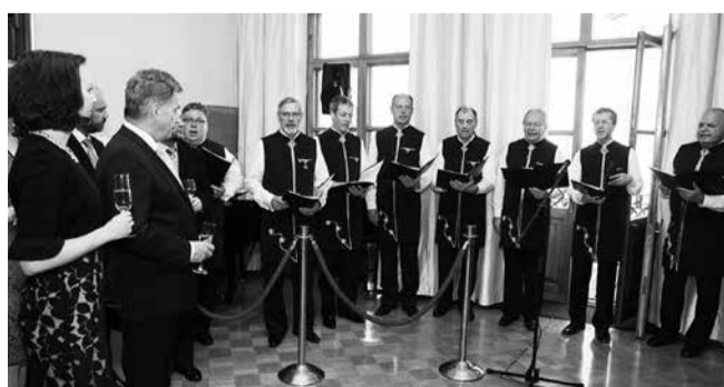
Pange Poisid Soome saatkonnas.