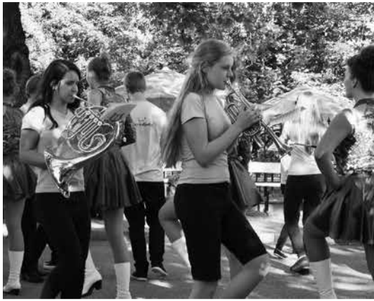
Kujundmarssimine. Wersalinka kontsert Suure-Jaanis.