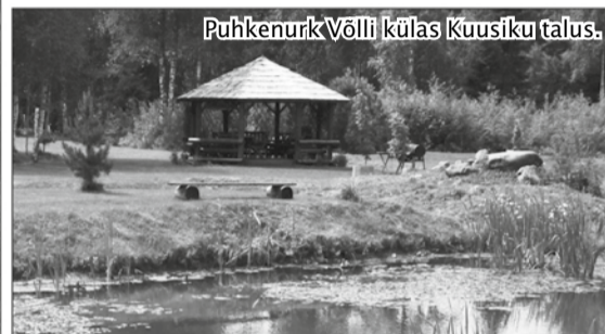
Puhkenurk Võlli külas Kuusiku talus.