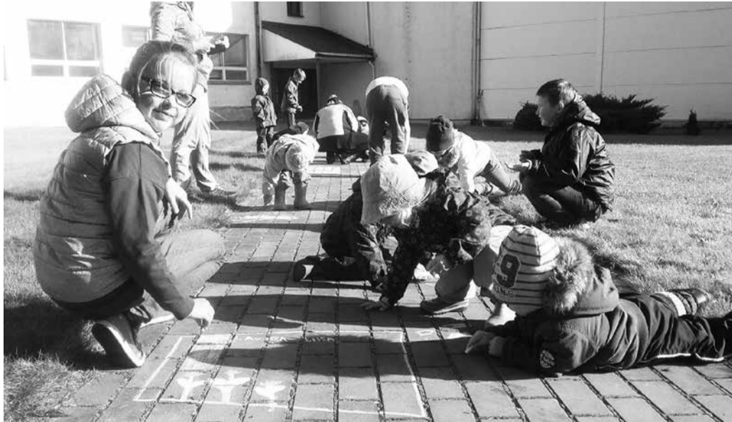
Sügise sünnipäevaks kriidipilte joonistamas.

Oktoober on proovikuuks noortekeskusele, mis kutsub