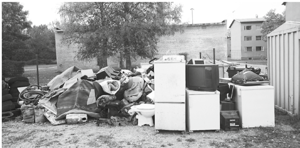
Sobimatud jäätmed Olustvere keskkonnajäätmejaamas.