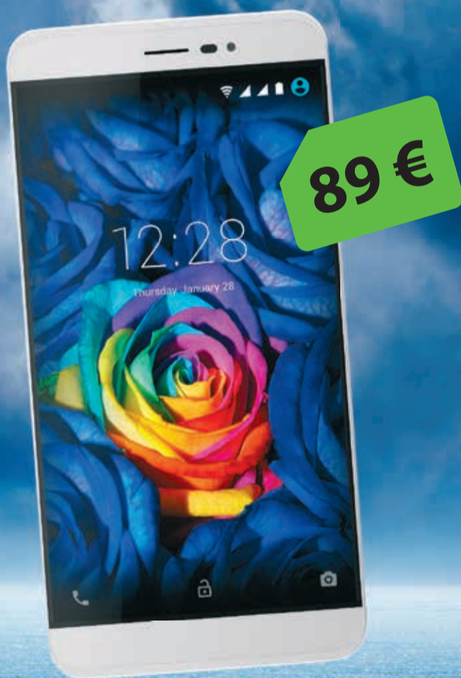
Coolpad Porto S

Kuller tuleb Suure-Jaani valda TA-SU-TA!