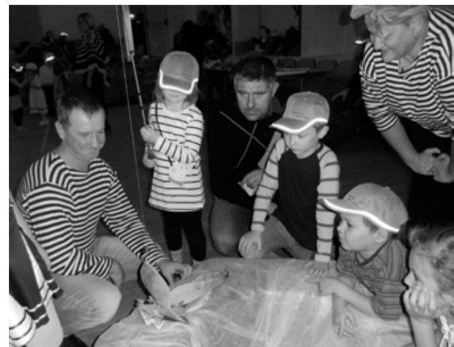
Merepeo väikesed ja suured kalapüüdjad.

Käes on aasta kõige pimedam aeg. Mardid on jooksnud, kadríd kohe-kohe tulekul, lumi on maas olnud ja jälle ära läinud, isegi lumememmesid jõudsime teha, mis siis, et nad kohe järgmisel päeval ära sulasid.