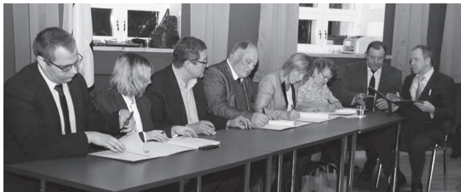
Volikogude esimehed ja vallavanemad allkirjastavad ühinemislepingu.