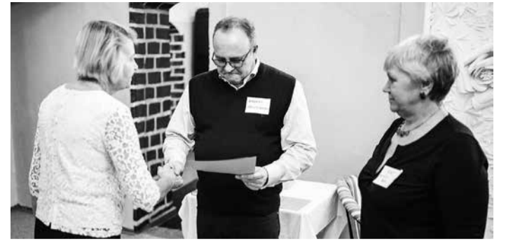
Tunnustuse võtavad vastu Olustvere naised.

26. novembril, kodanikupäeval tunnustati Lahmuse mõisas Viljandimaa MTÜsid.