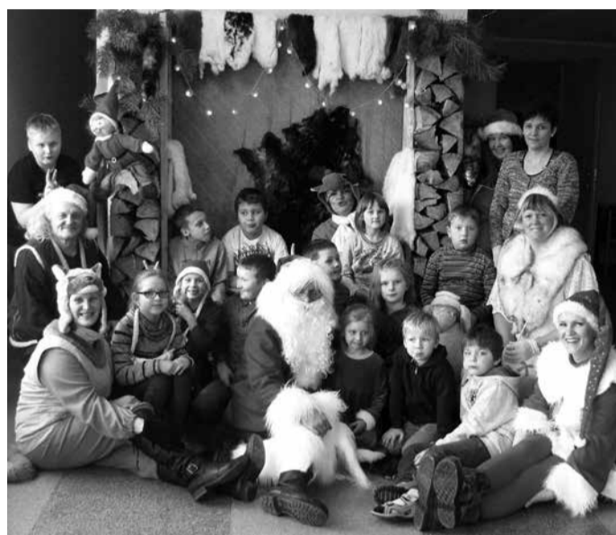
Nii omad kui külalised fotonurgas.