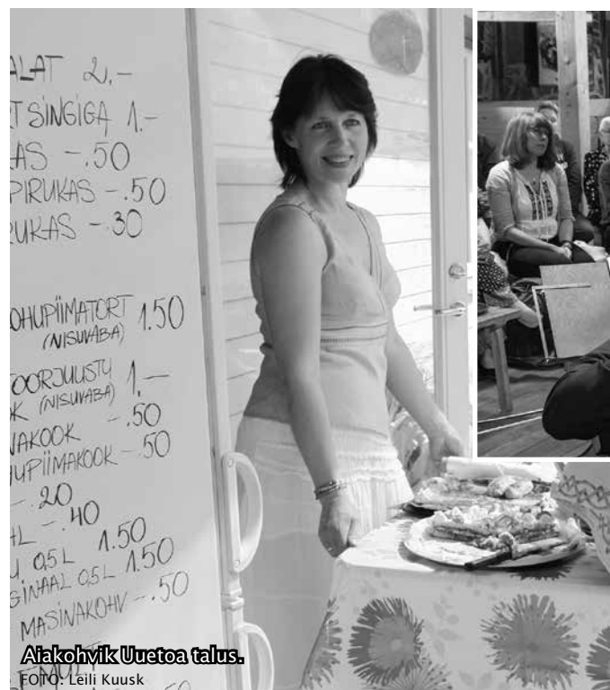
Aiakohvik Uuetoa talus.