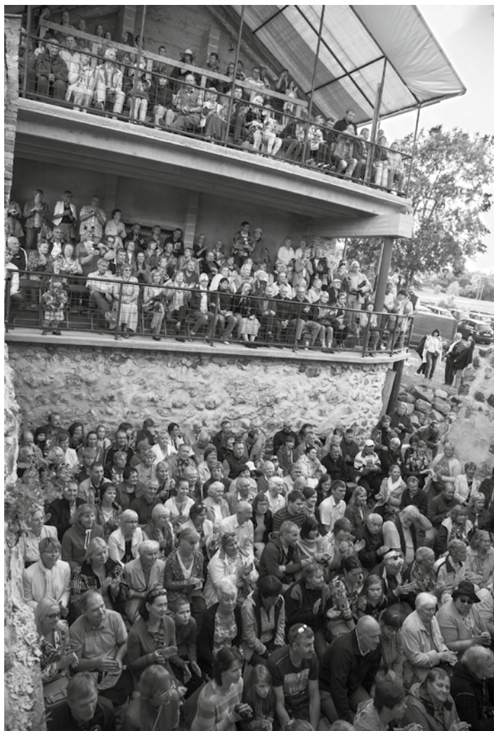
Täismaja Tääksi vesiveski vabaõhulaval.