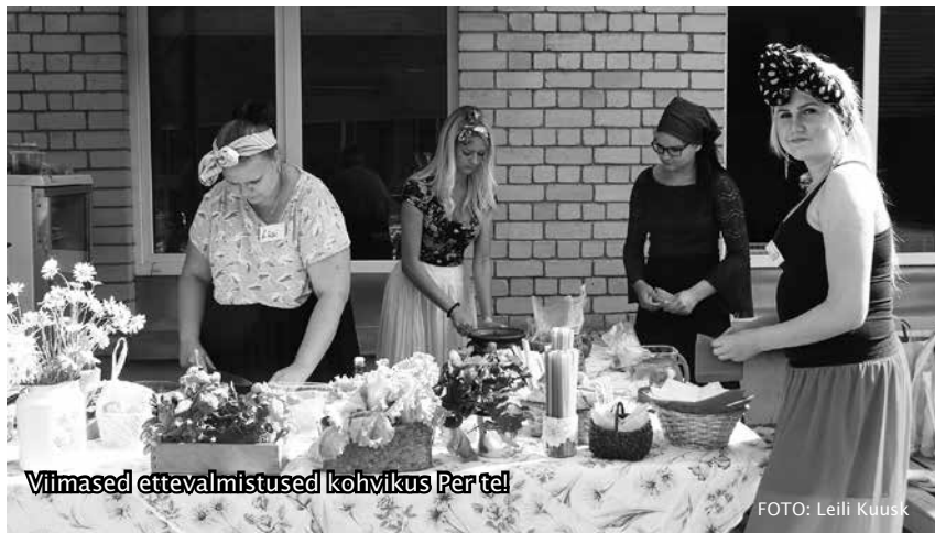
Viimased ettevalmistused kohvikus Per tel!