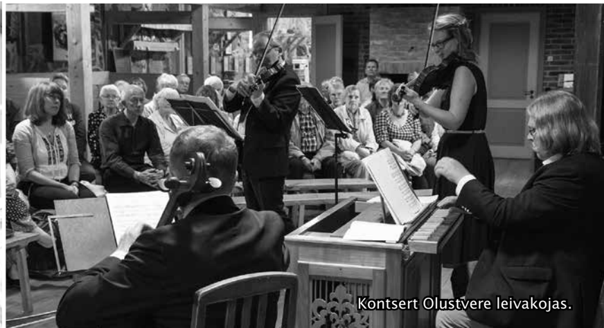
Kontsert Olustvere leivakojas.