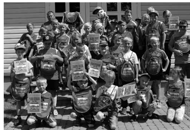
Jalgpallilaager on lõppenud.