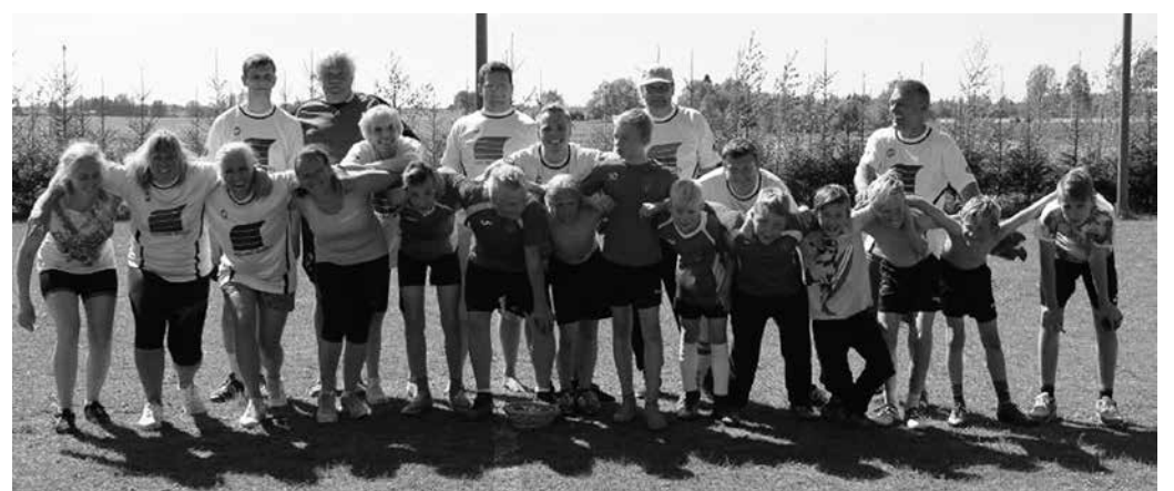
Volikogu versus noored.

programmist: korraldati seinaronimise meistri-võistlused, julged said ennast proovile panna kiikingu kiigel, täpsust sai lasta nii Robin Hoodi vibuga kui ka paintballi relvaga, kõigile olid turnimiseks ja hüppamiseks erinevad batuudid ja liiklusväljakul oli tõeline väikeste laste autoralli liikluslinnakus. Tehnikaringi võrridel sõita soovijate järjekord ei tahtnud kuidagi lõppeda. Laste rõõmuks oli kohal ka Pipi Pikksukk ning pannkoote pakuti lahkelt kõigile. Kohal olid ka Suure-Jaani päästekomando mehed