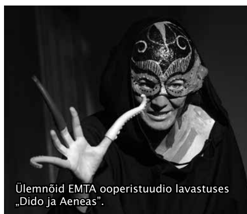
Ülemnõid EMTA ooperistuudio lavastuses „Dido ja Aeneas“.