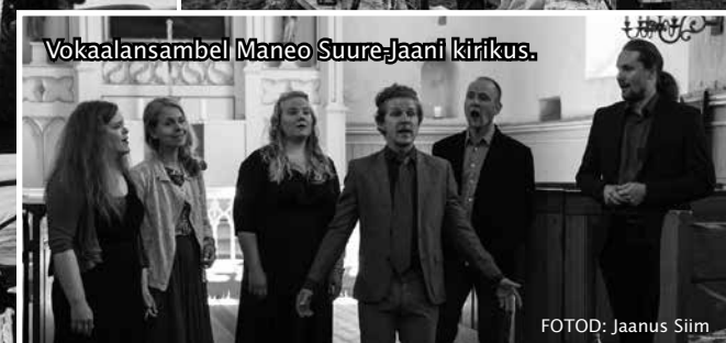
Vokaalansambel Maneo Suure-Jaani kirikus.