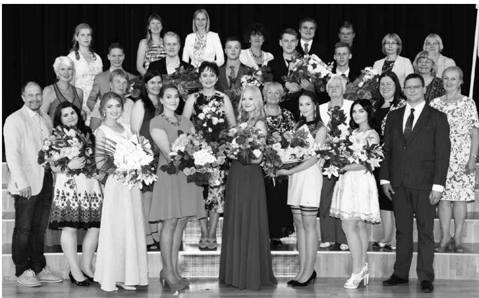
Suure-Jaani gümnaasiumi lõpetajad koos õpetajatega.