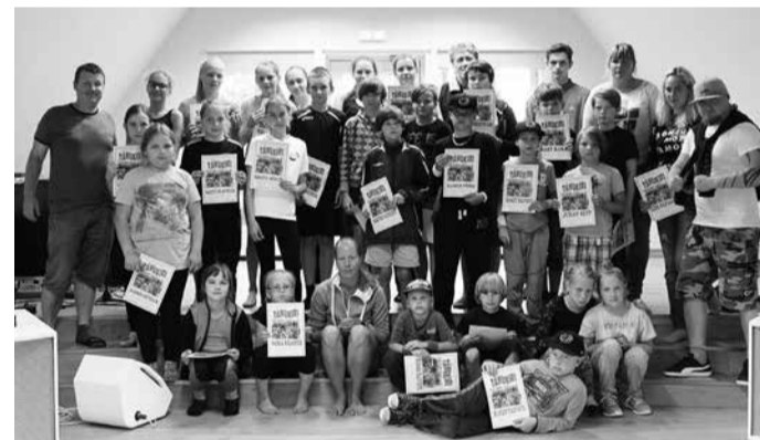
Segasumma suvelaagri pere.

Peale selle, et noortesüsteemi töindu, pakkus rõõmu ka meelelahutusprogramm. Noored käisid kinos, metsarajal maastikuvibu laskmas, Rahingel uute vespordialadega tegelemas ja võisteldi erinevatel sportlikel aladel. Töömalev suutis palju ära teha ja noored olid tõesti tublid. Täna rühmade juhendajaid, abilisid, kokkasid ning laagri kaasrahastajaid AS Põlluväga ja Eesti Noorsootöö Keskust, kelle abita poleks võimalik töölaagrit korraldada.