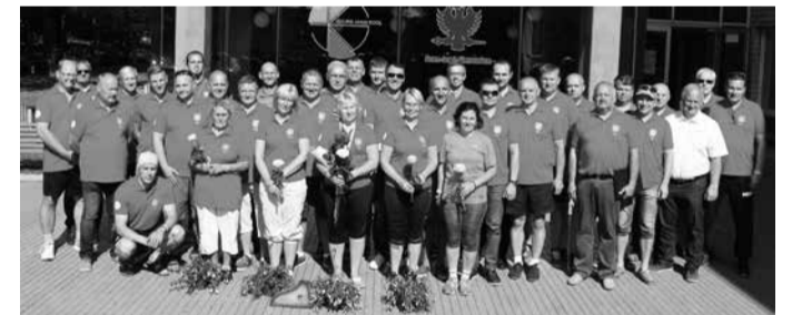
Osalejad Suure-Jaani kooli ees.