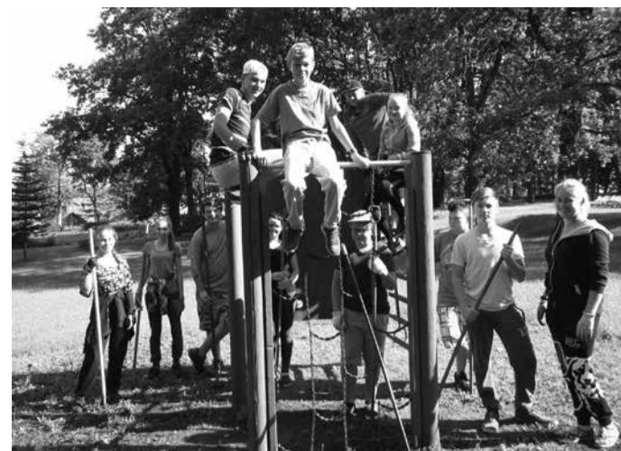
Töömalevlased mänguväljakut korrastamas.