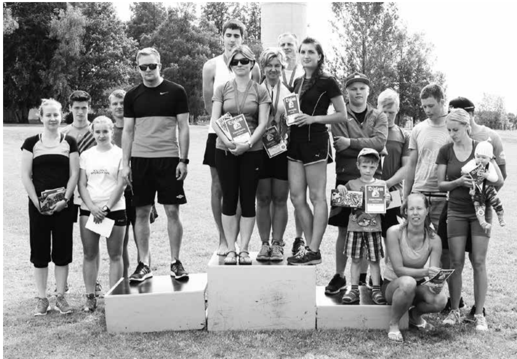
Pendelteejooksu parimad: Kildu, Sürgavere, Põhja Suure-Jaani.

Laupäeval, 15. juulil toimus Sürgaveres 44. Lehola-Lembitu mängude külade suvepäev. Ilm oli ilus ja võistlema oli saanud palju osalejaid. Mängude raames võisteldi pimevõrkpallis, nooleviskes, saapavisikes, pendelteejooksus, sopsuviskes ja sangpommi tõstmises. Mängud kujunesid igati tasavägiseks, kaht parimat küla jäi koondarvestuses lahutama vaid 1 punkt. Ülinapi võidu sai 185 punktiga Sürgavere esindus Kildu ees, kolmanda koha pälvisid 169 punktiga väga sitkelt võistelnud Põhja Suure-Jaani esindajad. Lisaks valla külade esindajatele olid pendelteejooksus vahvalt osalemas ka Sürgavere spordihoones laagris olnud väikeste võimlejate võistkonnad. Samal päeval võisteldi veel kahel Lehola-Lembitu mängude alal. Õhupüüsi laskmises jäi kokkuvõttes võit samuti Sürgavere külla, teiseks tulid Aimla ja kolmandale kohale Kildu laskurid. Palju põnevust pakkus ka jalgrat-