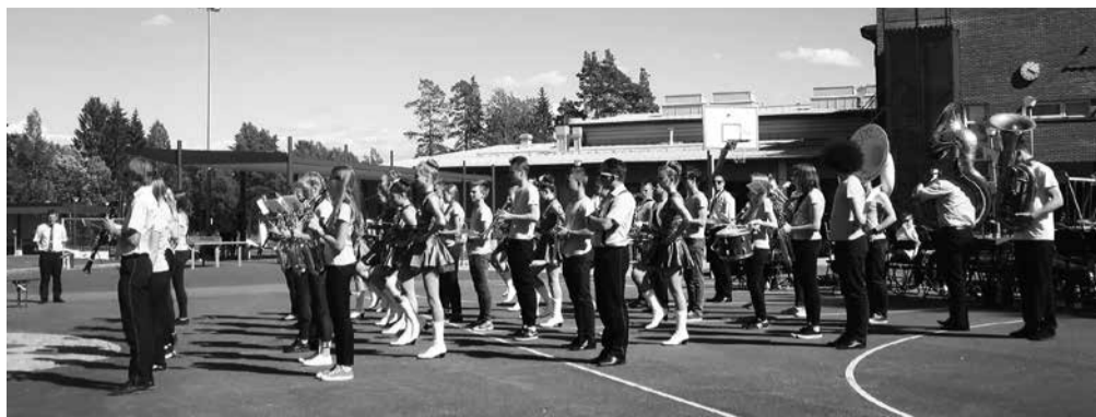
Kujundmarssimine Paana kooli ees...