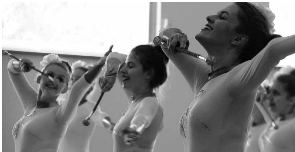
... ja Suure-Jaanis muusikat ning tantsimist.