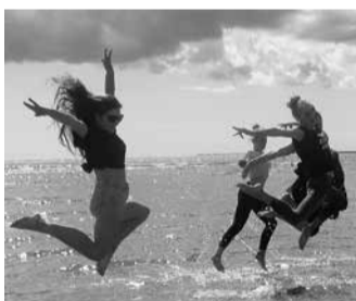
Tantsijad naudivad Pärnus merd