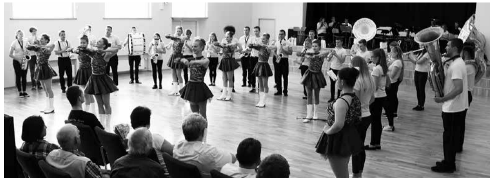
... ja Suure-Jaanis.