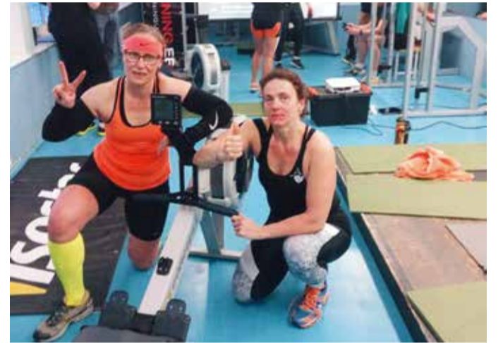
Reti maailmarekordi omanikuna.