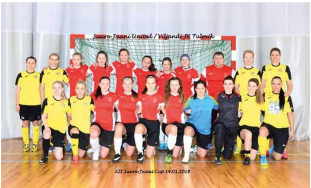
Naiste turniiri võitjad.

Laupäeval, 20. jaanuaril toimus Suure-Jaani Kooli võimlas XII Suure-Jaa-