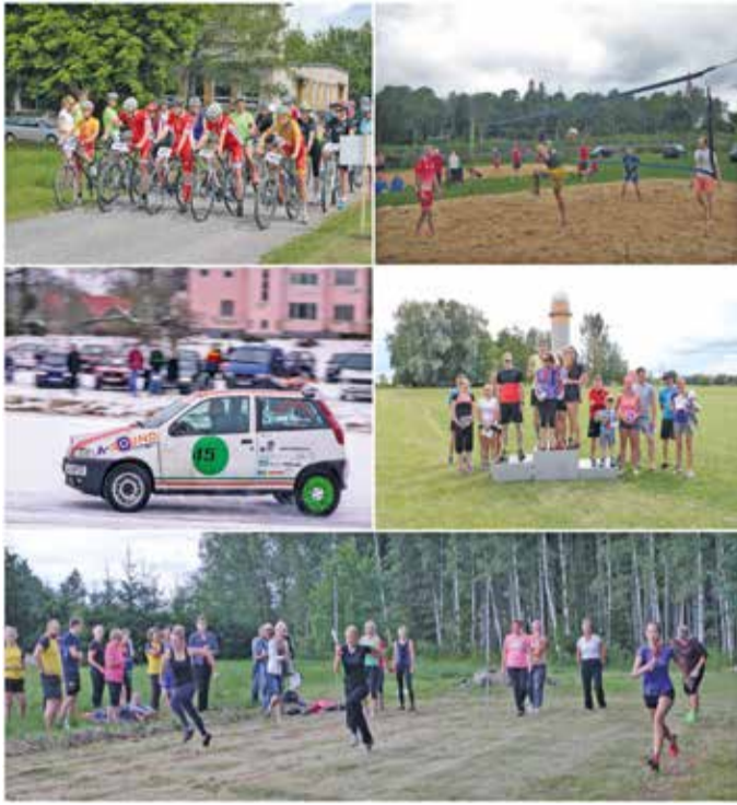
44. Lehola-Lembitu mängud.

44. Lehola-Lembitu mängud said teoks Rohelise Jõemaa Koostöökogu PRIA Leaderi programmi, Viljandimaa Kultuurkapitali ekspertgrupi ja Kultuurkapitali spordi sihtkapitali toel koostöös spordiklubidega Lehola 2005 ja Suure-Jaani United.