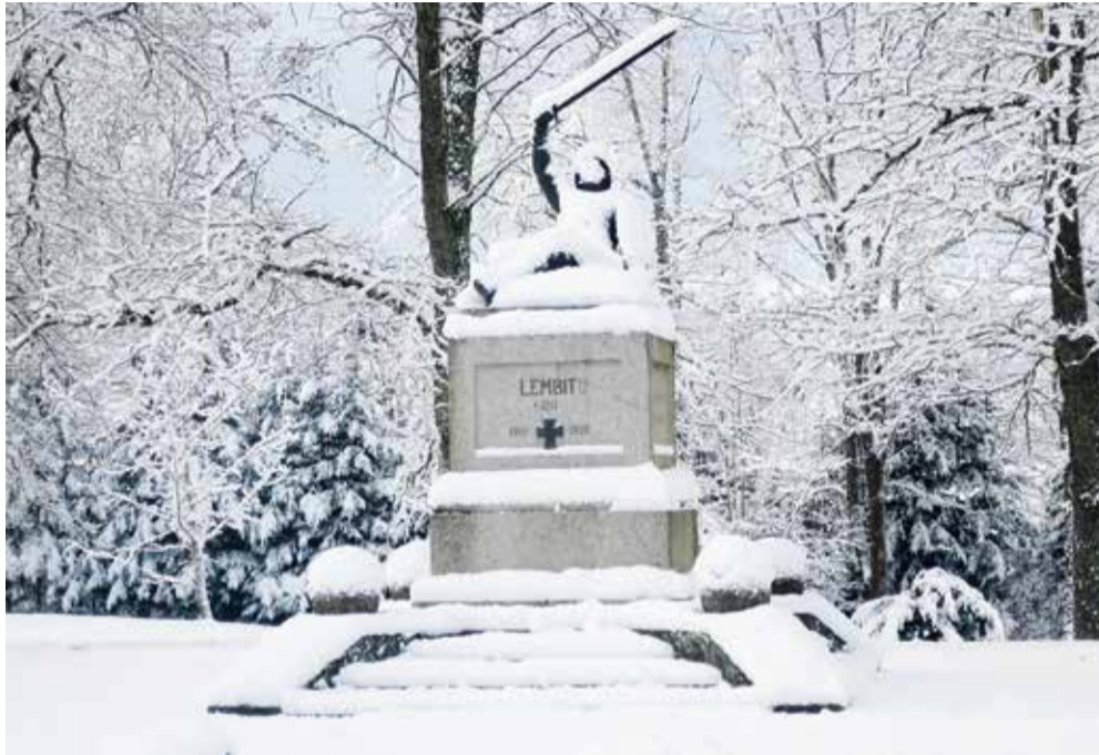
Vabadussõja monument Lembit Suure-Jaanis.