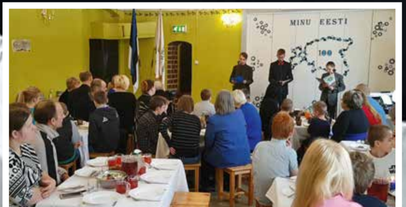
Lahmuse kooli pere mahtus Eesti Vabariigi 100. aastapäeva tähistamiseks ilusasti pidulauda – nagu sünnipäevade puhul ikka kombeks on.