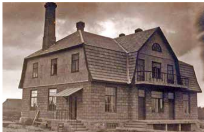
Kõpu meierei aastal 1930 (samal ajal asub nüüd külastuskeskus ja valla teeninduspunkt).

on ettevõtjad palganud inimesi, kes metsa alt ja kraavidest lund teedele kannavad ja kühveldavad. Nii on päev läbi hulk mehi pangidega kandmise ja kühveldamisega ametis. Olgugi, et niisugusel viisil vedamine väga vaevaline, loodetakse siiski määratud arv metsamaterjali jõgede äärde vedada.“