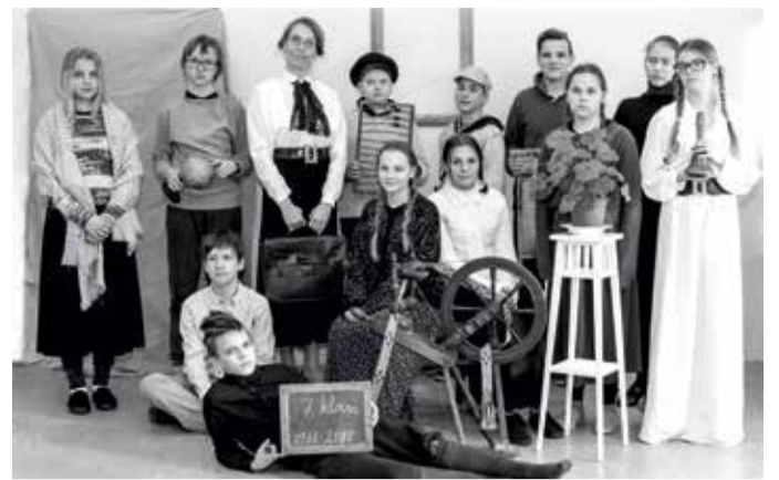
Eesti Vabariigi sünnipäevakuu Olustvere põhikoolis.