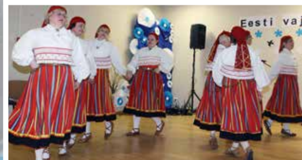
Sürgavere küla Eesti Vabariigi 100. aastapäeva pidulik aktus Sürgavere koolis.