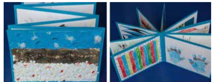
Olustvere lasteaia Piilu kingitus Eestile – voldikalbum „Minu Eesti 100“.