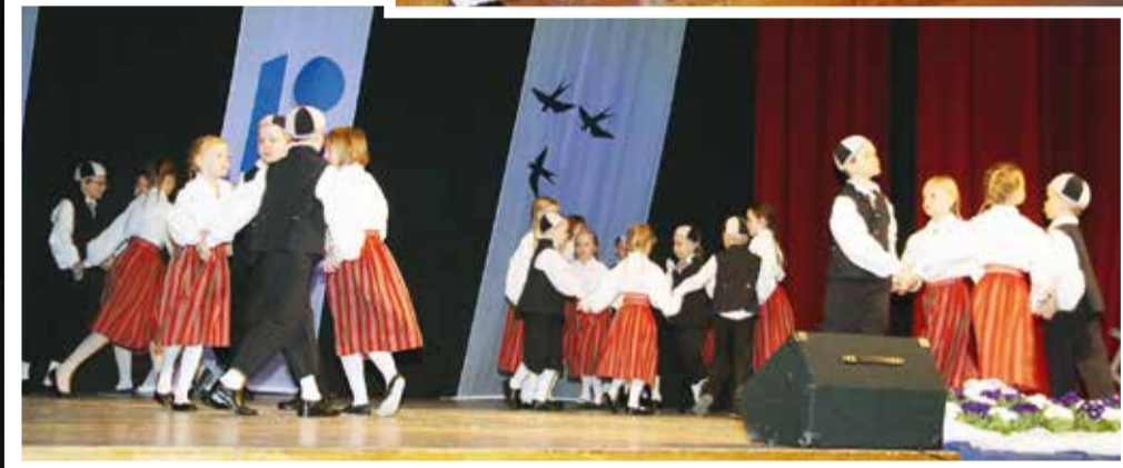
Kontsert „Eesti Vabariik – 100” Vastemõisa rahvamajas.