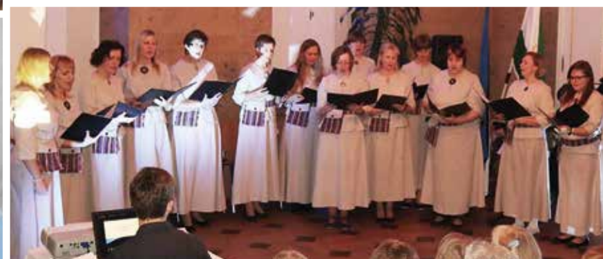
Aktus „100 aastat Kõpus” Suure-Kõpu mõisas.