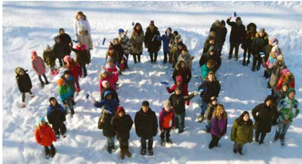
Kõpu põhikooli lapsed ja õpetajad moodustasid juubeli auks oma 100.

18. märtsi 1930. aasta Sakala kirjutab: „Igal aastal on Kõpu metsades, mis ulatuvad kuni Pärnu piirini, leidnud palju inimesi tööd puulõikamisega kui ka vedamisega. Viletsast talvest hoolimata käib Kõpu metsades puulõikamine ja jõgede äärde väljavedu hoolega. Veetakse vankritega ja ka regedega. Et viimastega läbipääsemine kergem oleks, sest teed on päris paljad, siis