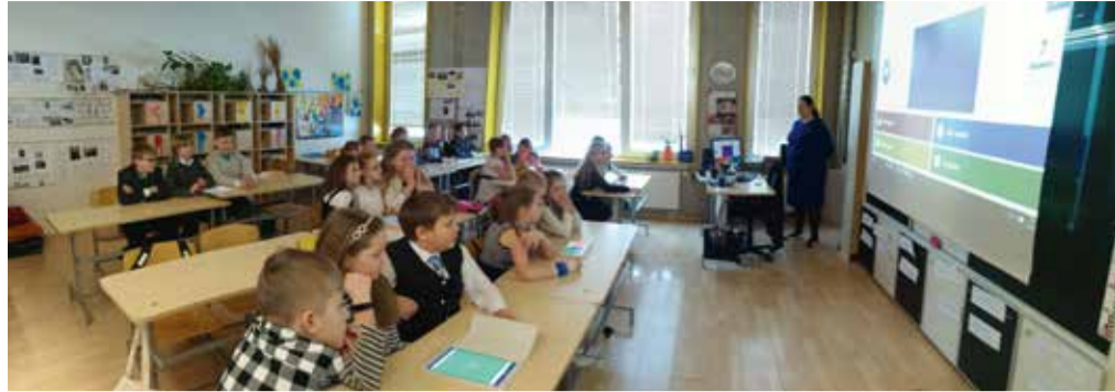
Tahvelarvutite rakendamine ajaloo tunnis, kasutades keskkonda Kahoot.

Kõik see seab uued nõudmised ning võimalused ka koolidele. Viimasel ajal ongi olude sunnil koolidesse tööle asunud uued spetsialistid - haridustehnoloogid. Nende peamiseks ülesandeks on aidata õpetajatel kasutada õppeprotsessis kaasaegseid digivahendeid. Mõõdas on aeg, mil õpetaja pidi valge kriidiga