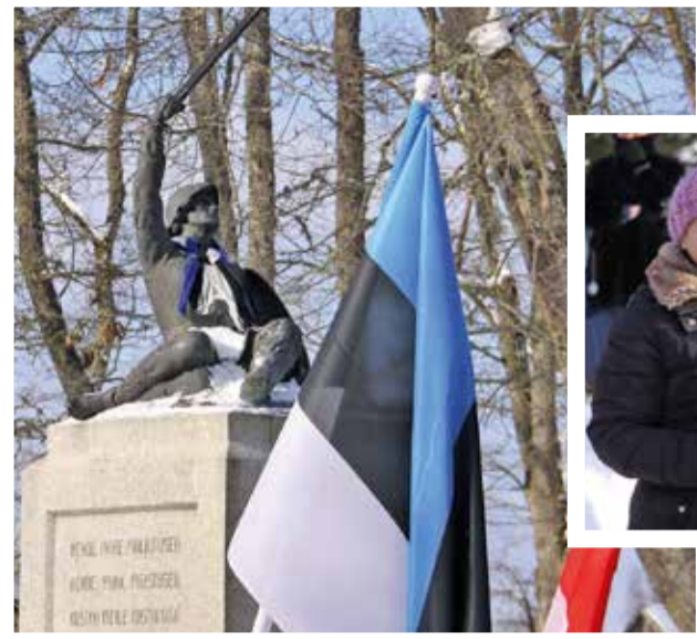
Eesti Vabariigi 100. aastapäeva aktusel Suure-Jaanis Lembitu platsil.