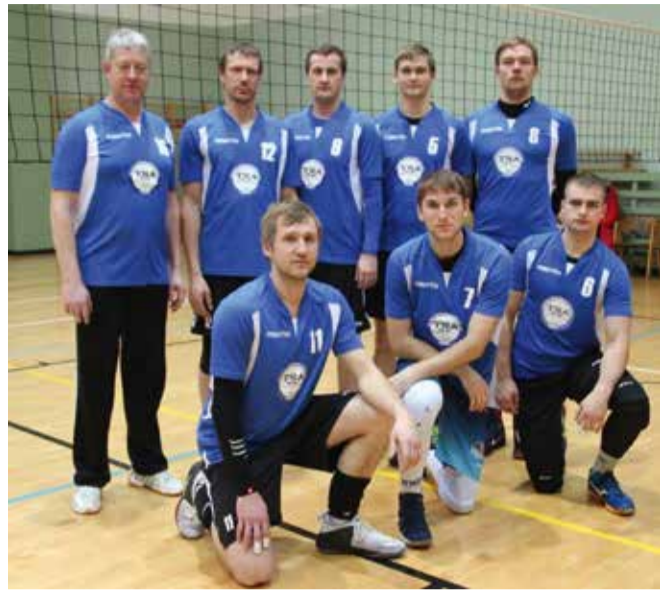
XX sariturniiri võidukas meeskond.

Laupäeval, 17. veebruaril toimus Sürgavere spordihoones XX meeste võrkpalli ja IX naiste sariturniiri viimane mängudepäev. Turniir oli igati põnev ja kaasahaarav ning alles viimasel etapil selgus võistkondade paremusjärjestus. Naiste arvestuses saavutas viimasel turniiril esikoha meie naiskond, kes lisas üldarvestusse 6 punkti. Teise kohaga lõpetas Saarepeedi ja kolmanda kohaga naiskond Vallakad. Viimane etapivõit meie naiskonda paraku kuldsel medalile enam ei viinud, puudu jäi ainult üks punkt. IX sariturniiri võitis 27 punktiga Saarepeedi naiskond, meie naiskond sai 26 punktiga teise koha ja kolmanda kohaga lõpetas võistluse 16 punktiga Päri naiskond. Neljanda kohaga lõpetas naiskond Vallakad 13 punktiga, viienda kohaga