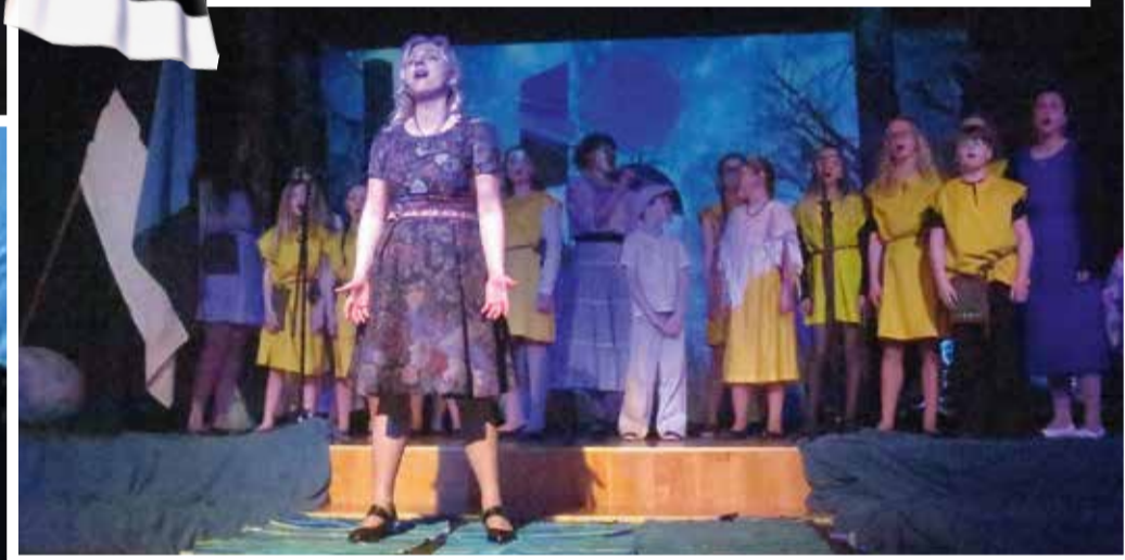
Sünnipäevakontsert „Alguse Valguses” Suure-Jaani kooli aulas.