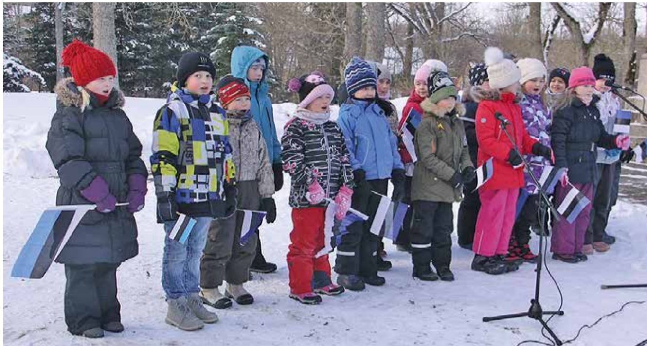
Suure-Jaani kooli esimeste klasside lapsed Eesti Vabariigi 100. aastapäeva pidulikul aktusel Lembitu platsil.