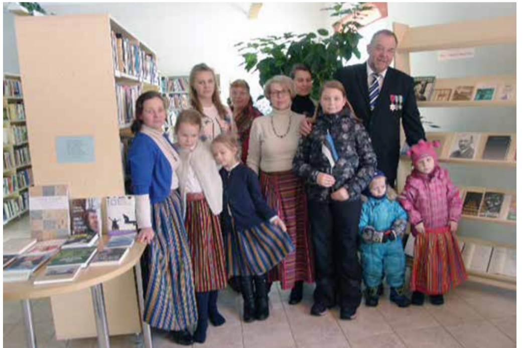
Raamatukogu sõbrad vabariigi sünnipäeva eel.