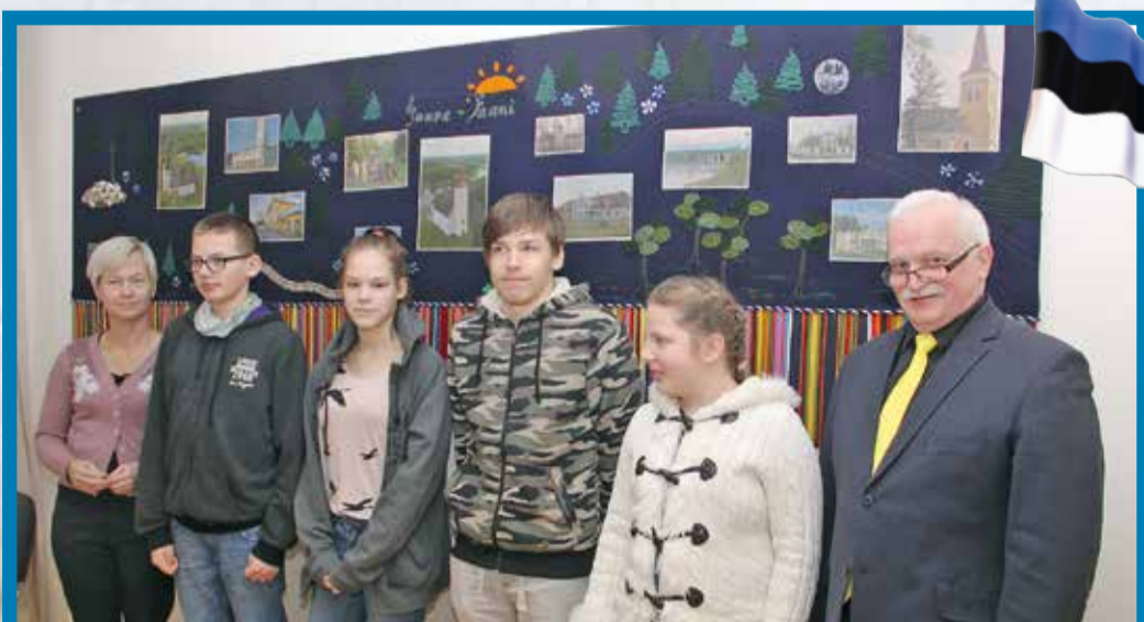
Põhja-Sakala vallavolikogu veebruarikuu istungil andsid Lahmuse Kooli esindajad üle kingituse – vaiba, mida aitasid kududa 100 inimest ja mis jääb ehtima vallamaja saali.