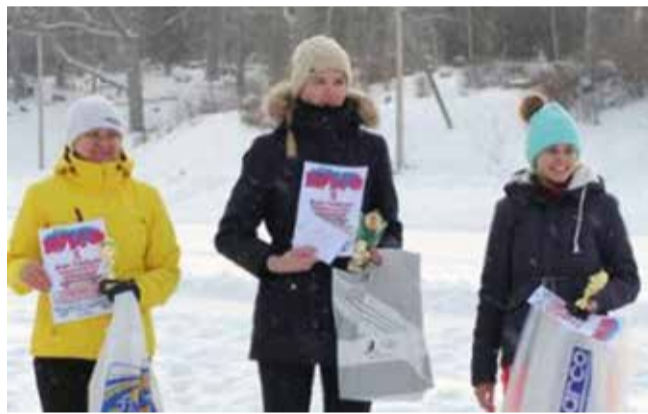
Sõiduautoide jääraja parimad naised.

45. Lehola-Lembitu mängude avalana toimunud jäärajasõidus võisteldi naiste arvestuses ja meeste arvestuses esiveoliste masinatega. Alavõit läks Kõidama külale, teise koha saavutas Sürgavere esindus, kolmanda kohaga lõpetas avaala Võhma. Neile järgnesid Kildu, Olustvere, Põhja/Suure-Jaani, Lõuna/Suure-Jaani ja Vastemõisa. Võistluse auhinnalauda aitasid täiendada Kaspar Jürgens, Rallipood.ee ja Lehola Varahaldus OÜ. Eri-