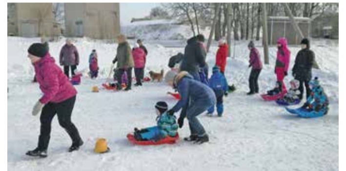
Ja siis olidki käes vastlad!