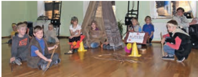
Muinasaeg 2. klassi õpilaste esituses.

Meie koolis on traditsiooniks korraldada aprillis tore loomingu päev. Seekordse ürituse teemaks oli „Pildikesi Eesti ajalooost“. Klasside vahel jaotati erinevad ajaloolised sündmused, mida õpilased esitasid nii näidendi kui ka põnevate ettelugemistega. Esindatud oli muinasaeg, Võnnu lahing, Jüriöö ülestõus, vanaaja kool, ärkamisaeg, regilaul, 1918. a Eesti iseseisvumine, ENSV aeg (pioneerid) ning esinemise lõpetasime Balti ketiga.