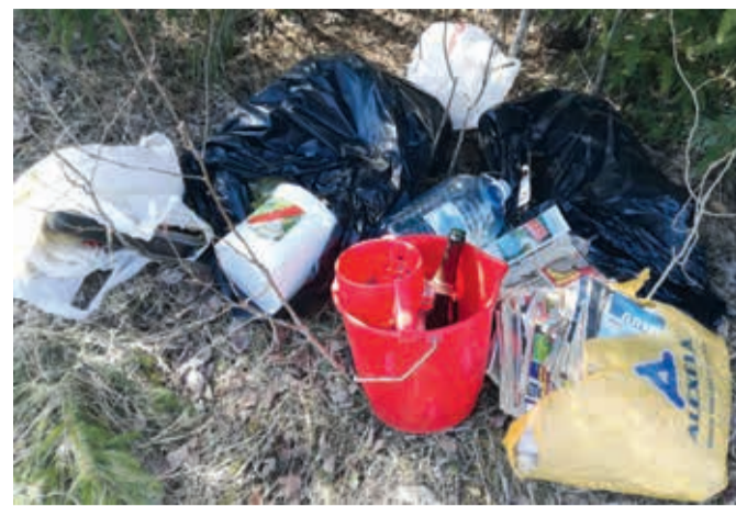
Prügi Jälevere külas.

Prügi koht ei ole aga kindlasti looduses! Jäätmed ei reosta mitte ainult loodust, vaid kujutavad endast ohtu loomadele, lindudele ja looduses viibivatele inimestele.