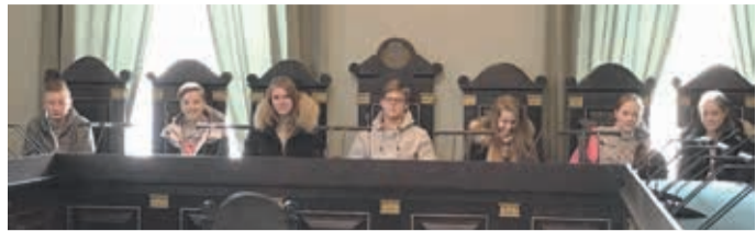
Riigikohtu laua taga.