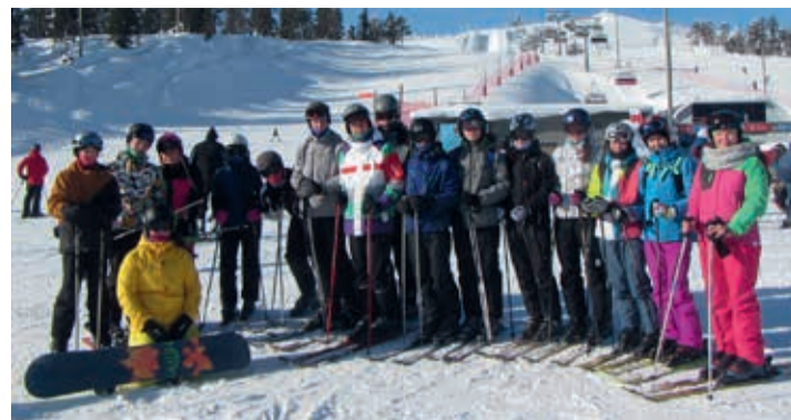
Põhja-Sakala valla noored ja noorsootöötajad Rukas.

Igal aastal suure reede paiku lähevad meie valla 14 aktiivset noort, kolm juhendajat ja bussijuht Soome. See võib kõlada nagu tavaline reis, kuid seda see kindlasti pole. Võib öelda, et tegu on juba traditsiooniga: nimelt kuus aastat on suurepärane koostöö Jokioise vallaga Soomes ja meie noortele on võimaldatud kolmepäevane suusareis Lapimaale. Mäel, kust noored alla tuhisevad, käivad suusatamas ja lumelauaga sõitmas mitmed tuhandet inimesed. Ruka on üks Soome palavamalt armastatuid suusakuurorte. Ise juba kolmandat korda käies läksin ka seekord mäele sära silmis ja suures õhinas. Ruka pakub oma järskude nõlvadega mõnusaid väljakutseid, laugete metsaradadega põnevust ja lummava vaatega mäe tipust puhast silmailu.