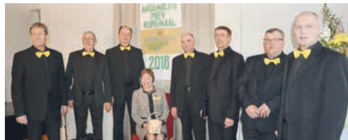
21. aprillil toimus Kuremaa lossis 21. korda traditsiooniline vokaalansambli päev „Vooremaa 2018“. Seal osalesid mittekutselised vokaalansamblid neljas kategoorias üle riigi. Viljandimaad esindas äsja 30. juubelikontserti pidanud Põhja-Sakala valla Vastemõisa rahvamaja meesansambel Pange Poisid.