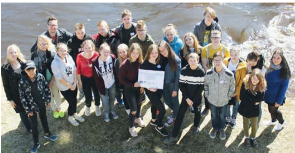
Eestvedajate programmi noored.