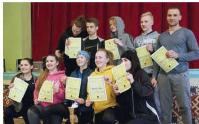
Kirivere vilistlaste võidukas võistkond.

Kasutan siinkohal võimalust tänada ettevõtmise kordamineku eest lisaks võistlejatele