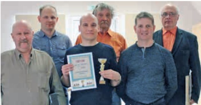
Karikaturniiri kuus parimat.