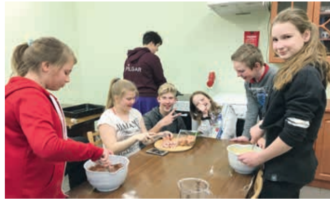
Õhtusöögiks valmisid pitsad ja muffinid.