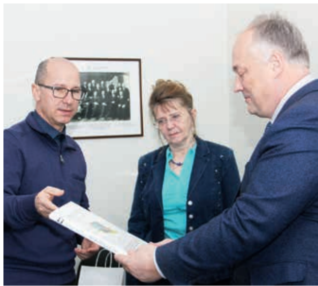
Külalised Põhja-Sakala vallamajas.