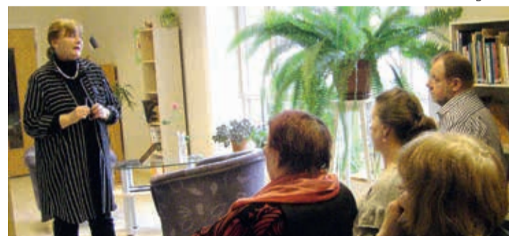
27. aprillil oli Kõo raamatukogus külas Riigikogu liige Helmen Kütt. Külaline tutvustas muudatusi pensionisüsteemis ja teravhoiust, rääkis hoolekandeteenustest ja sellest, kuidas peaks tulevikus olema rahastatud hoolekanne. Tõi välja mõned Eesti toetuste eelised võrreldes Läti ja Soomega. Lõpetuseks pakkus külaline kõigile kohvi ja kringlit ning kutsus sügisel külla Riigikokku. Helmeni energilisus ja positiivne eluhoiak tegi kõigil kohaletulnutel meele rõõmsaks.