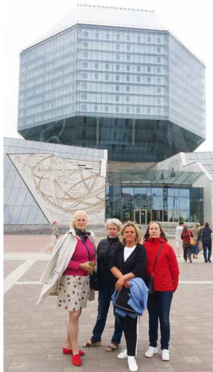
Põhja-Sakala valla raamatukogutöötajad Minskis Valgevene rahvusraamatukogu ees.

Viimaseks ööks Minskisse sõites tõdesime, et hakkabki meie reis lõppema. Reisimuljed olid nii head, et julgeme edaspidi kõigile huvilistele Valgevenesse sõitu soovitada.