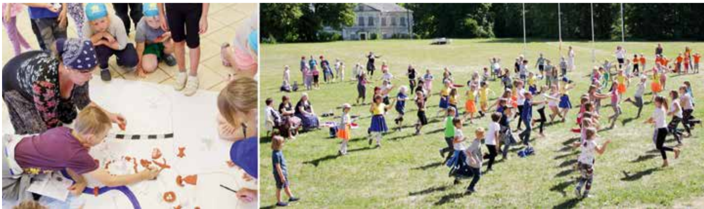
Kihelkonna kaardile tehti oma maamärgid. Hoogne lõputants.