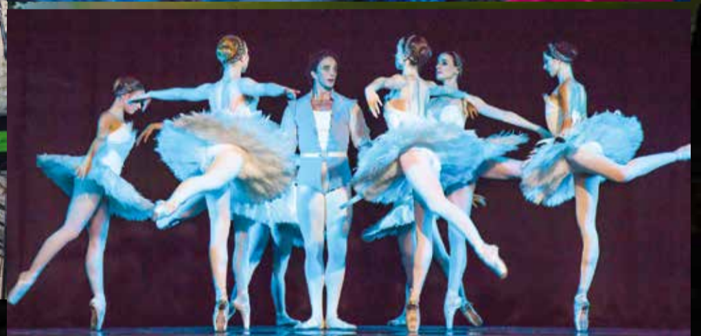
RO Estonia ballett „Luikede järv” Suure-Jaani kooli aulas.