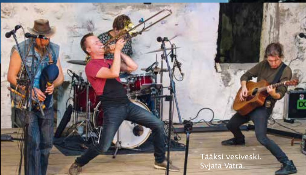
Täaksi vesiveski. Svjata Vatra.