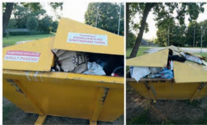
23.08.2018 Suure-Jaani Konsumi juures olevad konteinerid.

Pakendikonteinerisse ei tohi panna olmejäätmeid (lehtklaasi, pirne, kummist tooteid, mänguasju jms), ohtlikke jäätmeid ja muid sinna sobimatuid jäätmeid.