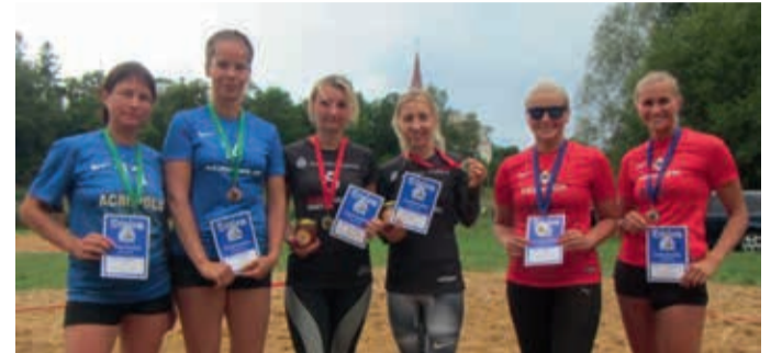
Rannavolle parimad mehed ja naised.