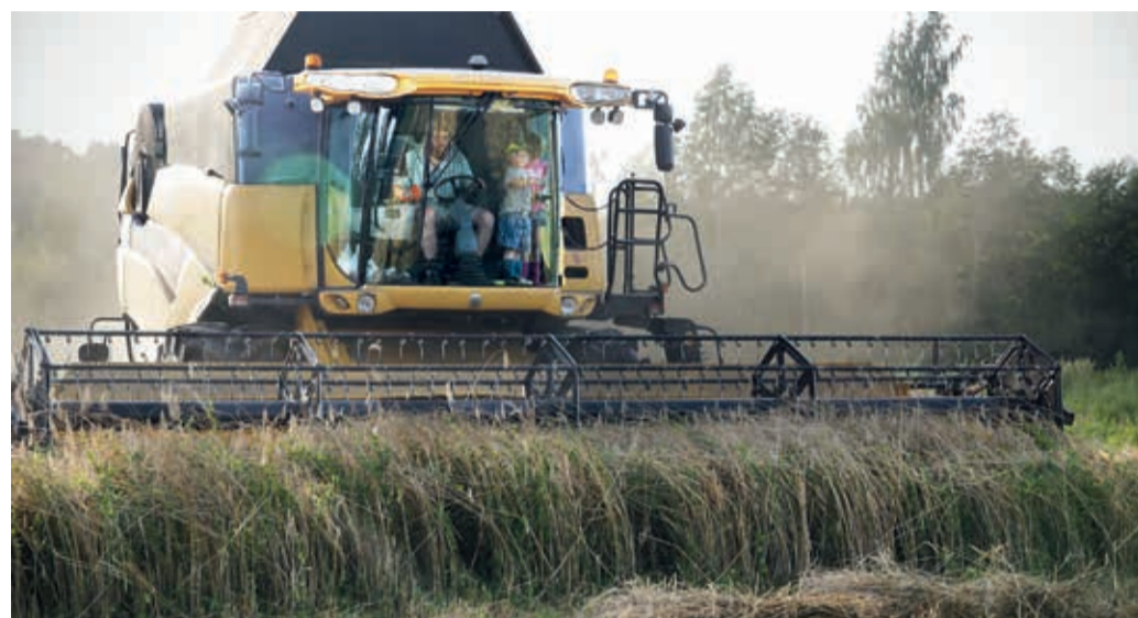
Suurem osa pudenemishohus saagist tuli sel aastal kombainiga koristada.