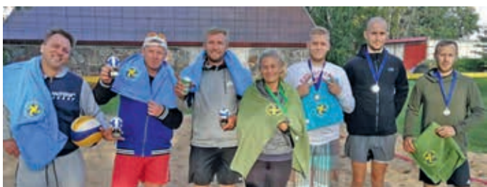
Ülde volle parimad.