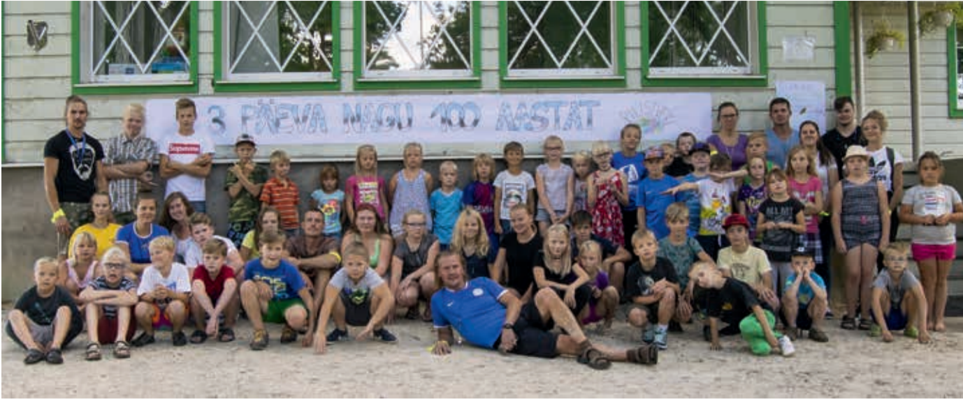
Pilistvere kihelkonna neljanda lastelaagri pere.

Pilistvere kihelkonna lastelaager toimus sel aastal 4. korda, kandes Eesti Vabariigi juubelist inspireeritud nime „3 päeva nagu 100 aastat“.