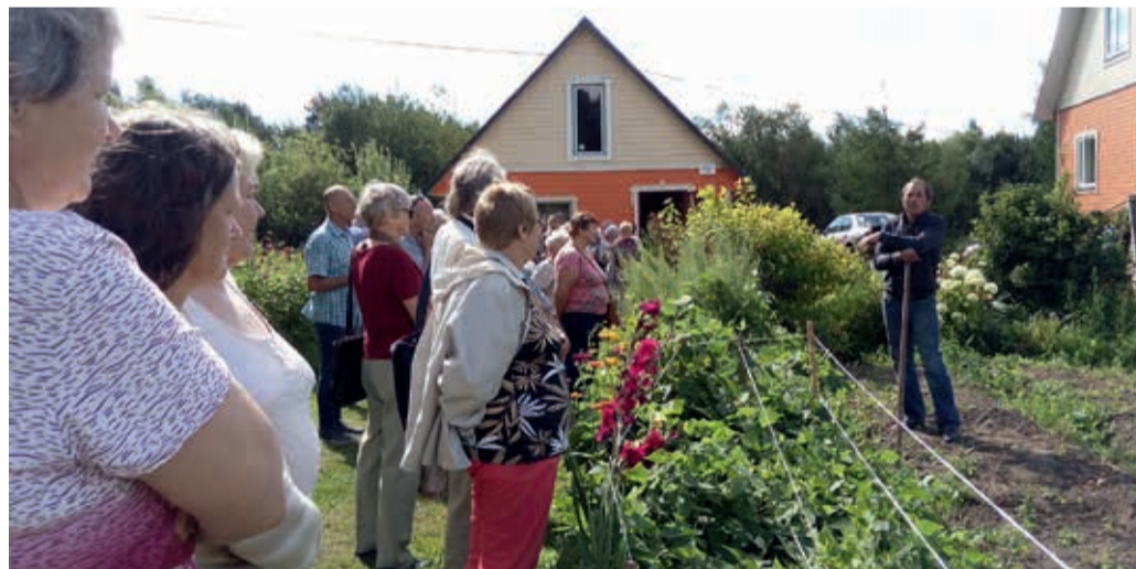
Sibulatalu peremees tutvustas külalistele sibulakasvatuse saladusi.

Peipsi sibul eristub teistest omasugustest tugeva maitse ja lõhna poolest. Peremehe sõnul, kes poisikesena koos isaga laatadel käis, hindas asjatundja kauba väärtust muuhulgas ka kerge suitsulõhna järgi. Suitsusaunas kuivatatud sibul säilis paremini! Sellist muinastehnoloogiat kasutatakse teadaolevalt veel tänapäevalgi Võrumaa saunades. Mujal