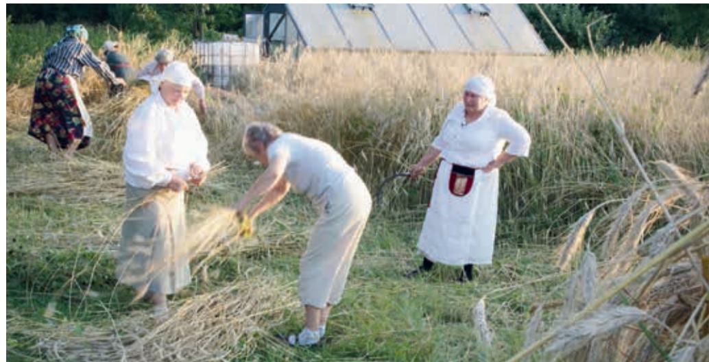
Koksvere maanaised Matsimardi rukkipoollul.