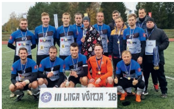
III liiga Eesti parimad.

Duubelvõistkond mängis IV liigas ning lõpetas Lõuna piirkonnas 4. kohaga. Kuigi duubelvõistkonna mehed III liiga poolfinaalis ning finaalis põhivõistkonda abistada ei tohtinud, on osa sellest toredast tiitlist ka nende oma, sest ilma duubli abita poleks olnud lihtne piirkonna alagrupi võitjaks tulla ning seega finaalmängudeni jõuda. Super hooaeg, mehed, oleme teie üle uhked! Aitäh kõigile valda esindanud jalgpalluritele, treeneritele Sergei Vassiljevile ja Indrek