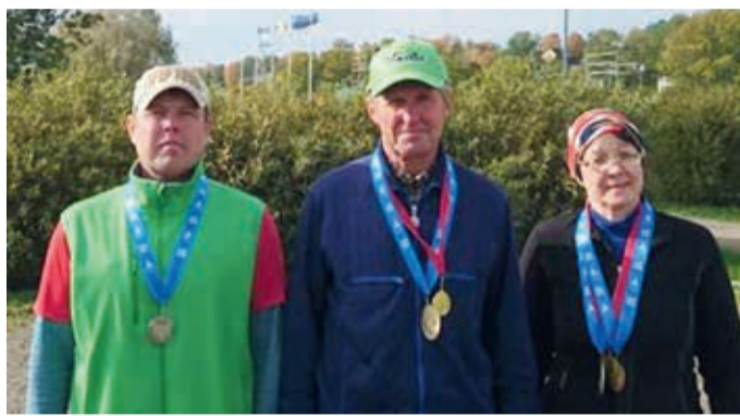
Maakonna meistrivõistlused petangis.

Läbi suve toimusid Võhma petangiväljakutel erinevad võistlused, Põltsamaal suve lõpus saavutatud kolmikvõit näitas valla petangimängijate head vormi. Suurepärase tulemustega lõppesid meie mängijate jaoks ka 6. oktoobril toimunud Viljandimaa meistrivõistlused. Meie valla sportlased saavutasid üksikmängus kolmikvõidu ning paarismänguski saavutati kuld-, hõbe- ja pronksmedalid.