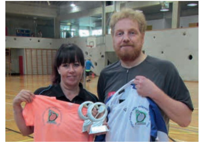
Valla meistrid sulgpallis.