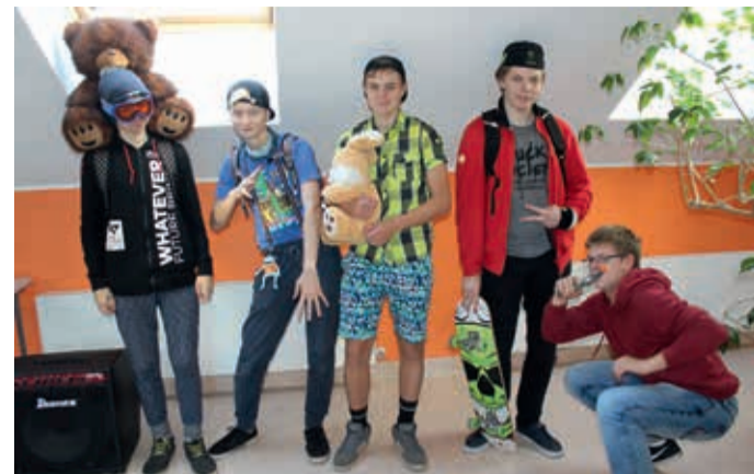
Poisid olid stiilipäeval kaasa võtnud mänguasjad ja palju krutskeid.

Kiriveres on kooliharidust antud juba 181 aastat, kuid praegune koolimaja valmis 114 aastat tagasi. On saanud traditsiooniks, et esimese kooliveerandi viimasel nädalal tähistamegi koolimaja sünnipäeva.