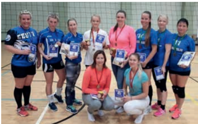
Naiste võrkpalli parimad võistkonnad.