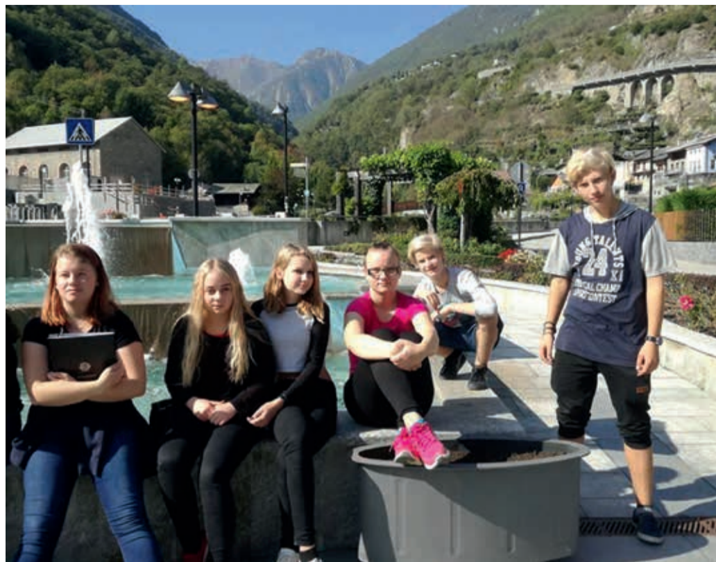
Kirivere õpilased Itaalia mägede taustal.

Aruteludest vabal ajal oli meil suurepärase võimalus tutvuda Hõne vanalinnaga, jalutada Alpides, maitsta traditsiooni-