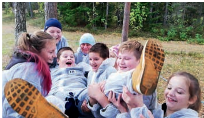
Kirivere hooliv klass Kloogaranna õppepäeval.