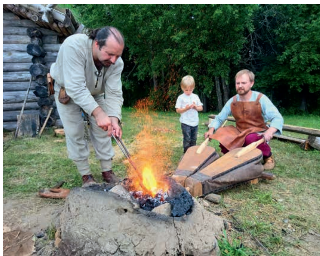
Toorraua kuumutamine ääsil.

Maalasti küla ümbritsevatel soodest ja allikaniredest on näha rauarikast, ookrast punakat vere värvi vett, soos leidub rauamaaki, mis meie esivanemad rikkaks tegi. Retked nendel radadel on põnevad. Sattusin nende alguspunkti, kui aastaid tagasi sai hakatud Maalastis üles ehitama vana talukohta, põldu harima, lambaid ning mesilasi pidama. Esimesed märgid muistsest asustusest tulid põlluharimisel, kui künnikihis tuli nähtavale tänaseks Tartu Ülikooli arheoloogiaosakonda jõudnud