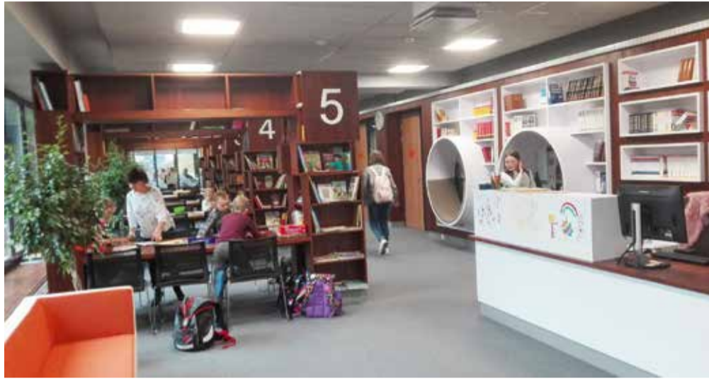
Raamatukogu Raatuse koolis.

Iga külastatav kool oli omanäoline, oma loo ja tõekspidamistega. Kaasa toodi positiivseid näiteid heast meeskonnatööst, hästi korraldatud projektöppest, nutikatest siseruumi- ja õuealalarendustest, leidlikust õp-