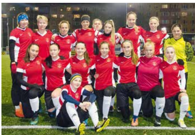
JK Tulevik/Suure-Jaani United ühisnaiskond.