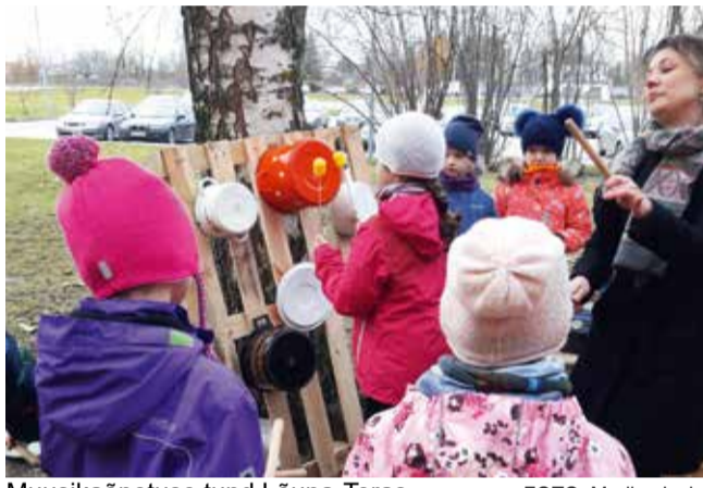
Muusikaõpetuse tund Lõuna-Teras.