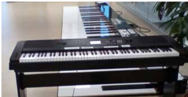
Vahetunni vahendid GAG-is.