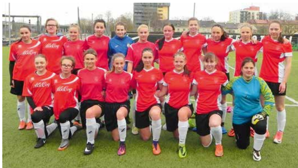
U-17 tüdrukute võistkond.

Eelmisest lehest sai lugeda, et meeste III liiga võistkond krooniti Eesti meistrivõistluste võitjaks. See suurepärase tulemus tõstis meeskonna järgmiseks hooajaks II liigasse. Meeste võiduga samaaegselt oli veel õhus õrnema soo esindajate võimalus U-17 tüdrukute meistritiitlit püüda. Nagu spordis ikka, ei lähe asjad iga kord nii nagu tahaks. Suure-Jaani United U-17 tüdrukud tegid suurepärase hooaja ja krooniti hooaja lõpuks Eesti meistrivõistlustel pronksmedalitega. Täiesti pöörase hooaja tegi aga JK Tulevik/Suure-Jaani United ühisnaiskond, kes jõudis hooaja lõpuks üleminekumängudele meistri liigasse. Mänge peeti Tartu Tammeka naiskonna vastu ja kahjuks sel aastal jäi meistrisarja uks naiskonna ees veel suletuks. Meie 15-aastased tüdrukud raputasid aga kõvasti jalgpalliüldsust oma suurepärase mängudega. Samuti võib olla õnnelik, et järelkasvuvõistkonnad liiguvad edasi hea motivatsiooniga. Suure-Jaani United U-15 saavutas rahvaliigas III koha, sealjuures kolmanda koha kohtumises kohtuti teise meie valla klubi SK Tääksi eakaaslastega. Sama klubi U-13 võistkond saavutas oma alagrupis 2. koha. SK Tääksi osales Ees-