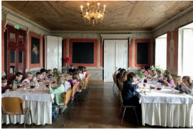
Kooliõpilaste pidulik lõunasöök.

Märtsikuus alustas jalgpallitreeningutega Kõpu