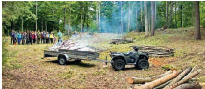
Talgupäeva järel nägi külaplats Kuusikumäel välja selline.