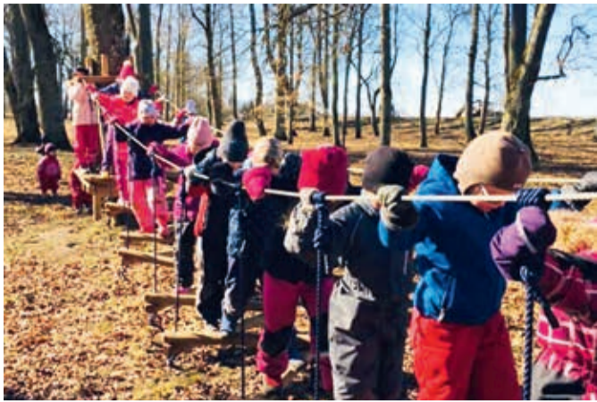
Lapsed Kabala seiklusrajal.