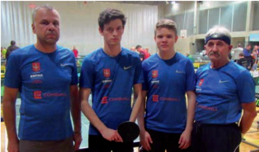
V liiga lauatennise võistkond.