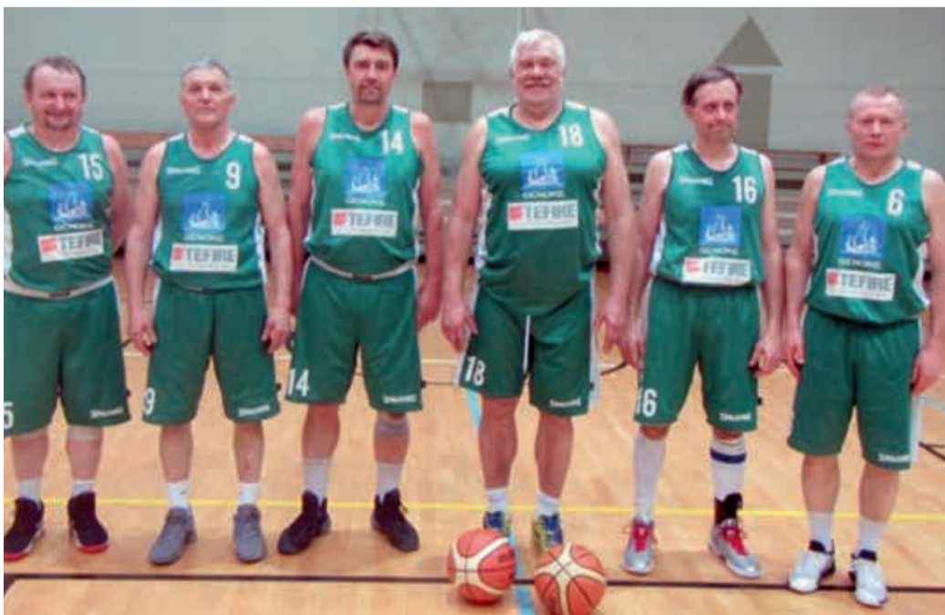
Eesti meistrivõistlustelt pronksmedal.