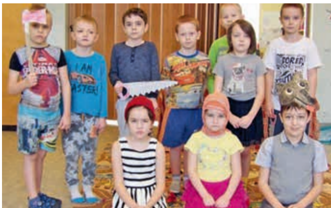
Rukkilillede rühma näidend „Punamütsike“.

Veskiellide rühma etendus „Labakinnas“ toimus samuti rühmaruumis, mida külastas terve lasteaed. Taat oli metsa ära kaotanud labakinda, mille metsaelanikud võtsid enda koduks. Kinda sees leidsid kodu hiir, konn, jännes, rebane,