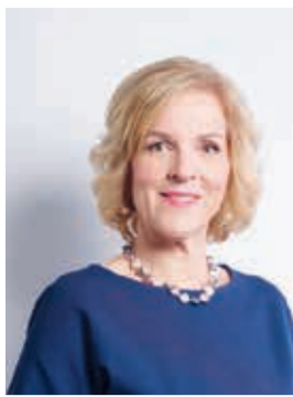
KAIA IVA sotsiaalkaitseminister

Me kõik loodame saada üks päev toimekalt ja rõõmsalt vanaks. Me küll ei mõtle sellele tihti, pigem siis, kui vanavanematele külla lähme või kui eaka naabriproua palvel leivakotiga poest tuleme. Vanaks olemine on igati tore niikaua, kui on tervist ja jaksu ise oma toimetamisega hakkama saada, on piisavalt tööstressita vaba aega ning toredad hetked lapselastega. Ebamugavused tekivad siis, kui organismi kulumine hakkab tugevalt märku andma: valu haiget tegemas ja jõudu napilt. Siis tulebki leida lahked naabrinoored või omavalitsuse abistaja, kes leiva poest toovad ja muid asjaajamisi aitavad toimetada. Küllap olete aga tähele pannud, kuidas pisike ilmakodanik, ise vaevast käima õppinud ning esimesed sõnad rääkimiseks selged, tahab oma asju ise toimetada ja annab sellest nõudlikult teada: „Ise, ise!“ või „Anna, anna!“. Iseseisvus ja hakkamasamine, nagu ka sotsiaalsus ja teiste inimestega suhtlemine, muudavad meie elu täisväärtuslikuks. Seda iga vanuses.