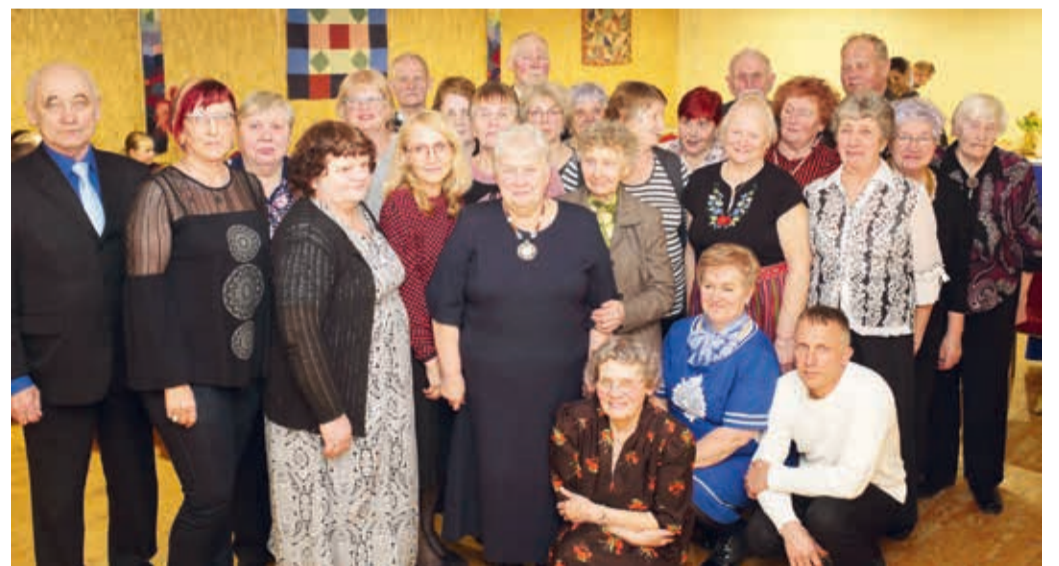
Seltsi liikmed ja sõbrad seltsimajas 20. aastapäeva tähistamas.

Tegevusi on olnud selle 20 aasta jooksul väga erinevaid, millest esimesteks võib nimetada leivaküpsetamist, verivorstide tegemist ja kangastelgedel kalsuvaipade kudumist. Kuid ettevõtmistest suurimaks võib pidada rukkilõikustalguid Pilu talus. Selle ettevõtmise juures oli väga tore, et lisaks seltsi liikmetele olid talgutel ka nende pered, lapsed ja lapselapsed,