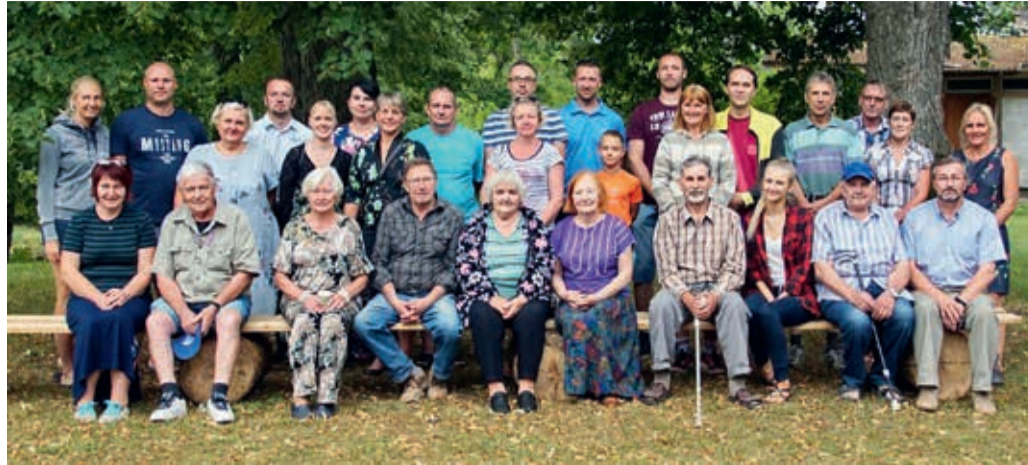
Esimene külakoosolek augustis 2018.

Pean ennast nooreks inimeseks, kellele meeldib maal elada. Meeldib maaelu privaatsus, vaikus, see, et mu lapsed saavad rahulikult oma aias ringi joosta ja mängida. Ning veel palju muud. Aga ma tahan suhelda ka teiste inimestega. Kui kusagil tuleb mulle vastu n-ö oma küla mees, tahan ta ära tunda ja tere öelda. Kas teie tunnete oma küla inimesi? Hea on aeg-ajalt kokku saada ja vestelda oma küla meeste ning naistega, kellel nii mõneski asjas võib olla sama mure või miks mitte rõõm, mida teistega jagada.