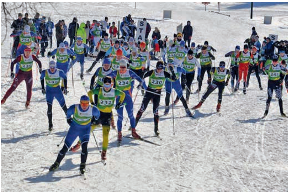
Talimängude teatesõidu start.