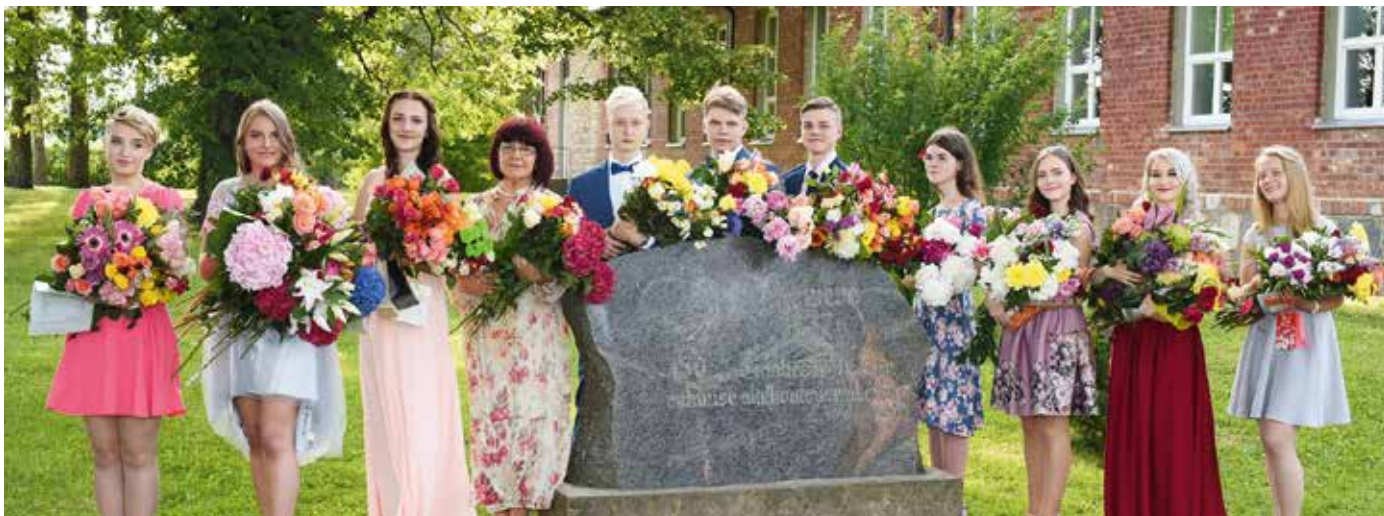
Kirivere kooli lõpetajad.