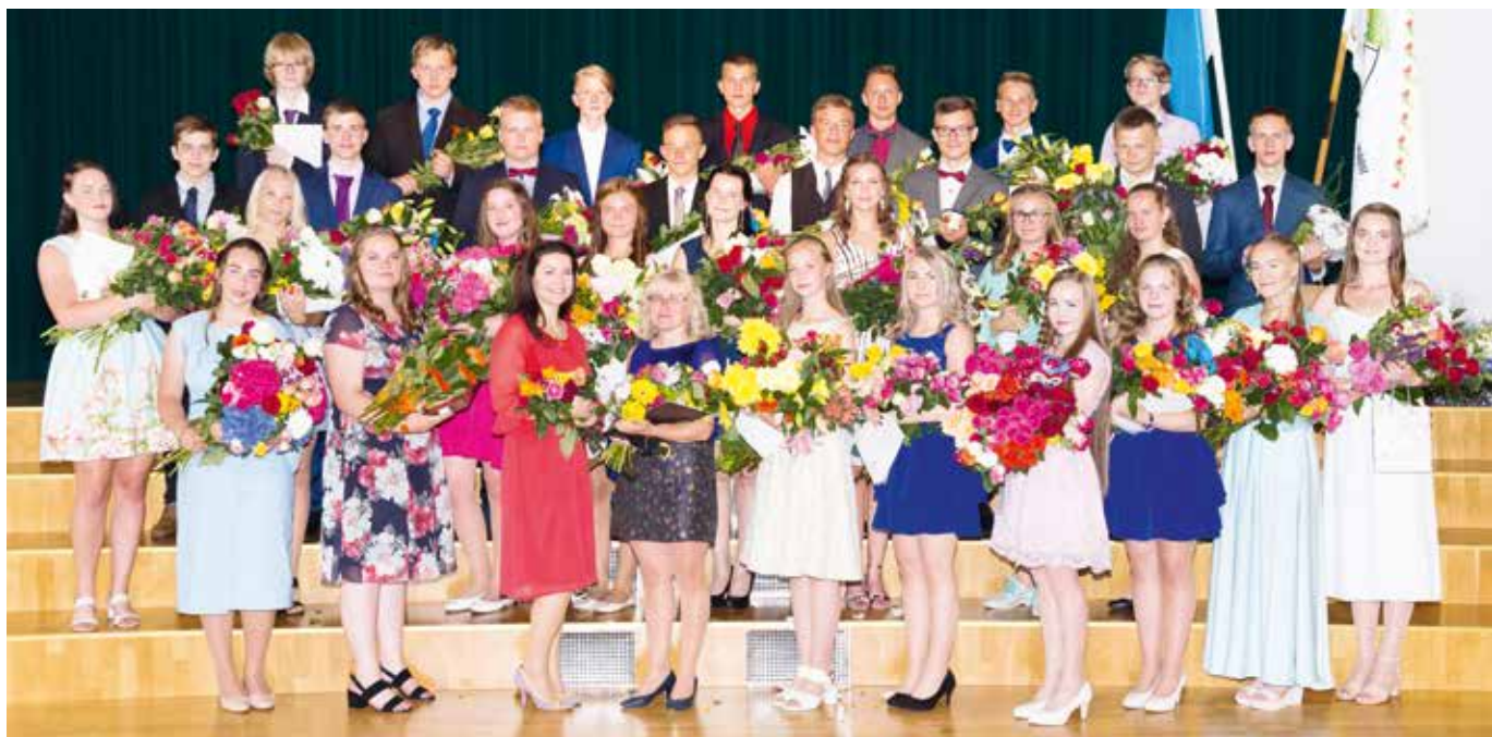
Suure-Jaani kooli lõpetajad.