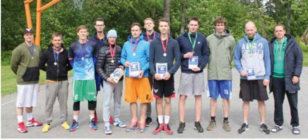
Parimad tänavakorvpallis.

Traditsiooniliselt toimus perega 46. Lehola-Lembitu turniir. Sel aastal osales üritusel Parim pühapäev mängude tänavakorvpalli kokku viis piirkonda, kõik