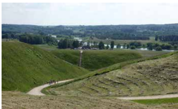
Kernave – ajalooline Leedu pealinna asukoht.

6. ja 7. juuni kujunesid tösisteks tööpäevadeks – kell 8 hommikul ootas meid hotelli ees sõiduvalmis buss, et minna tutvuma eesootavate paikadega. Esmalt Vilniuse ülikooli hooned ja raamatukogu. Sisepääs ülikooli