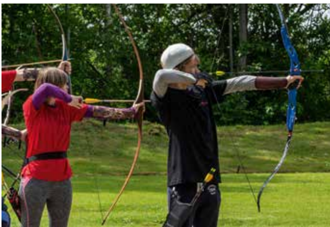
Noorte karikavõistlused Puuiatus.