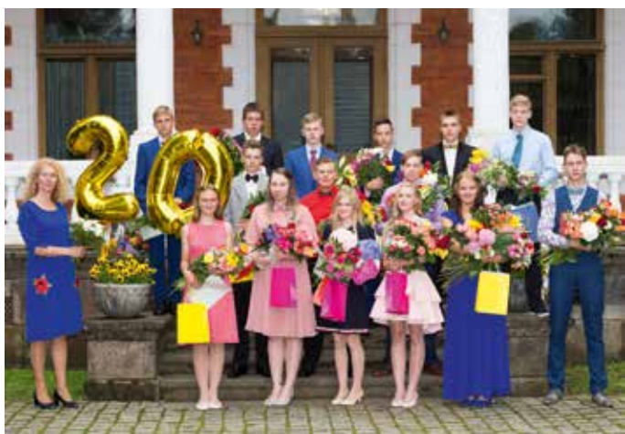
Olustvere põhikooli 20. lend.