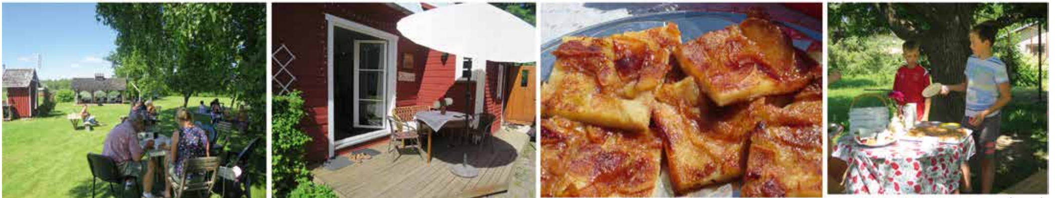
FOTOD: Leili Kuusk