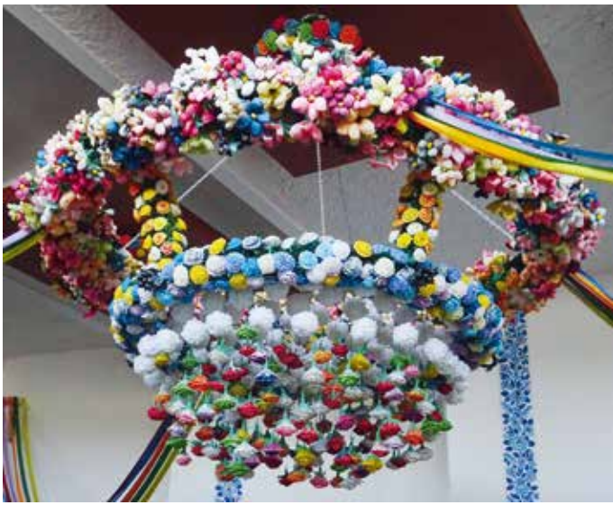
Lillemustreid ja lillelisi kompositsioone jagus kõikjale.