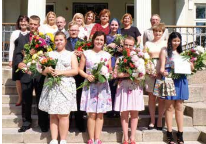
Kõpu põhikooli 97. lend. koos õpetajatega.