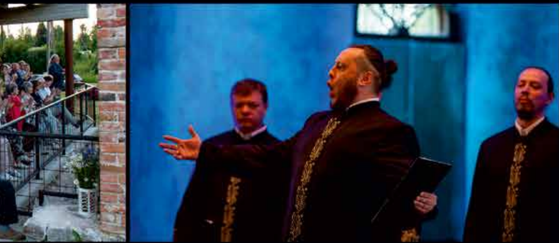
Valaami kloostri meeskoor õigeusu kirikus.