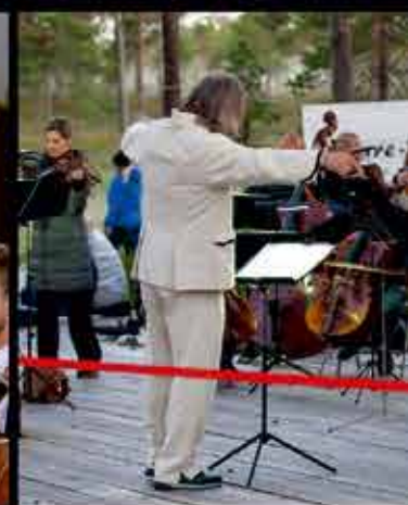
Päikesetõusukontsert ja ETV tütarlastekoor.