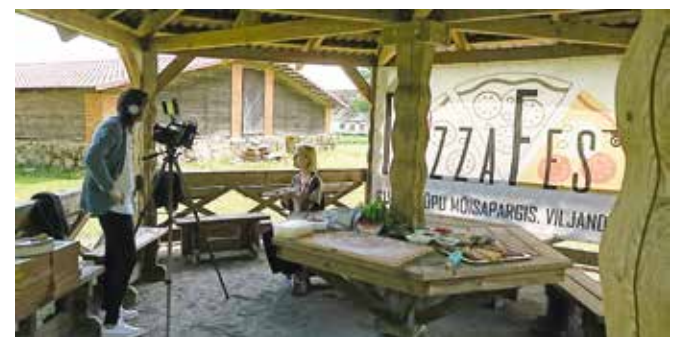
TV3 võttegrupp Suure-Kõpu mõisas klippi filmimas.

23. juulil toimub Suure-Kõpu mõisapargis pitsaahjude meisterdamise töötuba, mille raames saavad kõik huvilised tulla ja meisterdada endale kaubaalusele tehtava pitsaahju. Lisainfo töötoa kohta leiab PizzaFesti Facebooki lehel.