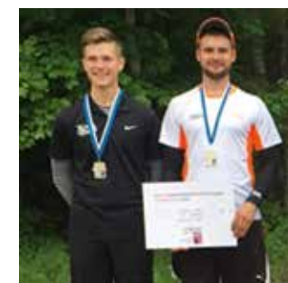
Hõbe Eesti meistrivõistlustel discgolfis.