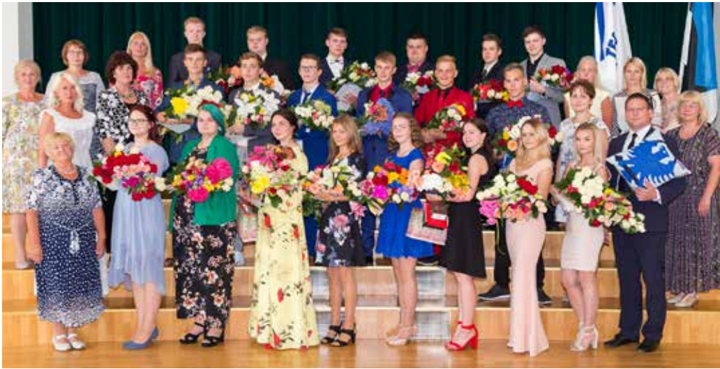
Suure-Jaani gümnaasiumi 71. lend koos õpetajatega.