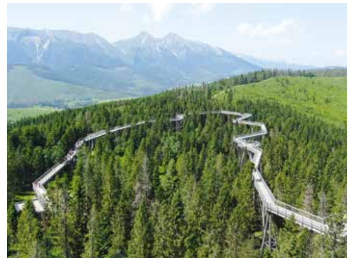
32 meetri kõrguse vaatetorni tippu jõudmiseks tuli läbida 1234 meetri pikkune rada puulatvade kõrgusel.

Laupäeva hommikul pakkisime kohvid ja peale hommikusööki alustasime koduteed. Zakopane väljasõidul tegime peatuse aiakujude müügiplatsil ja igaüks, kes soovis, sai omale aeda või rõdule meeldiva kuhu osta. Bussi pakiruumi sai neid päris