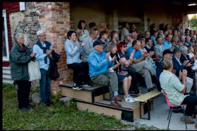
Esimese rüü rahvas Tääksi vesiveskis.