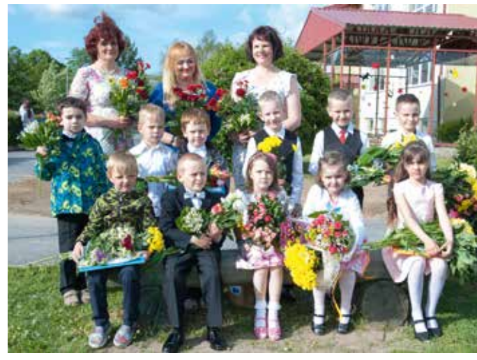
Võhma lasteaia lõpetajad.