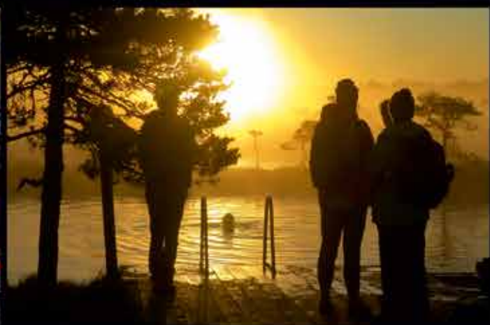
Hüpassaare rabalaugas pärast päikesetõusukontserti.