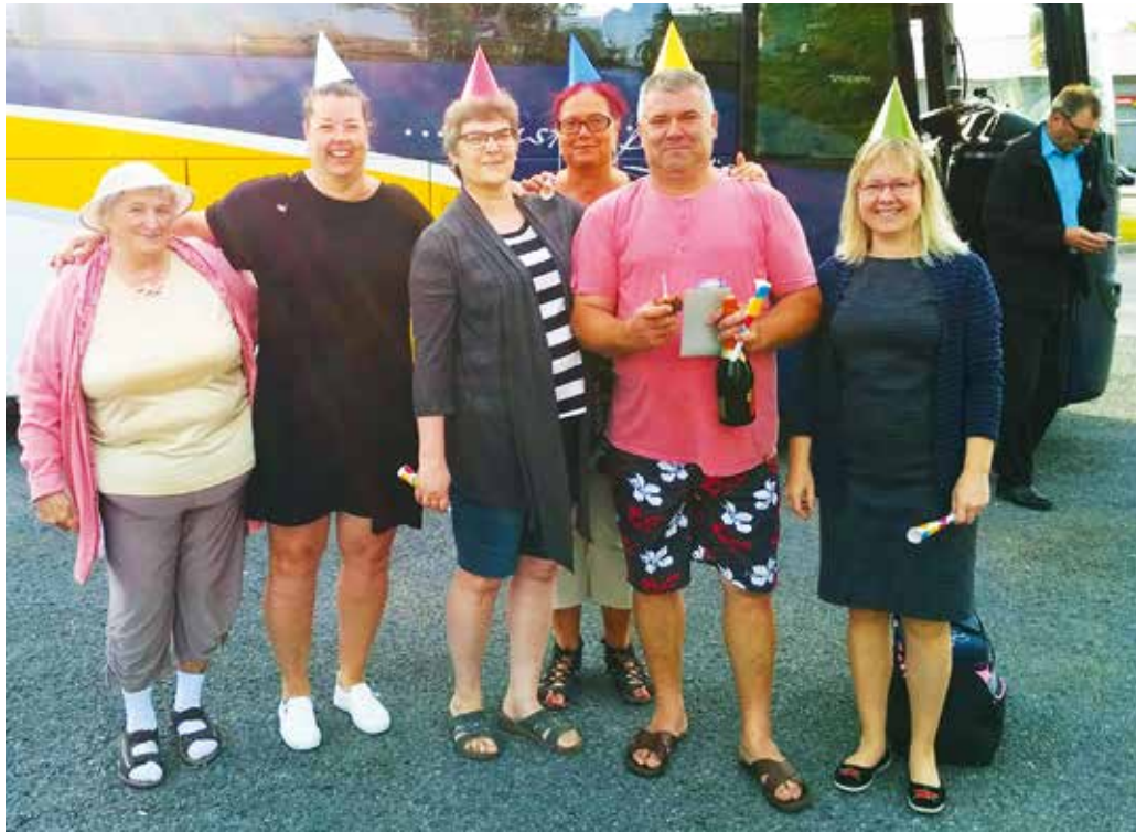
Ühine sünnipäeva laul ning õnnesoovid – nii algas see reis.

Kolmanda päeva hommikul kohe peale hommikusööki tutvusime Zakopane-ga. Sõitsime funikulööriga Poola kõrgeima mäe Kasprowy Wierch tippu. Jalutasime mäeharjal, nautisime kauneid mägisid vaateid ja katsusime jala-käega lumelake. Peale kõrgeima mäetipu „vallutamist“ said soovijad sõita veidi väiksema mäe Gubalowka tippu. Sealsed vaated ja elav turismitänav olid samuti võrratud. Käisime ka Zakopane turul, kus soovijad said kaasa