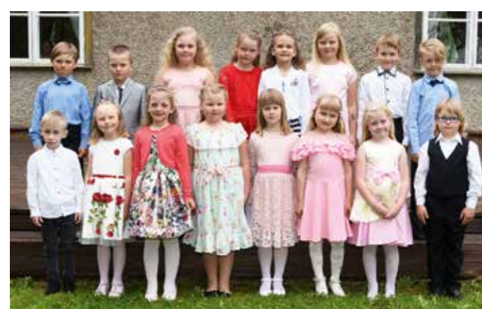
Kirivere lasteaia lõpetajad.