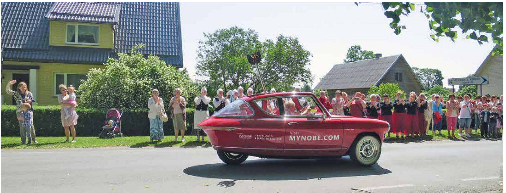
Laulu- ja tantsupeo tuli jõudis Suure-Jaani Heliloojate Kappide majamuuseumi juurde.