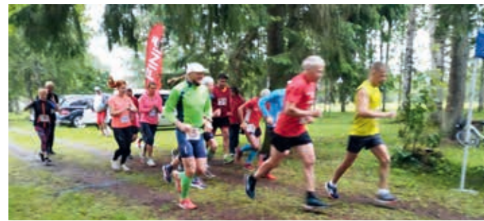
Võhma terviseraja maratoni start.