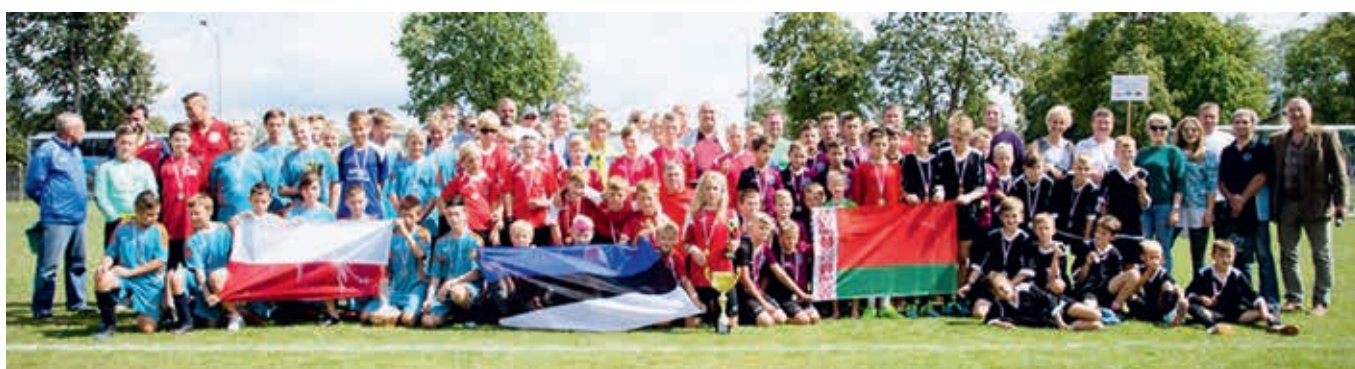
Võidukas Põhja-Sakala võistkond koos konkurentidega.