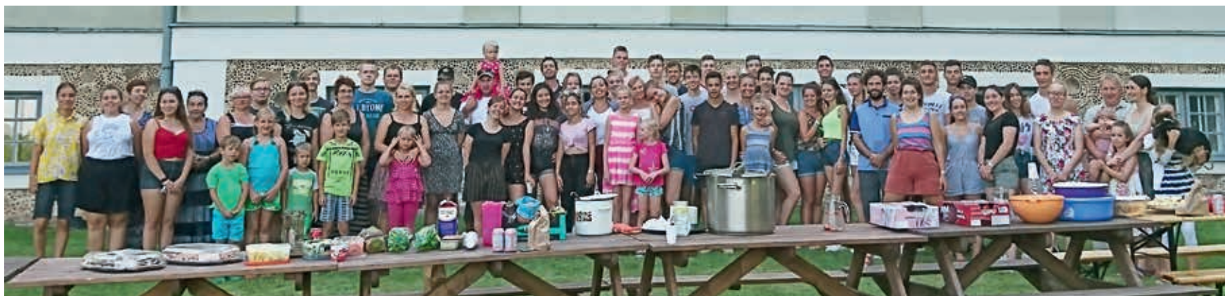
Pereõhtu Kõpu kooli juures.