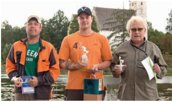
Parimad mehed ...

Vahva kalapüügivõistluse käigus püüti 3. augusti hommikul Suure-Jaani järvest välja 16 kg kala. 20 meest ja 7 naist õngitsesid kolm tundi. Naiste arvestuses olid parimad kalapüüdjad Säge