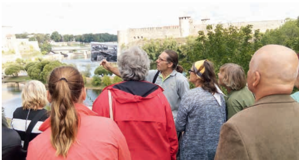
Tänane Narva ajaloolise foto taustal.

Kui õhtul Laagna hotelli juurest etendusele minekuks sõitu alustasime, tulid pilvedest esimesed piisad ja uuesti Kreenholmi jõudes sadas juba tihedat vihma. Tihe sadu kestis terve etenduse aja, 3,5 tundi. Näitlejad ei lasknud end vihmast häirida, vaid tantsunumbrid veekorruga kaetud laval jäid vast veidi vaoshoitumaks ja oli õnn, et keegi seal libedas viga ei saanud. Minu jaoks oli vihma kõige suurem ebamugavus selles, et keegi ei saanud näitlejatele tunnustuseks igal sobival hetkel piisavalt plaksutada, aga selle kompenseerisime huilgamisega. Etendus oli tõesti