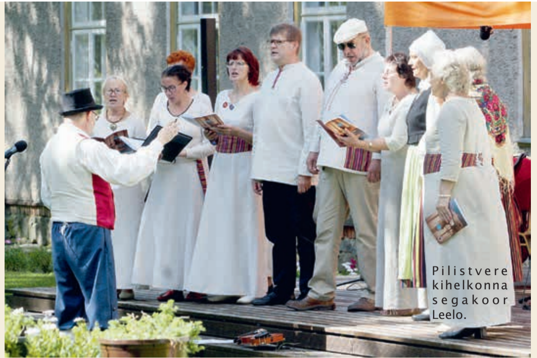
Pilistvere kihelkonna segakoor Leelo.