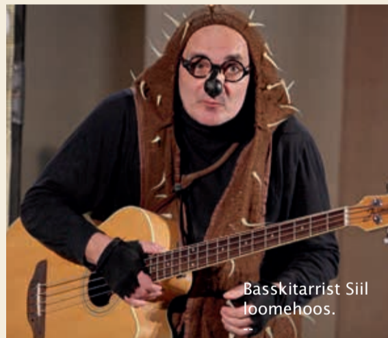
Basskitarrist Siil loomehoos.