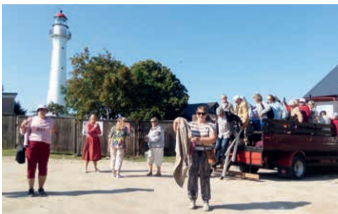
Algab Kihnu tuletorni vallutamine.