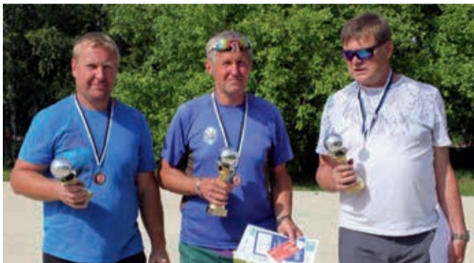
Parimad mehed ja naised petangis 2019.

Lehola-Lembitu mängude petangivõistlus toimus 4. augustil, ühtlasi oli tegu ka valla meistrivõistlustega. 8 naist ja 14 meest panid oma parima mängu. Naiste arvestuses võitis