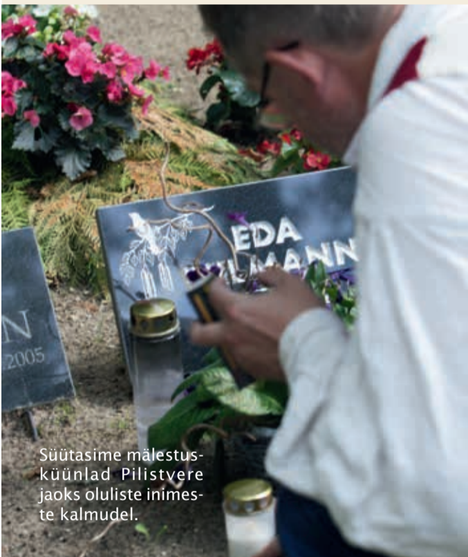
Süütasime mälestusküünlad Pilistvere jaoks oluliste inimeste kalmudel.