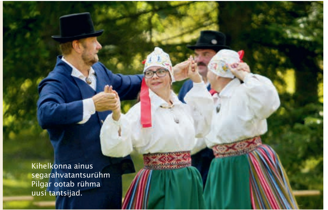
Kihelkonna ainus segarahvatantsurühm Pilgar ootab rühma uusi tantsijad.