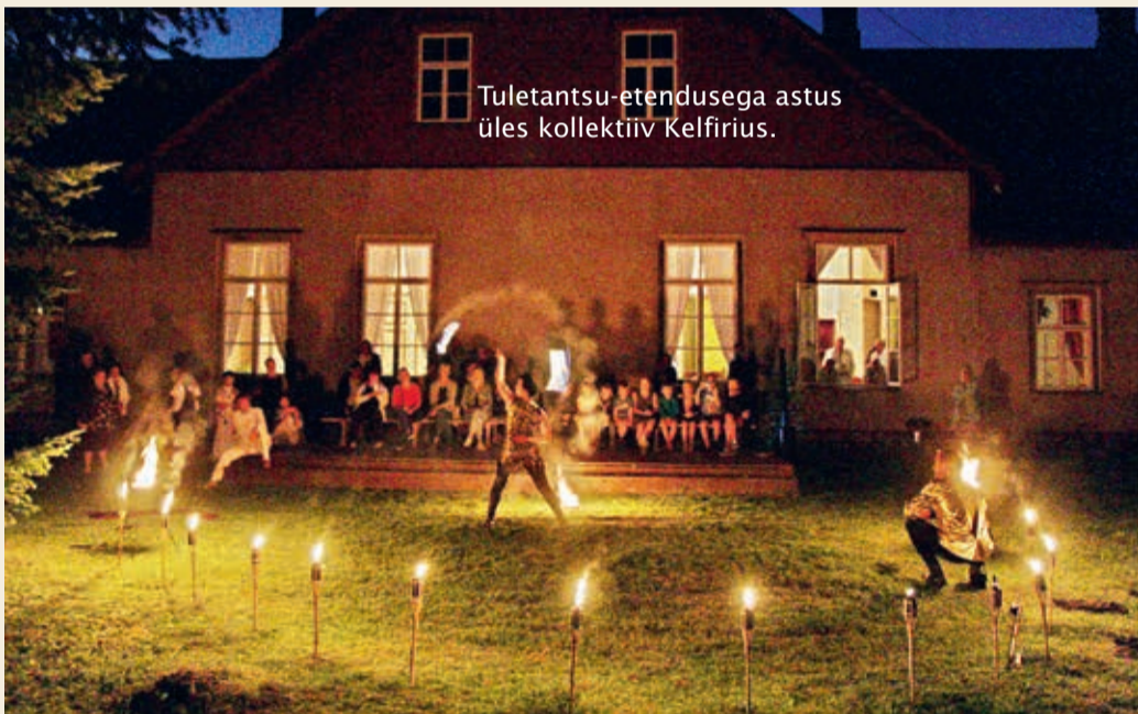
Tuletantsu-etendusega astus üles kollektiiv Kelfiriis.