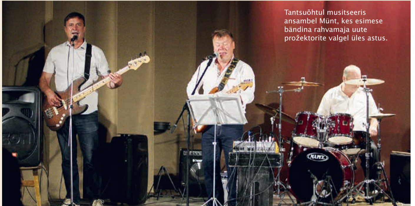
Tantsuõhtul musitseeris ansambel Münt, kes esimese bändina rahvamaja uute prožektorite valgel üles astus.