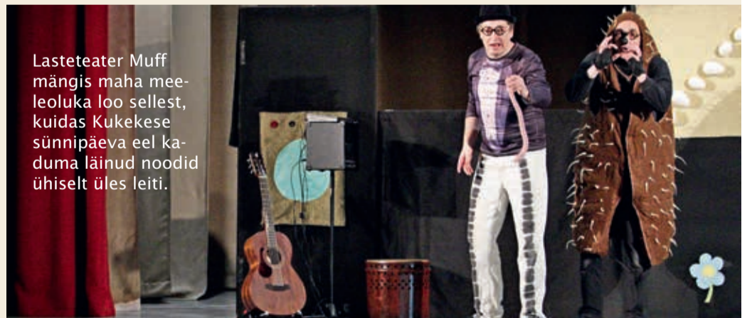
Lasteteater Muff mängis maha meeleoluka loo sellest, kuidas Kukekese sünnipäeva eel kaduma läinud noodid ühiselt üles leiti.