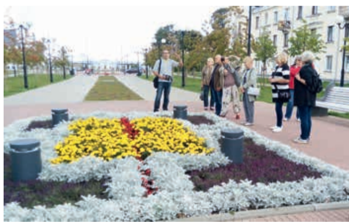
Sillamäe keskvaljakult suundub treppidega puiestee merele.