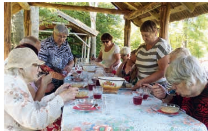
Lõunasöök Kihnu moodi.