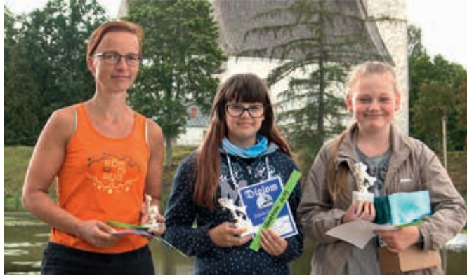
ja naised kalapüügis.