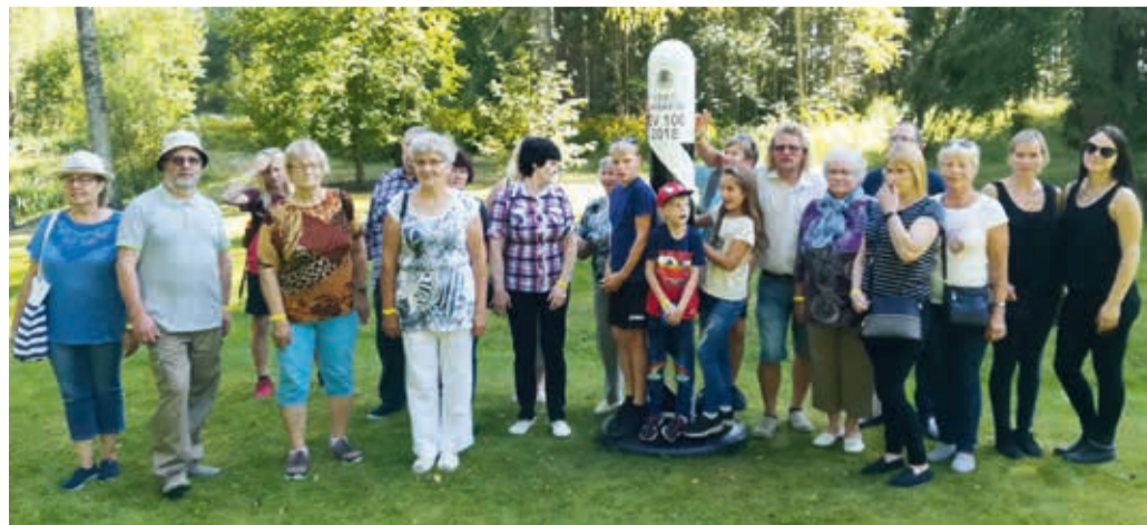
Lahmuse, Päraküla ja Põhjaka külaselts Saatse muuseumis.

5. septembril 2009 kogunesid aktiivsed külaelanikud Lahmuse kooli, et algatada külaselts. Nüüd on sellest juba kümme aastat mööda läinud. Selle aja jooksul oleme koos käinud pea sajalt korral, nautides üksteise külalislahkust, pidanud sünnipäevi ja jõulupidusid, meisterdanud vahtralehtedest roose, käbidest pärgi, vanadest vinüülplaatidest kausse, meisterdanud helkureid ja nõelapatju, teinud lindudele pesakaste ja ühiselt valmistanud talusilte, kuulunud loenguid nii maanteeametilt ohutust liiklemisest, tuleohutusest Suure-Jaani päästekomandolt, läbinud Eesti Punase Risti päästeameti koolitu-