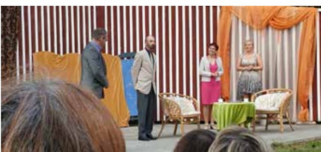
Seasaare teatri etendus „Tiivarips“ Võivaku amfiteatris.