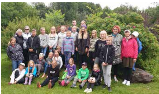
IX Kunstilaager Tamme talus.

Tekst ja foto AIRE LEVAND Suure-Jaani kultuurimaja direktor