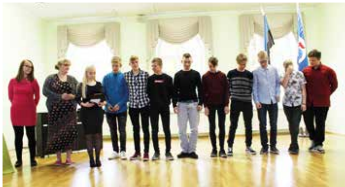
Õpetajate päeva noored õpetajad.

Oktoobrikuu algas koolis traditsiooniliselt õpetajate päeva tähistamisega. Õpetaja ametit proovisid meie kooli 9. klassi õpilased ning kaheksandikud praktiseerisid ametit lasteaias. Noored õpetajad olid innukust täis. Põnevaid tegevusi jätkus terveks päevaks. Õpetajatele lõppes päev toredate väljasõiduga pealinna.