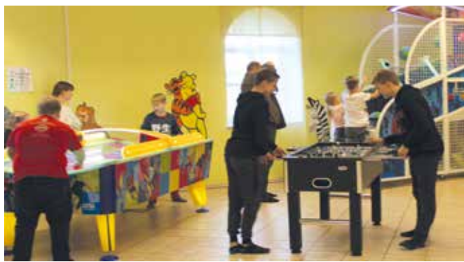
Kõo noortetuba uues kuues.

14. oktoobril avasime uuenduskuuri läbi teinud Kõo noortetuba. Kõo noorte kohtumispaik sai värske kuue tänu projektile „Uued võimalused maa-noortele Kõos“, rahastajaks PRIA Leaderi programm MTÜ Võrtsjärve Ühenduse kaudu. Nüüdseks on noorte käsutuses uus mööbel ja kööginurk koos vajaliku tehnikaga, kvaliteetsed ja atraktiivsed mängud (õhuhoki, korvpallimäng), helitehnika, videoprojektor ek-