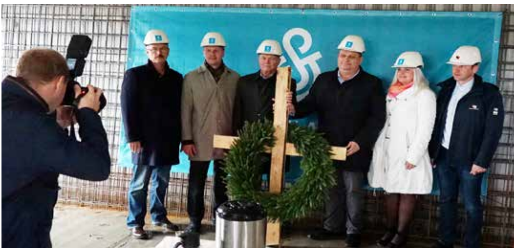
Koksvere elamu ehitusel peeti sarikapidu ja pandi nurgakivi.