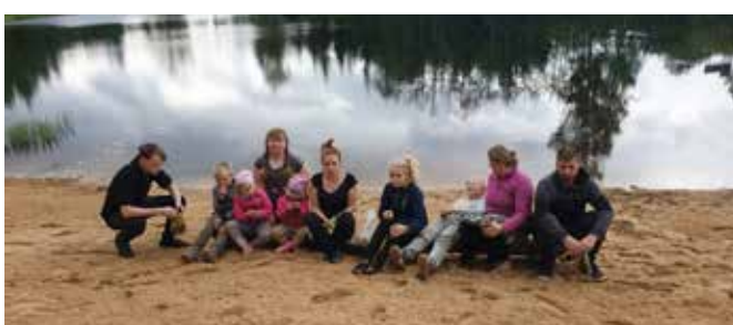
Rannaliiva laiali ajajad.