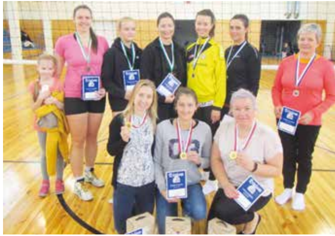
46. Lehola-Lembitu mängude parimad naiste võrkpallis.