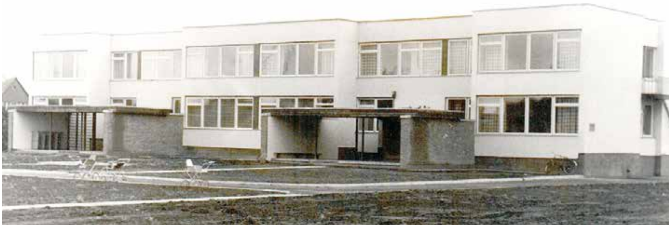
40 aastat tagasi avati Võhma Lihakombinaadi lastepäevakodu.