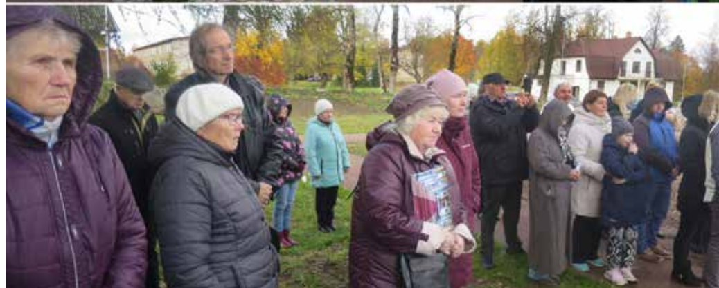
Lõikustänapühäl avati Kõpus Kirikupark ja tähistati Vabadussõja ausamba 30. aastapäeva.