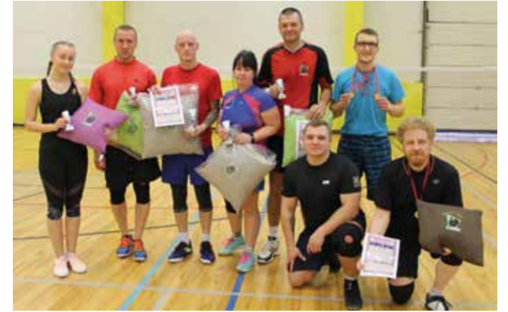
Valla parimad sulgpallid.