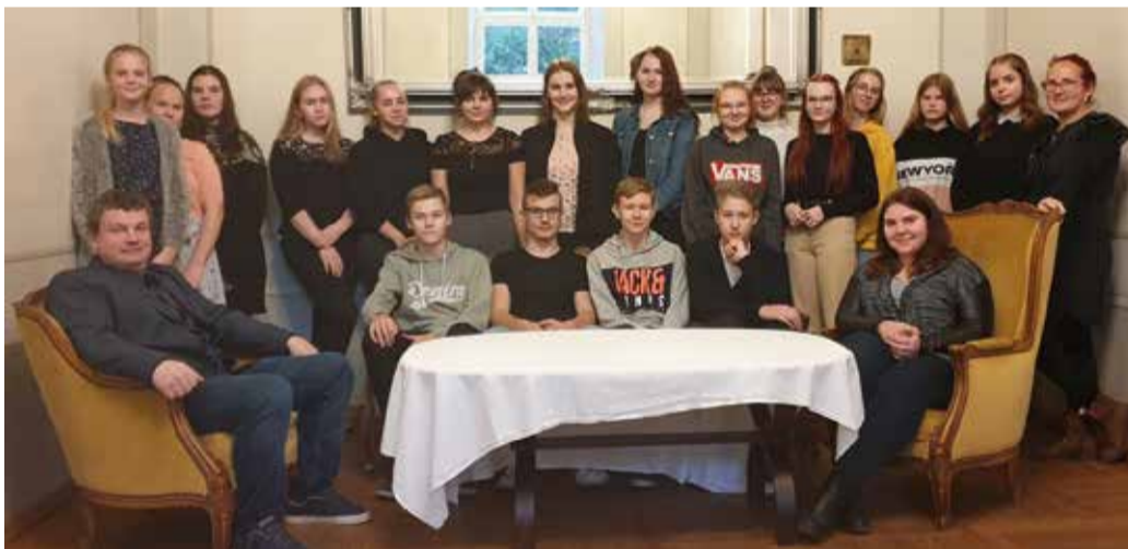
Noortevolikogu koolituspäeval Suure-Kõpu mõisas.

Suure-Jaani Tervisekoja juhataja tutvustas põhjalikult uue hoone olemasolevaid võimalusi, mille baasilt noored pakusid välja uusi lahendusi, sündmusi ja arenduseid, mis tooks külastajaid piirkonda. Noorte ideed olid igati julged ning tahaks väga loota, et nii mõnigi neist viiakse ka ellu. Meeskonnatööd harjutati õistel tundidel Viljandis põgenemistoas ning hiljem ka Suure-Jaani noortekeskus-