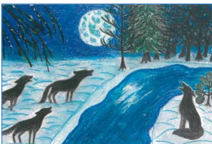
Autor: Magdaleena Orr (Kirivere kooli 8. klass)

On üks imeline kuu, saab küünlad külge kuusepui. Ja tippu hõbedase tähe, taevas neid ei ole vähe. Sest iga imeline tegu - headuse ja õilsusegu süütab uue heleda taevavõtri laterna.