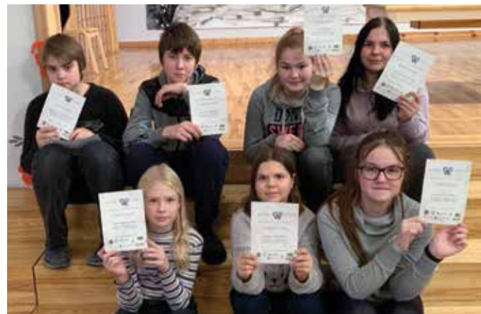
JÄVI parimad Olustvere põhikoolist.