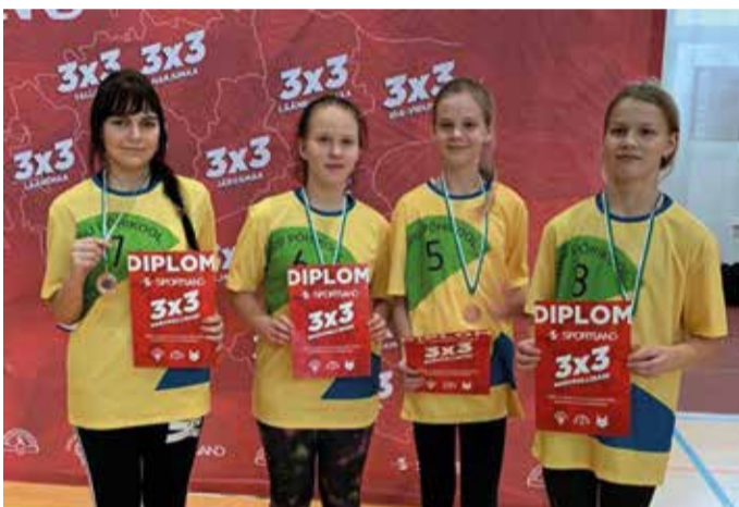
Tublid Kõpu põhikooli tüdrukud.