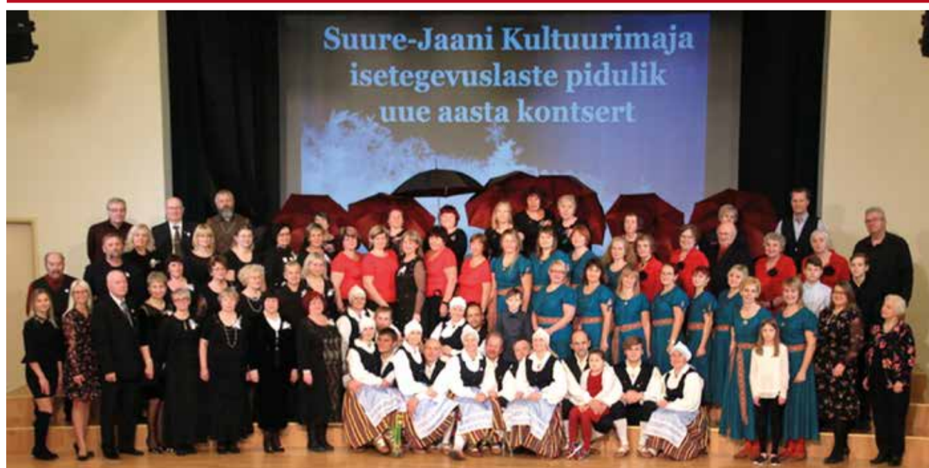
Ja nüüd kõik fotole – pärast Suure-Jaani kulturimaja isetegevuslaste kontserti.