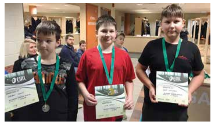
Suure-Jaani vibuklubi esindus.