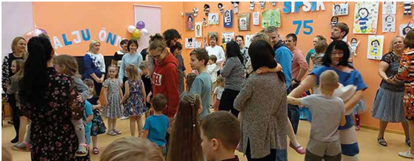
Mis sünnipäevapidu see ikka ilma tantsuta on. Sipsik koos lasteaiapere, lapsevanemate ja külalistega tantsuhoos.