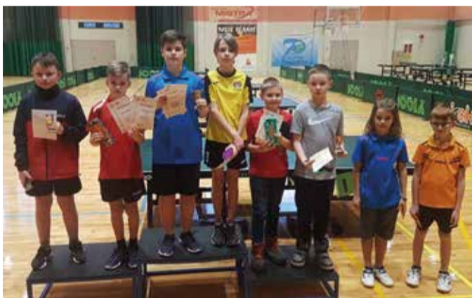
Suure-Jaani nooremad lauatennisistid.

10. jaanuaril toimus Viljandi spordihoones võistlus Koolipinks kõigile. Meie vallast osales võistlustel 20 tublit noort Võhma, Kirivere ja Suure-Jaani koolist. Lisaks võistles võidukalt Olustvere teenidus- ja maamajanduskool. Suure-Jaani tüdrukud saavutasid tubli II koha ja samas vanusegrupis olid Võhma neiud kolmandad. Suure-Jaani koolist said vanemad poisid III koha ja