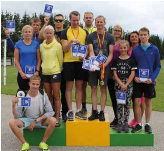
Kildu pendeltee võidukas võistkond külade suvepäevadel Võhmas.

Ees ootavad juba 47. Lehola-Lembitu mängud. Kohtunikekogu koguneb veebruarikuus, et üle vaadata spordialad ja mängude juhend. Ootame kõiki osalema, sest alad on jõukohased ja ühine pingutus ning rõõm spordist liidab meie vallaharvast.