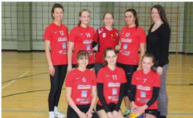
Meie särav naiskond sariturniiril.

Sürgaveres lõppes 22. meeste ja 11. naiste võrk-