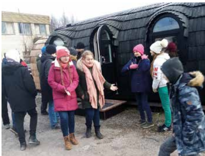
Õpilased iglusaunade vahel uudistamas.