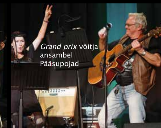
Grand prix võitja ansambel Pääsupojad