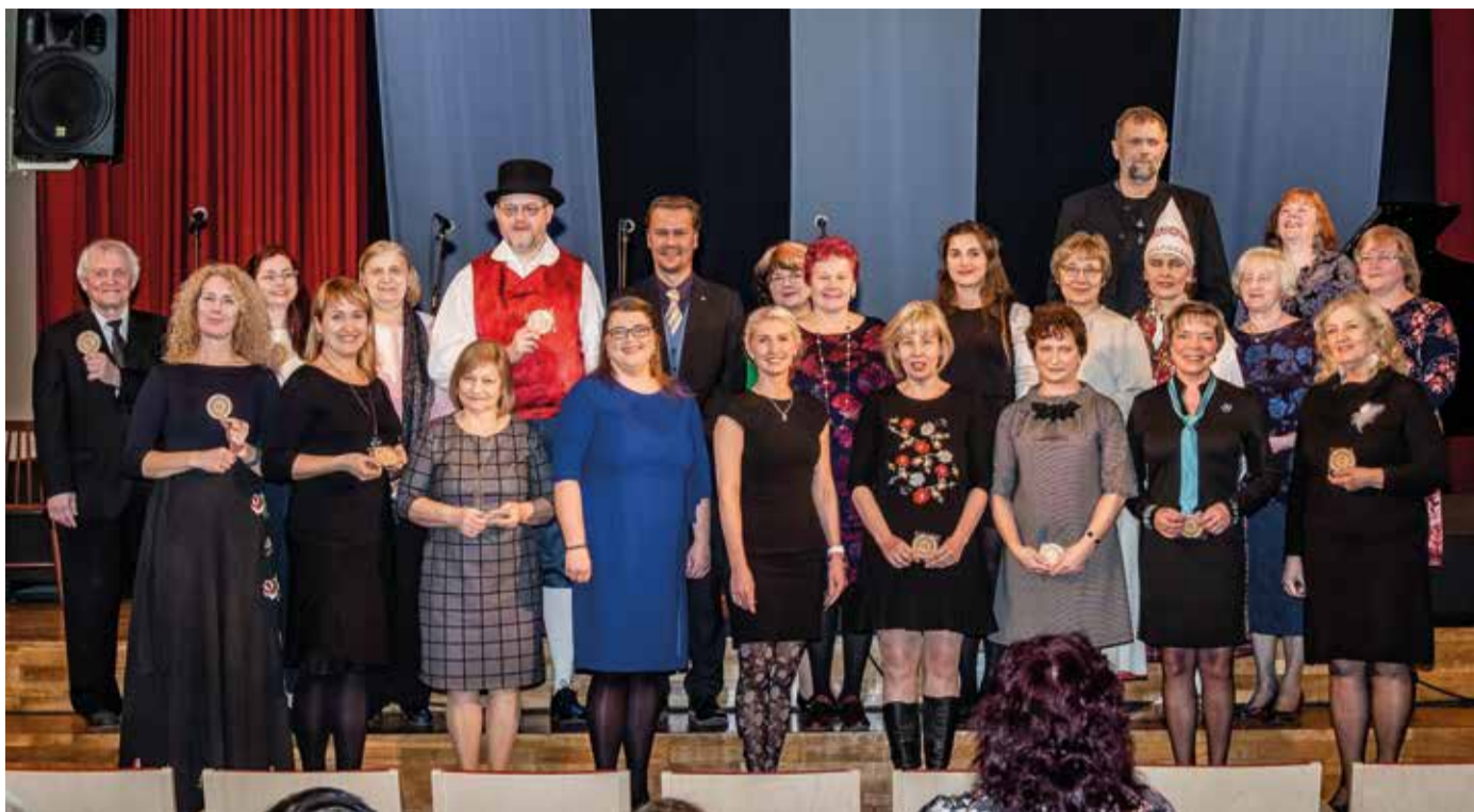
Põhja-Sakala valla kultuurihaldjad ehk ringide juhendajad isetegevuslaste peol.

Presidendil on kombeks iseseisvumispäeva eel jagada aumärke ja ega meiegi saa kehvevad olla. Põhja-Sakala vallas toimetas 7 majas