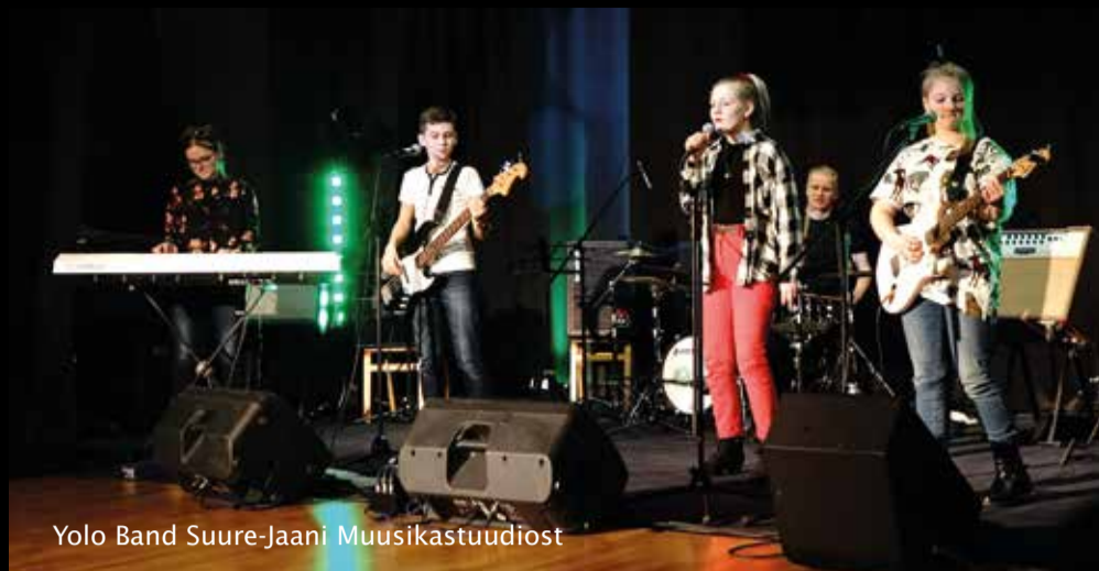
Yolo Band Suure-Jaani Muusikastuudiost