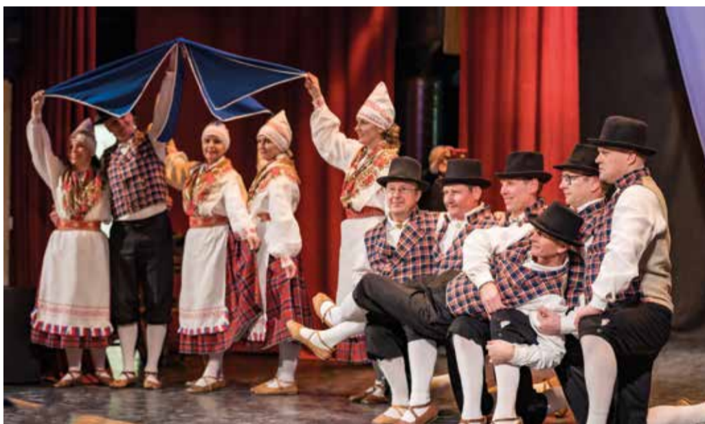
Tääksi segarühm Öerutajad kontserdil.