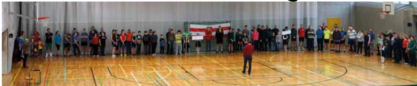
Põltsamaa Jõe 38. talimängude avamine.