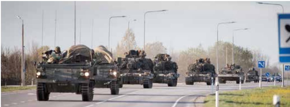
Liitlaste konvold eelmise aasta Kevadtormi õppusel.

Õppusel osalevad kaitsevälased võivad kasutada erinevaid imitatsioonivahendeid, sealhulgas paukpadruneid ja õppegranaate. Olgugi et ei kasutata lahingmoona, võivad ka imitatsioonivahendid teha valedes kätes palju kahju. Leides õppuse alalt eseme, mille puhul tekib kahtlus, et see võib kujutada kellelegi ohtu, ei tohiks seda mitte mingil juhul ise puutuda! Sellises olukorras jätke meelde