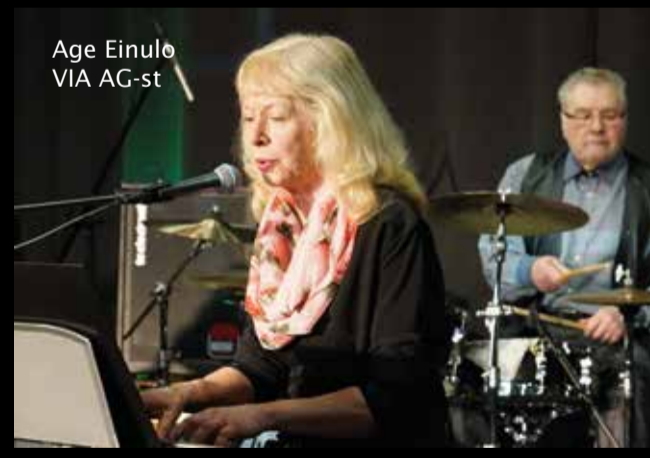
Age Einulo VIA AG-st