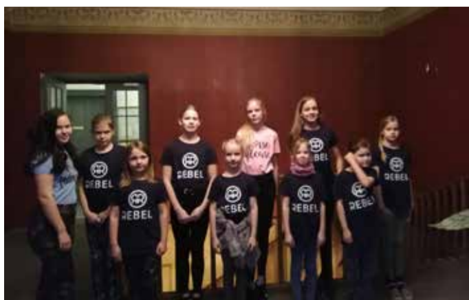
Kildu ratsakeskuses käib Kõpu põhikoolist ratsutamas kümme 2.-7. klassi tüdrukut.