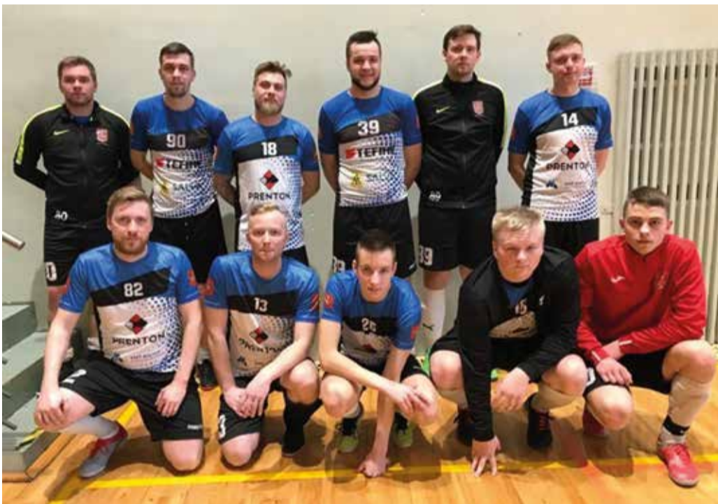
Põhja-Sakala 4. koha meeskond maakonna meistrivõistlustel.

Maakonna meistrivõistlustel korvpallis jäi samuti põhiturniiri viimane mäng pidamata. Valla meeskond püüab pääsu 8 parema sekka. Põhimeeste puudumisel on keeruline kõrgematele kohtadele mängida ning