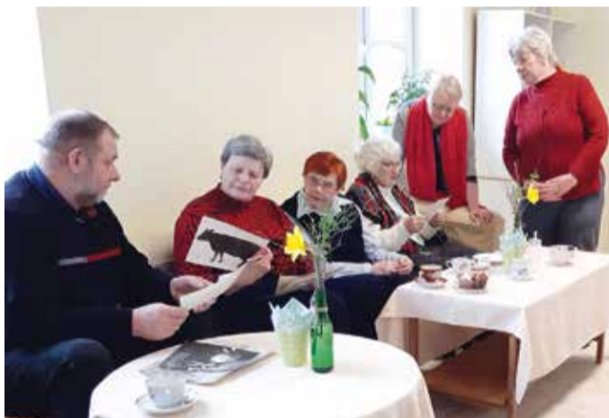
Üheskoos vaadati fotosid.