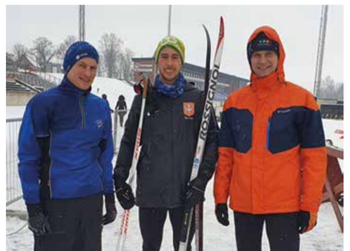
Meeste teatesuusatamise võistkond talimängudel.

Spordiuudiste tekstid MATI ADAMSON spordi- ja noorsootööspsialist