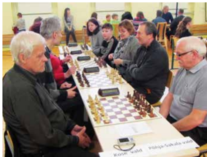
Põhja-Sakala malevõistkond talimängudel.