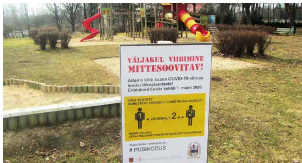
Valla mänguväljakud said hoiatavad sildid: mänguväljakutel viibimine mittesoovitav, hoiad distantssi minimaalselt 2 meetrit, atraktsioonide pinnad on nakkuse edasiandjad.