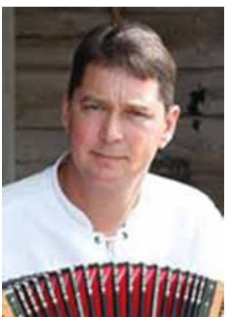
AIN ARULA Arula Aidad OÜ muusik

Olukord on tuletanud meelde vana tõde – müügiriske tuleb hajutada nii palju kui võimalik. Samuti kinnitas olukord vanasõna: kuidas küla koerale, nii koer külale. Õnneks meie puhul positiivses võtmes. Hoiaime silmad-kõrvad lahti ja läheme edasi.