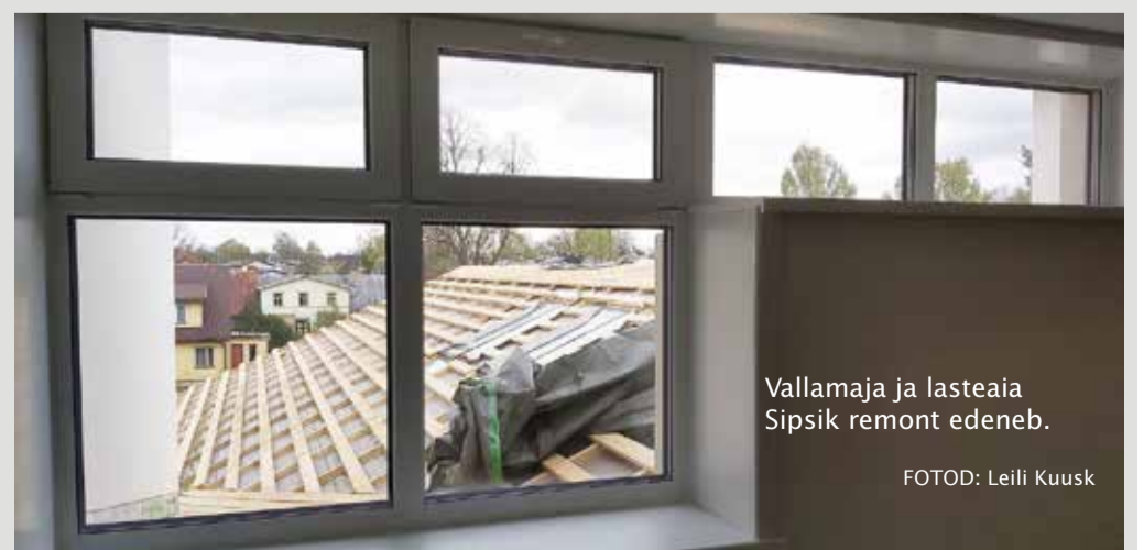
Vallamaja ja lasteaia Sipsik remont edeneb.