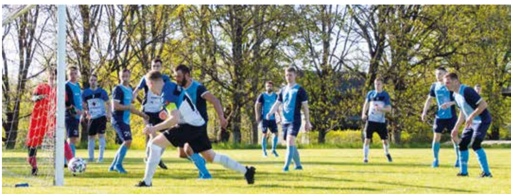
Võidukas hooaja avamäng jalgpallis.