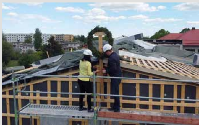
Võhma koolis peeti juba sarikapidu.