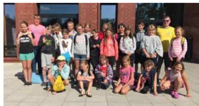
Kõpu Krapsakad suvelaagris 2019.

tes laagrites, kultuuri-, spordi- ja noorsooüritustel. Ärevatest aegadest hoolimata tahame pakkuda nii lastele kui lastevanematele sisukaid vaba aja veetmise võimalusi, sest pikk distantsõppe periood koolides on kõik ära kurnanud. Täname juba ette kõiki häid partnereid, kes lisaks vallale lastele tegevust pakuvad! Siiras tänu kõigile korraldajatele, abilistele ja neile, kes alati toeks on! Erinevaid sündmusi on rohkelt ja valik on teie – loodetavasti leiab igaüks enda jaoks meelepärase suveürituse või -laagri,