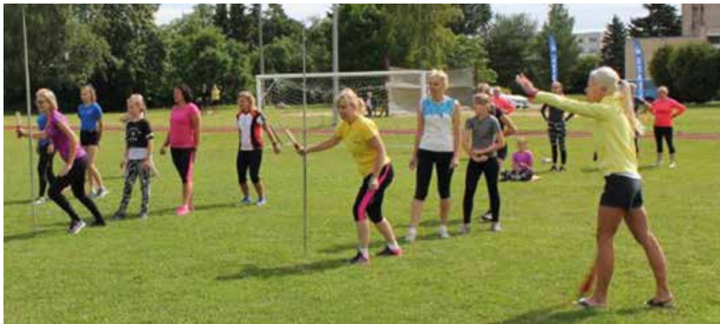
2019. a Lehola-Lembitu mängude suvepäeva pendelteeajooks Võhma staadionil.

Lehola-Lembitu mängude tänavune hooaeg algab tavatult hilja, kuna eriolukord seadis omad piirangud. Hetkel on Eestis lubatud korraldada spordivõistlusi, kui jälgitakse reegleid. Meie pikima ajaloooga spordivõistluste ajakava on koos ja saame jätkata mängudega, millest võtab osa 9 piirkonda. Mängude mõte on, et meie valla inimesed saaksid ennast proovile panna 21 spordialal. Olge kõik agarad ja julged kaasa