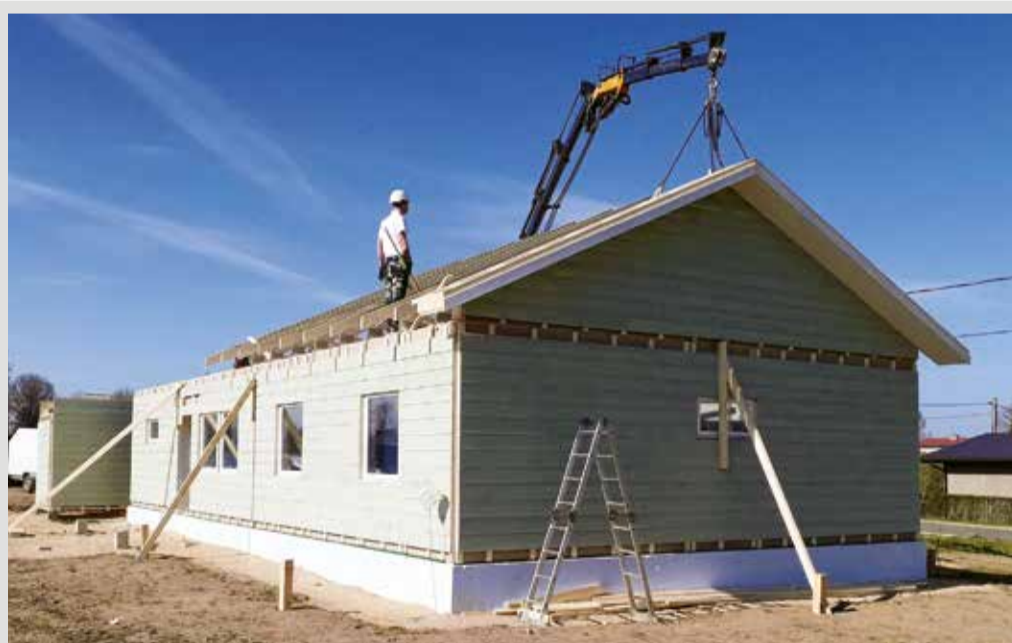
Tööstuspargis kerkib esimene maja.