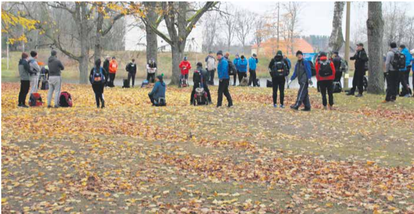
Esimene nädalamäng discgolfis.

Discgolf on spordiala, mis on viimastel aastatel teinud suure arenguhüppe ning võitnud tohutu populaarsuse. Eesti alaliidu liikmeks on juba 34 discgolfiklubi ja Metrixis on eestlastest unikaalseid kasutajaid pea 20 000. Siiat lisandub veel väga palju harrastajaid. Ka Suure-Jaani discgolfirajal käib vilgas tegevus, sest kohalikud eestvedajad