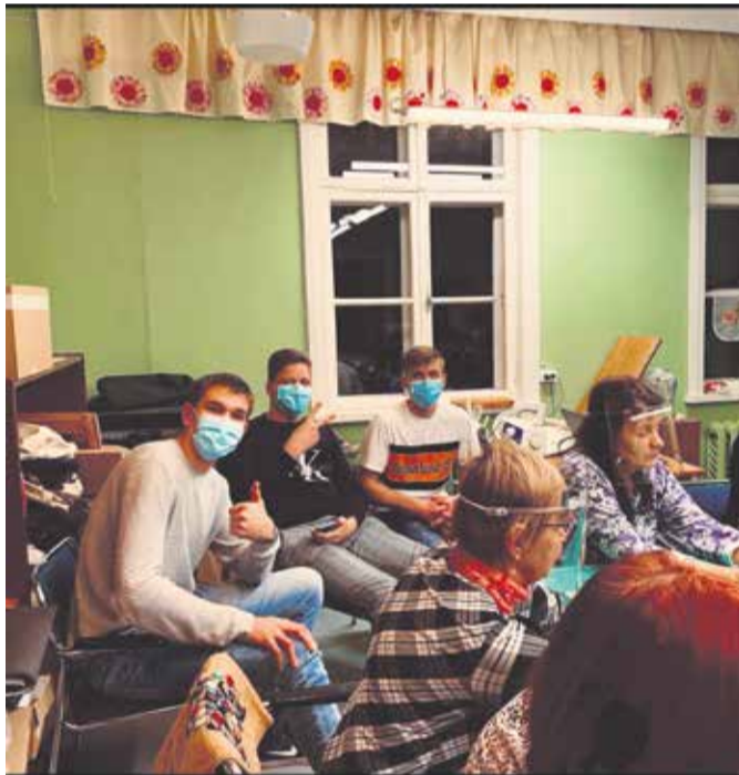
Õpilasfirma MARU liikmed Pärsti õmblusringis.