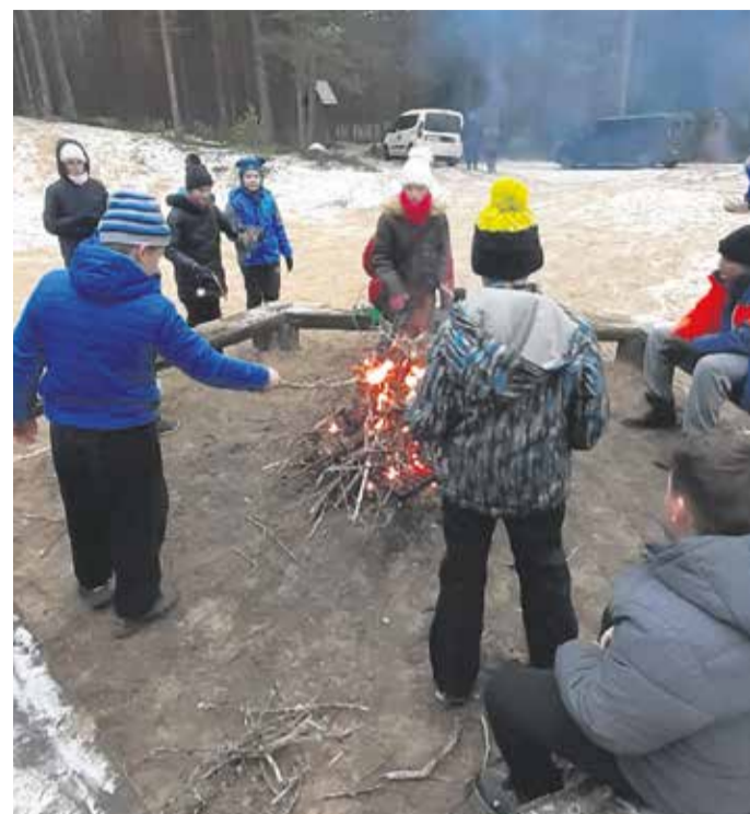
Luidete lõkkekohas piknikul.