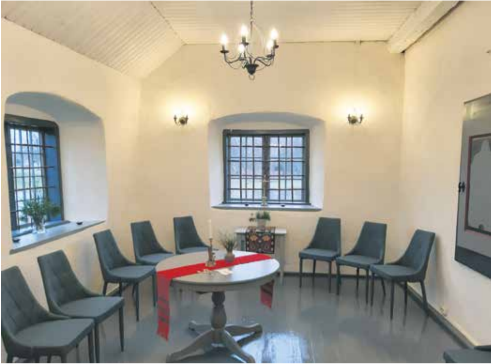
Suure-Jaani Johannese kiriku 06.12.20 sisse pühitsetud käärkamber on heaks kokkutulemise kohaks kõikide jaoks.

Palun siis meie koguduste kõikidel täiskogu liikmetel aktiivselt valimistel osaleda ja ka vajalikud toimetused teha. 2020. aasta liikmeannetuse saab veel teha kuni 17. jaanuarini 2021. Annetuse soovituslik suurus on 1% aasta sissetulekust ja