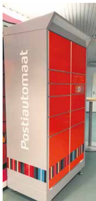
Näidisautomaat Pallastis.

le Põhja-Sakala vallas. Paigaldamise järel testitakse seda päev-paar, et veenduda kõigi korralikus toimimises, ja avatakse siis kohe ka piirkonna elanikele ja ettevõtjatele kasutamiseks.