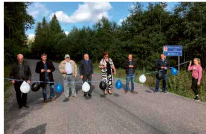
Metsküla-Viljandi tee avamine.

Meie küla on suur, kuid Metsküla küla elanikud on kokkuhoidvad ja näevad koostööd tehes vaeva ühiste eesmärkide saavutamise