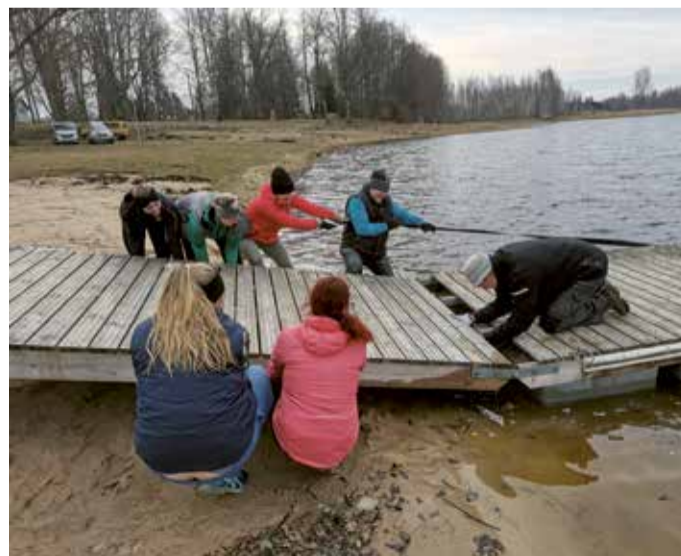
Kollektiivis peitub jõud.

poisid peavad veel kõvasti käsitsi tööd tegema, et uus atraktsioon saaks lõpliku viimistluse. Suurim tänu