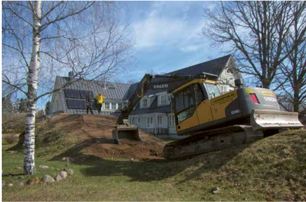
Noorte ideed aitab ellu viia ekskavaator.

Kuna kõik objektid vajavad järjepidevaid parendusi ja pidevat hoolt, siis vaatame iga-aastaselt nende seisukorra üle ning saame vastavalt võimalustele korrastustööd ette võtta. Mitmed tegevused jätame teadlikult ka töömaleva noortele teha, sest oleme korduvalt kogunud, et kui noored ise saavad käed külge lüüa, hoolivad nad edaspidi ka heaperemehelikust kasutamisest. Nii jäi malevanoorte töökätega lõppviimistlust ootama ka Suure-Jaani noortekeskuse juurde värskelt rajatud kelgumägi. Kogu täitematerjali saime staadioniehituselt ja nii on järgmistel talvedel noorteka juures võimalik valgustatud kelgumäel liugu lasta.