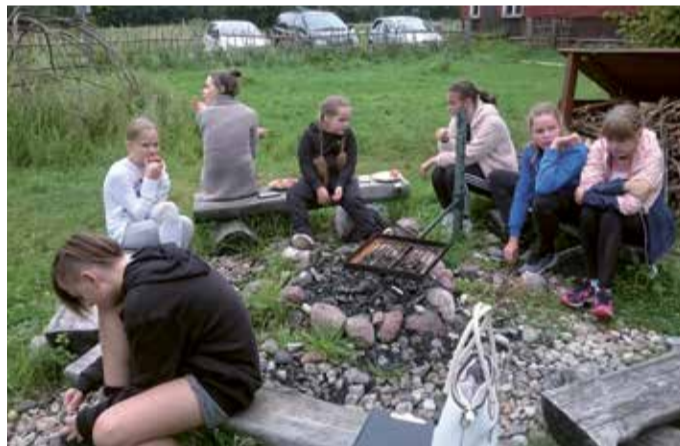
Nutivaba koostööpäev Tipu Looduskoolis.

väga toetavad ja abivalmid, sest alati kui kellelgi on abi vaja, siis kätest puudust siin juba ei tule. Samal ajal on siin rahulik ja turvaline elada ning ümbritsev loodus on kaunis, mõnus on teha jalutuskäike, käia rattaga sõitmas ning jooksmas. Umbes 1/3 Metskülast hõlmab Soomaa ja Ruunaraipe luited on suurepärane koht matkamiseks, vaba aja veetmiseks ja puhkamiseks, samuti on siin head seene- ja marjametsad. Meil on oma maasika- ja mustsõstrakasvatavad ning paljud aiasõbrad kindlasti teavad Nõrga talulillepäevi ja kuulsat floksikollektsiooni.