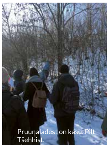
Pruunaladest on kasu. Pilt Tšehhist.