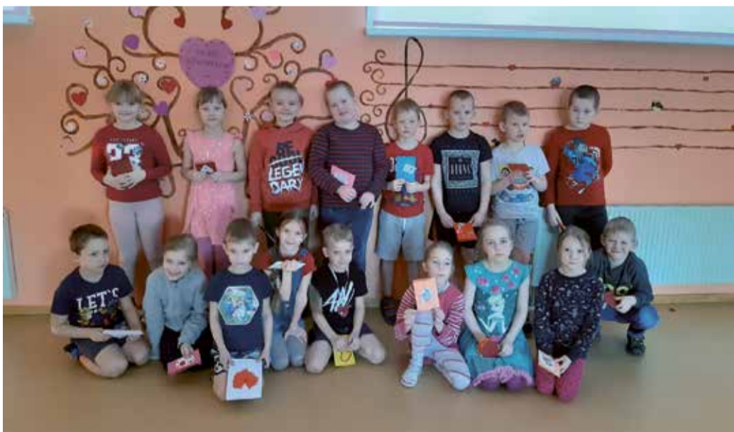
Lepatriinu rühm sõbrapäeval.