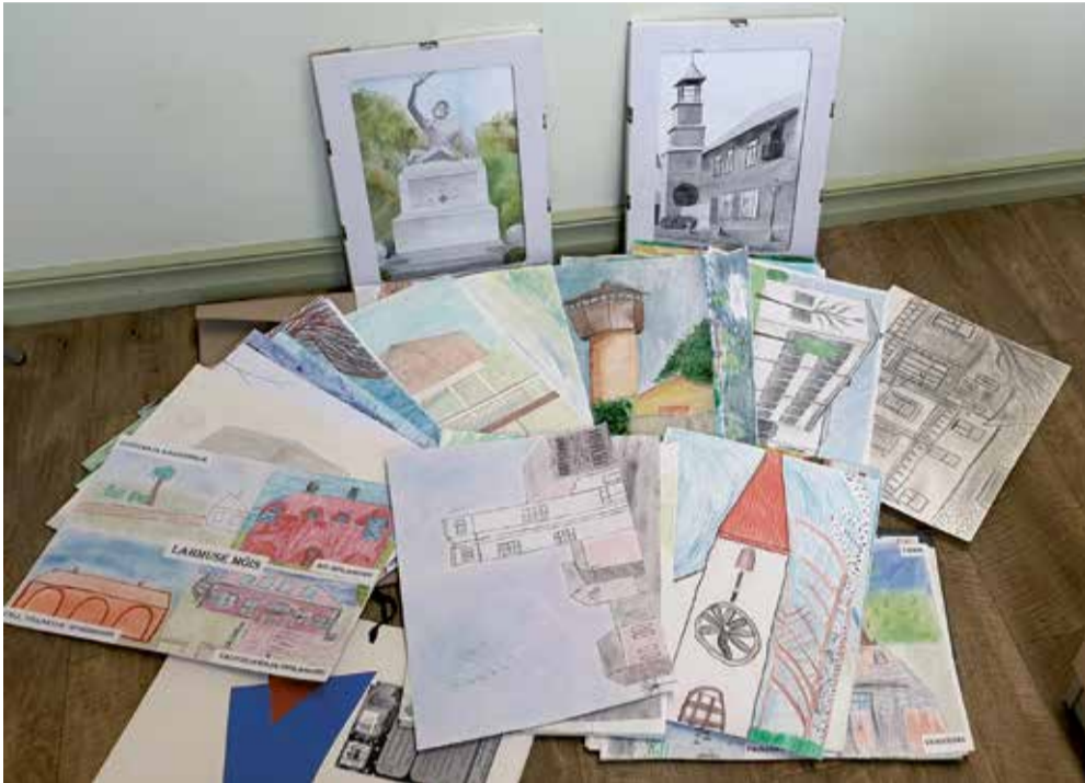
Joonistuskonkursile saadetud tööd.

Kõik tööd olid niivõrd ägedad, et otsustasime need kõik tervisekotta näi-