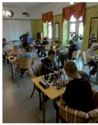
Maletajad Lahmuse kooli meistrivõistlustel.

Samal päeval osalesid kooli esindajad ka Eriolümpia Eesti esinduse poolt korraldatud tänapäeval Järveveere puhkekeskuses. Koosviibimisel tehti kokkuvõtteid spordiaastast ja tunnustati koolide parimaid sportlasi, kelleks Lahmuselt