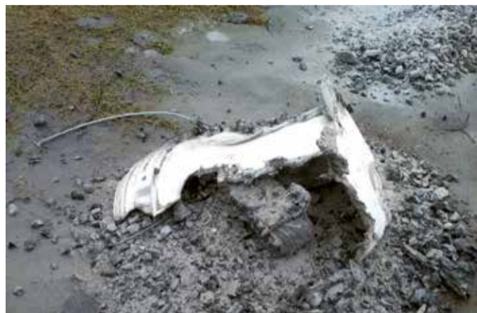
Tuhaämber, mis süütas tulekahju.