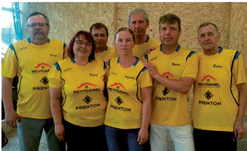
Klubide Karika II etapp Harkus.