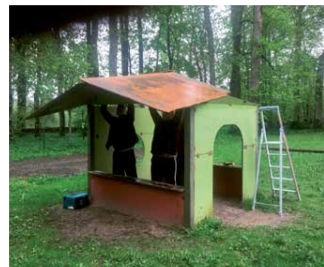
Vana katus maha ja uus peale!