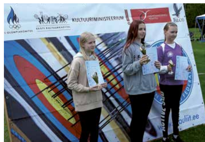
Eesti karikavõistlused vibusportis.