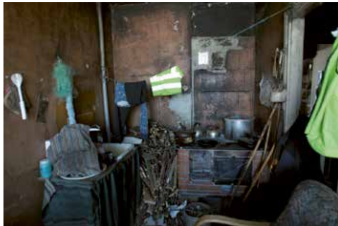
Nii pole ilus.

Tihti on õnnetuste põhjuseks väike laiskus või mugavus. Tuha välja viimata jätmine ja selle esikusse tõstmine? Teate ju, et see tuleb lõpuks ikka välja viia? Parem oleks eemaldada oht kohe,