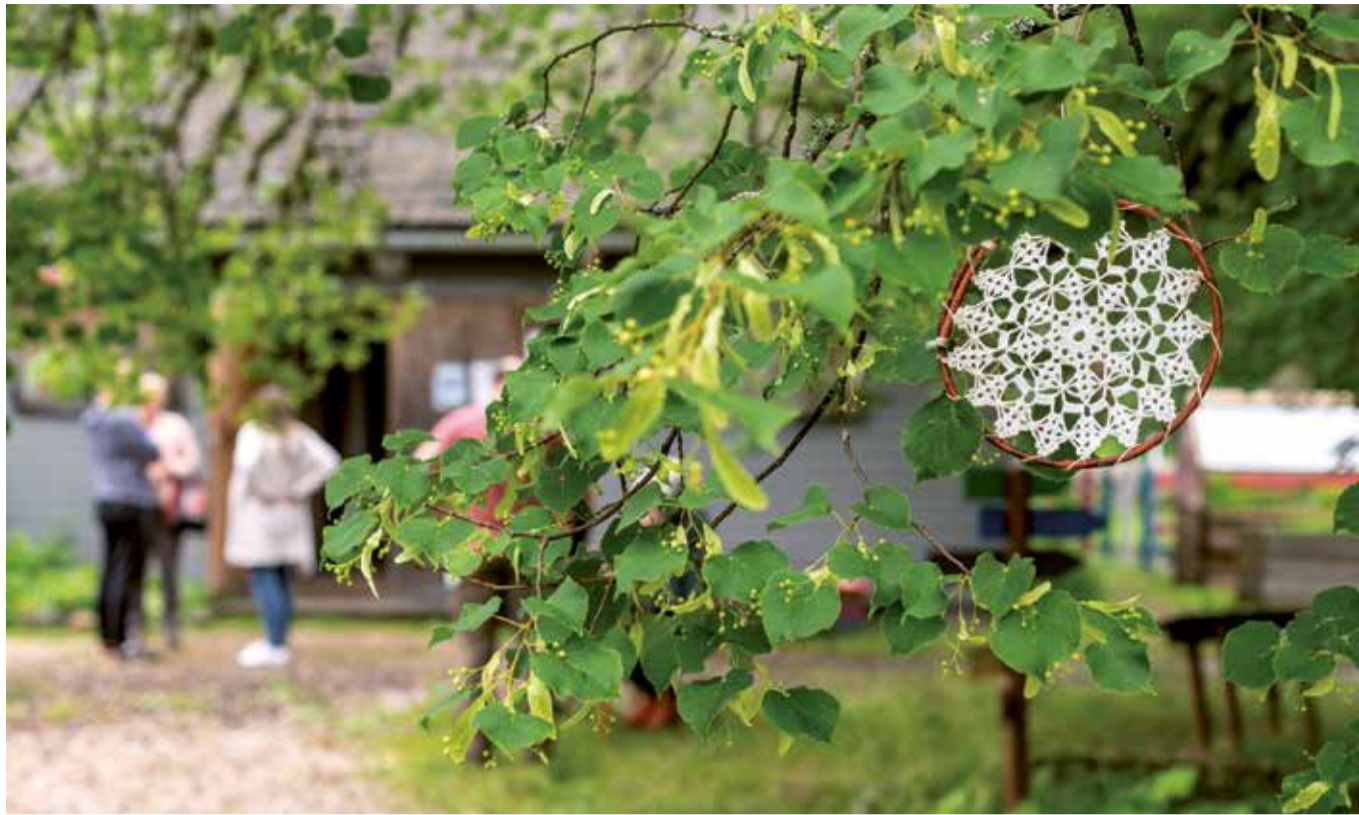
Soomaa kohvikutepäev 2020.