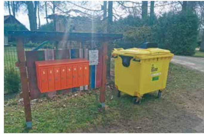
Supsi külas asuv Eesti Pakendiringlus OÜ pakendikonteiner.