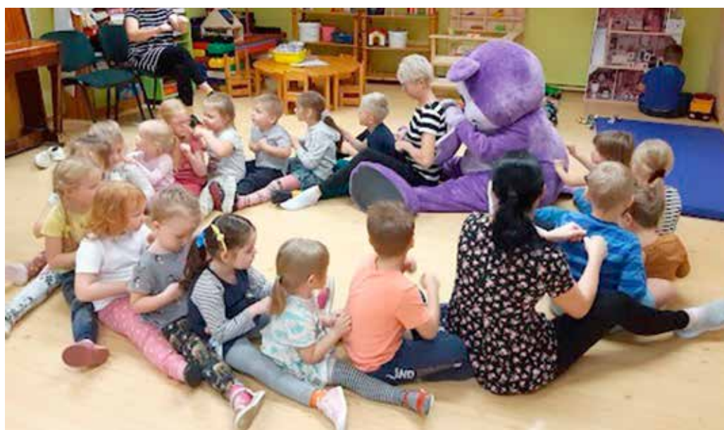
Joonistasime koos Sõber Karuga üksteise seljale.

Kuna väikesed lilled karud on lastele väga armsaks saanud, otsustasime meile külla kutsuda ka suure Sõber Karu maskoti.