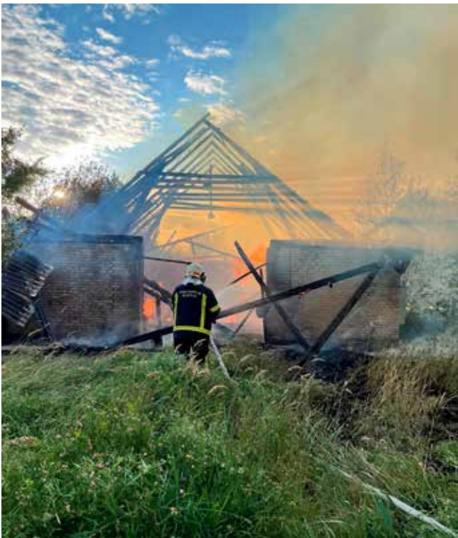
Vabatahtlik Äksi tulekahjul.

Täna mõistab enamik, et kodu ja selle ümbrus peab olema igakülgset turvaline paik. Inimesed teadvustavad, et selleks tuleb tagada tule-, elektri-