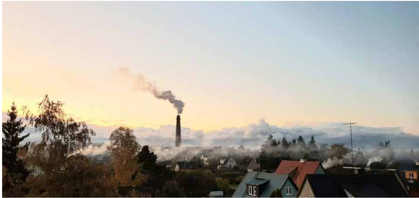
Kütteperiood toob kaasa korstnaist tõusvad suitsusambad.

Sobimatu küttematerjal – niiske või töödeldud puidu või lausa jäätmete – põletamisel tekivad tervisele ohtlikud peened osakesed ja vingugaas. Plastjäätmete põletamisel lenduvad aga eriti mürgised saasteained (nt dioksiinid ja furanid), mis võivad põhjustada vähktõbe, väärenguid ja arengupeatust. Korstna kaudu õhku lendunud saasteained langevad maapinnale ning vette, kust need omakorda lii-