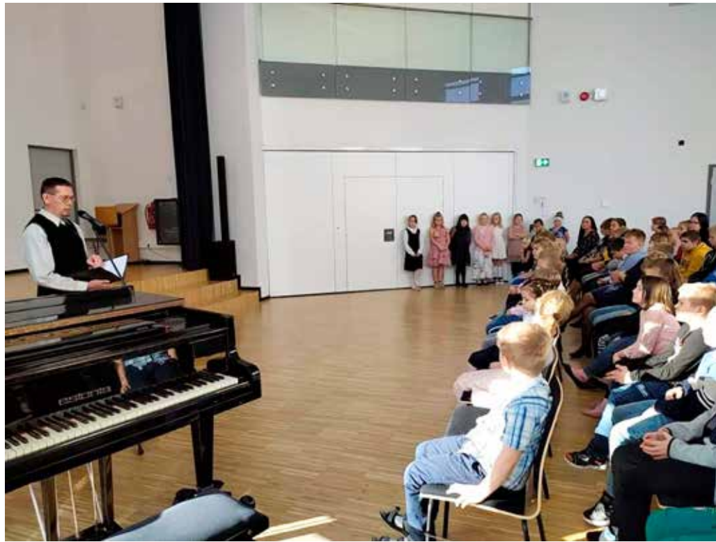
Kooli aastapäeva aktus.

Läbi ajaloo on Võhma koolil olnud kümmekond nime. Enamasti on uus nimi tulnud käsikäes hüppega kooli arengus ja kohustuslike kooliaastate arvu suurenemisega. Kui 166 aastat tagasi alustati tööd Võhma Evangeeliumi-Luteriusu vallakoolina, siis pidid lapsed haridust omandama kolm talve. 1920. aastatel kasvas kohustuslik haridus kuue klassini, millest Võhmas oli võimalik läbi teha esialgu neli. Järgnevatel aastakümnetel lisandus juurde nii klasse kui ka kohustuslike kooliaastaid, mida viimased kolm kümnendit on olnud üheksa. Keskkool loodi Võhmas 1975. aastal. Gümnaasiumiks nimetati see ümber 1995. aastal. 2015.