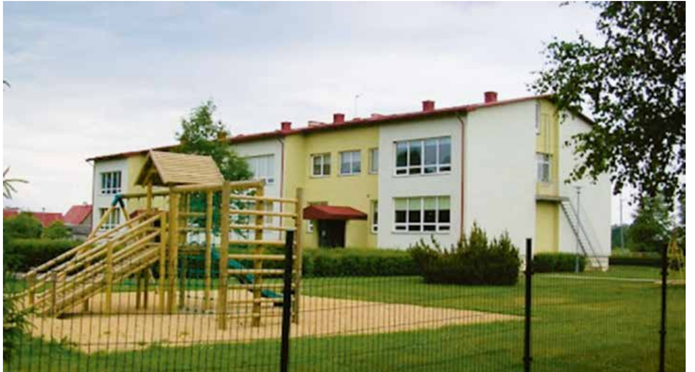
Raamatukogu asub lasteaia ja päevakeskusega ühes hoones.