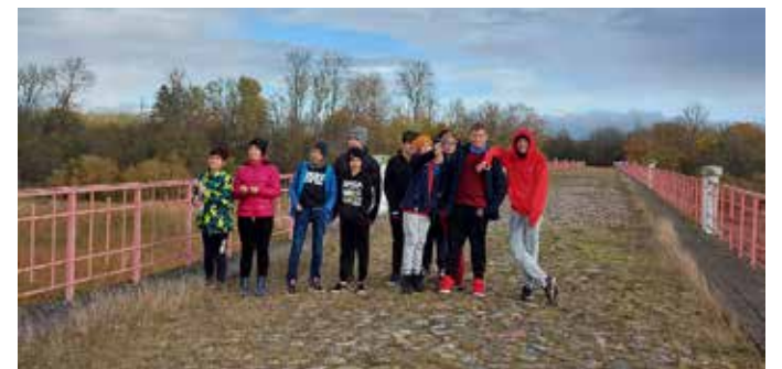
6. ja 7. klassi õpilased Kasari sillal. Mõned märkasid samal hetkel kohalikku metskitse.