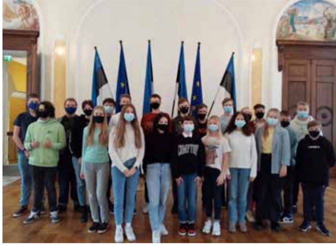
Kirivere kooli 8.–9. klass külastas 4. novembril Riigikogu ja Euroopa maja Tallinnas.