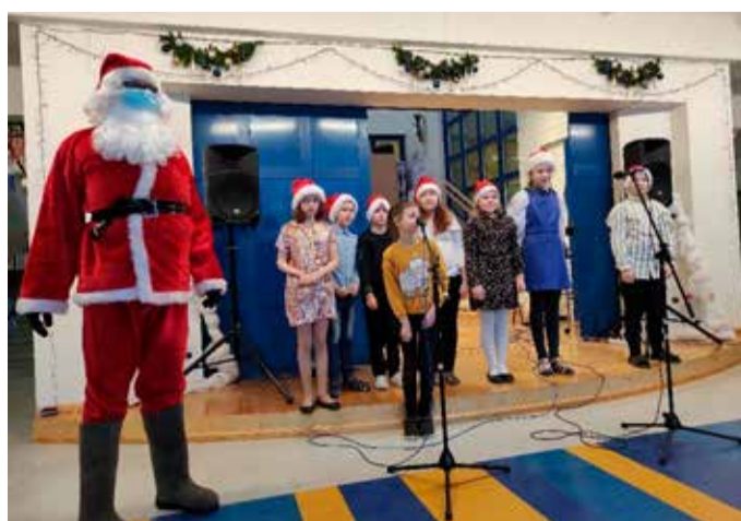
Kauaoodatud jõuluvana jõudiski laste rõõmuks kohale!

Kolm küünlaleeki süütasid rahumeelsed, õigluse