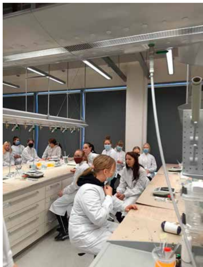
Tartu Ülikooli Chemicumis.