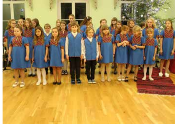
Kirivere Kooli mudilaskoor sai jõuluks valmis uhked esine- misriided.