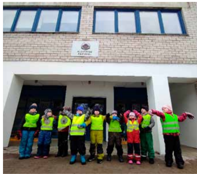
Piilu lasteaia koolieelikud.