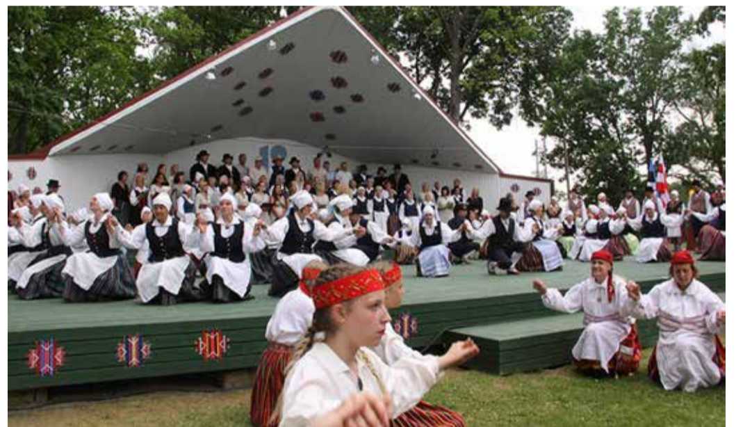
Hetk Põhja-Sakala valla I laulu- ja tantsupeolt.

Vastavalt valimisliidu Ühine Tee, EKRE, Keskerakonna, Isamaa ja Eesti200 vahel sõlmitud koalitsioonilepingule tehakse töörühmale ülesandeks pandud analüüs ja ettepanekud kultuuritegevuse arendamiseks 2022. aasta esimese poolaasta jooksul.