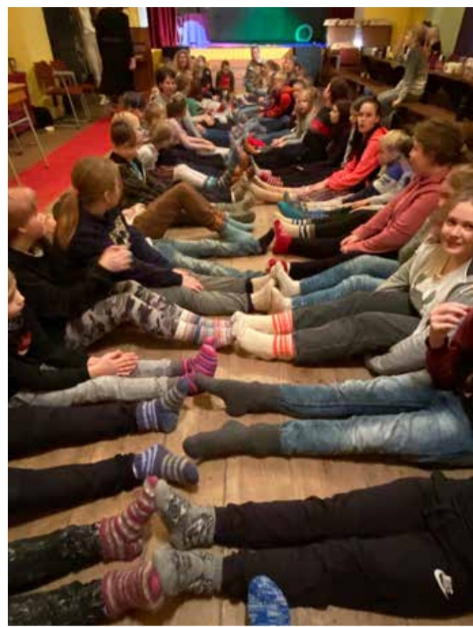
Villaste sokkide pidu.

Seekordseks näituse teemaks oli omavalmistatud ja kaunistatud küpsis. Väljapanek oli toredaid üllatusi täis. Tore oli see, et küpsisemeistrid olid lahked oma toodangut maitsmiseks pakkuma. Kõik said kiidusõnu kuulda! Populaarsemad olid kaeraküpsised ja neid oli rikkalikult kaunistatud – üks suur küpsis, mille 6. klassi esindus välja pani, oli kaunistatud sõnaga KiVa. Mõeldes, et üksteise hoidmine, sõbralikkus, märkamise, abistamine ja