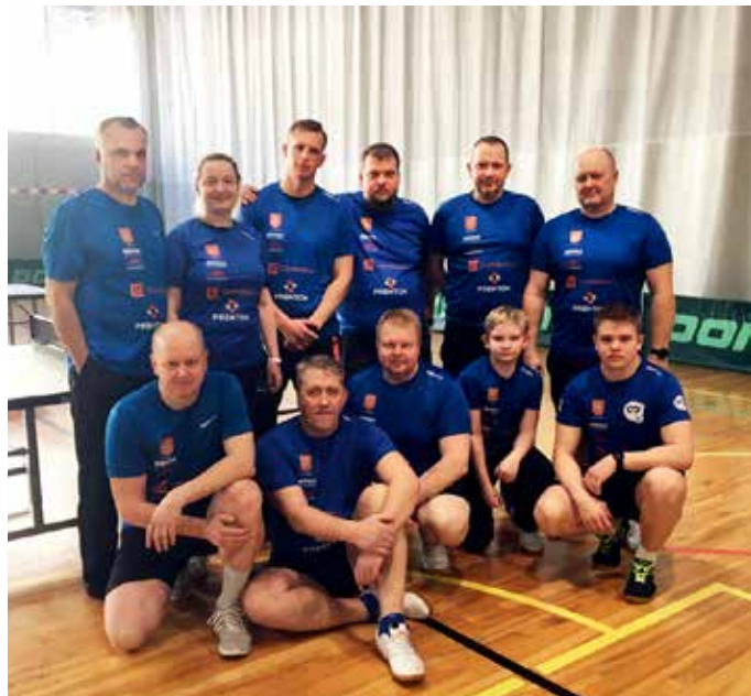
12.03.2022 Suure-Jaanis karikasarjal osalenud meie klubi liikmed.