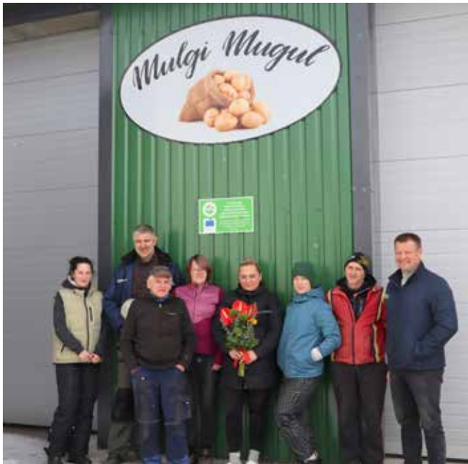
Mulgi Mugul kollektiiv.

mis võimaldab paremini väärindada kartulit ja köögivilju, neist tooteid valmistades, pakendades ja müües.