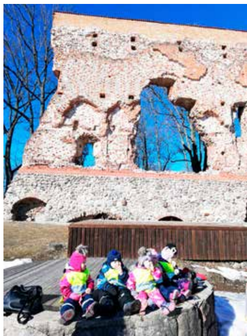
Lasteaia lapsed Lossimägedes.