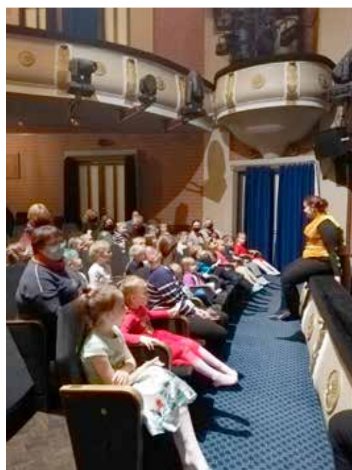
Kohtumine kollase kassiga.