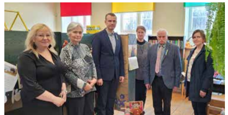
Suure-Jaani raamatukogus.