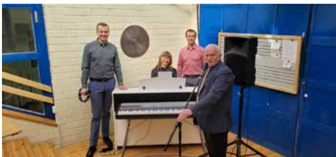
Olustvere põhikoolis.