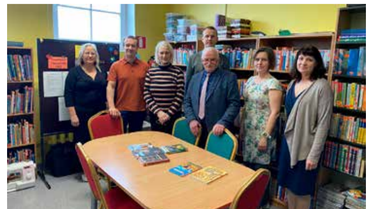
Vastemõisa raamatukogus.