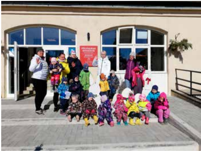
Avastamas kevadist Põltsamaad ja sealset muuseumi.