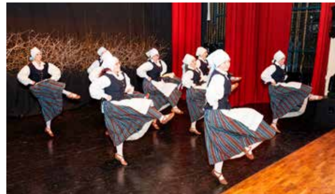
Naisrühm Suure-Jaani valla isetegevuslaste kontsert-peol.