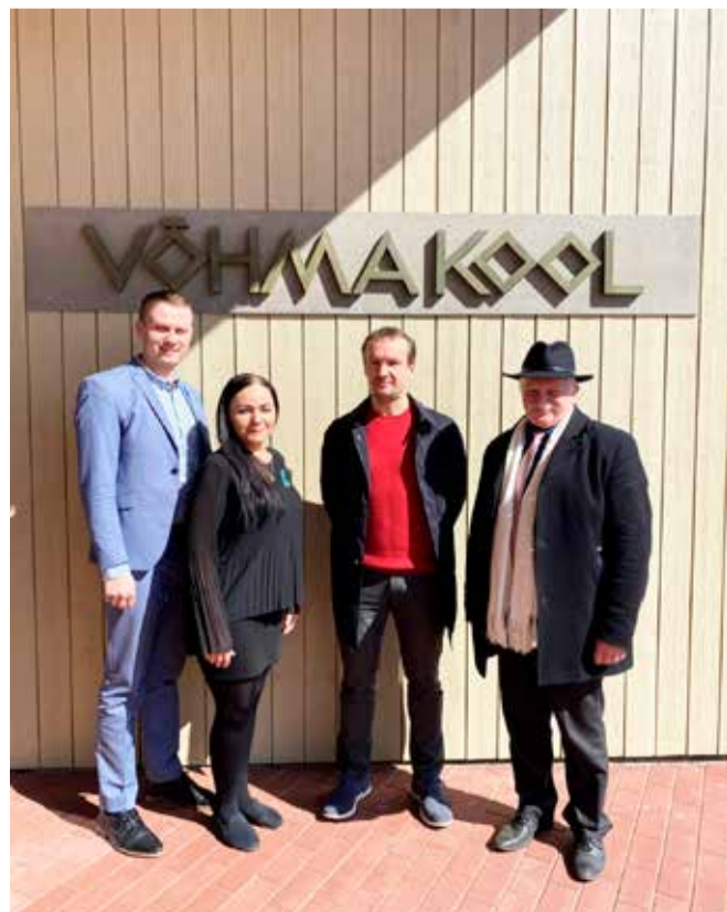
Võhma koolis.

28. aprillil jõuti oma ringkäiguga Suure-Jaani, kus külastati noortekeskust, raamatukogu, kultuurimaja, laululava ning tervisekoda.