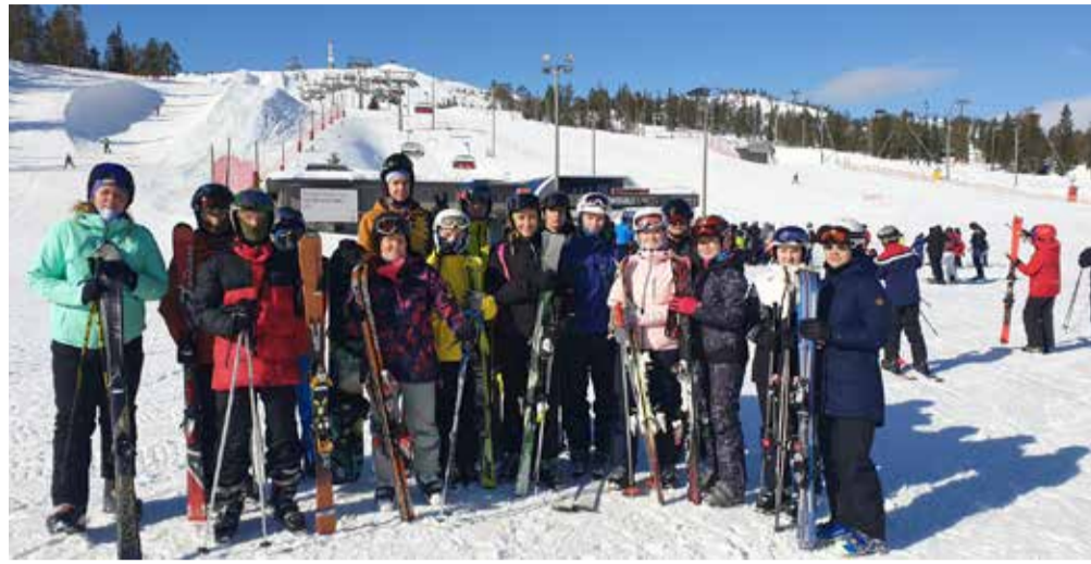
Põhja-Sakala valla noored ja juhendajad Ruka mäesuusalaagris.