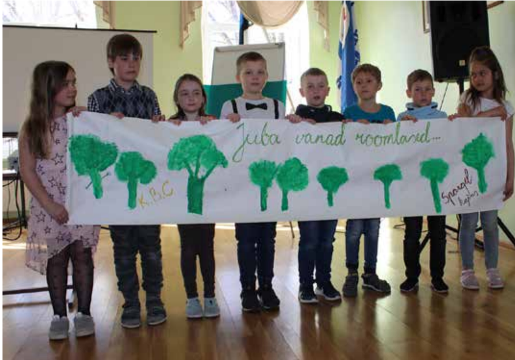
1. klass esitlemas brokolit.

14. aprillil toimus meie koolis südamenädala raames matkapäev. Sellel päeval toimusid lühendatud tunnid ning siis kogunesid õpilased kooli õuele. Matka aitasid korraldada tublid 8. klassi õpilased koostöös ajalooõpetaja, huvijuhi ja klassijuhatajaga. Meie koolis on erinevad üritused ikka seotud olnud kodukoha ajaloo tundmisega ja huvitavate kohtade külastamisega. Sel korral viis tee meid mööda kergliiklusteed Arussaare Issanda Taevaminemise kiriku juurde, Kõo mõisa ning meie kooli juurde jäävasse vanasse surnuaeda. 8. klassi õpilased valmistasid ette põnevad giiditekstid ning ootasid kokkulepituid objektide juures. Ikka ja alati on hea üle korrata juba tuntud paikade ajalugu ning seejuures kuuled midagi uut