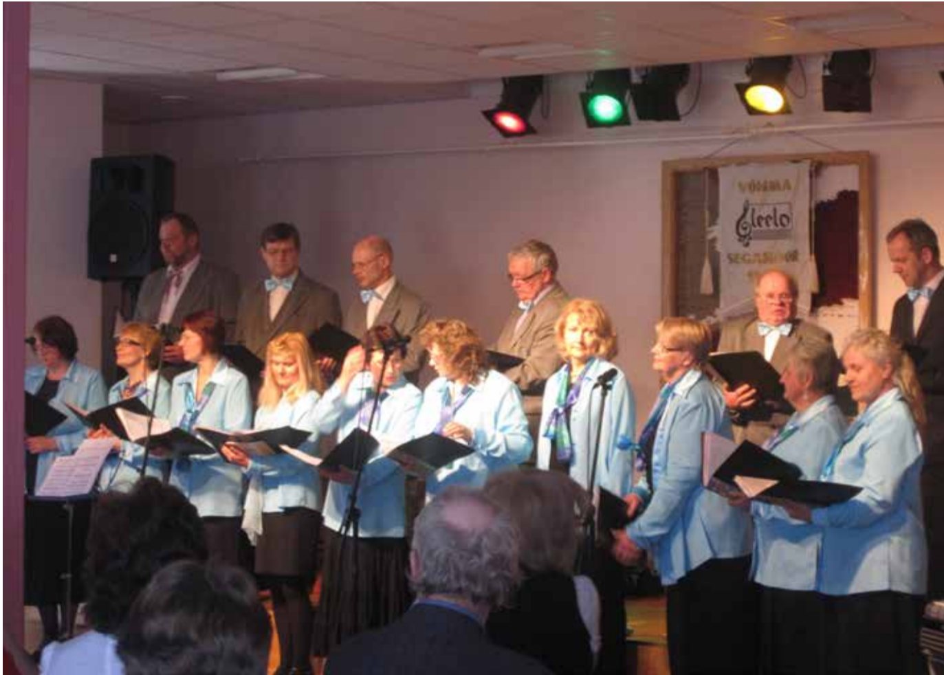
Leelo 140. verstaposti juures – meenutus 10 aasta tagusest juubeliüritusest.