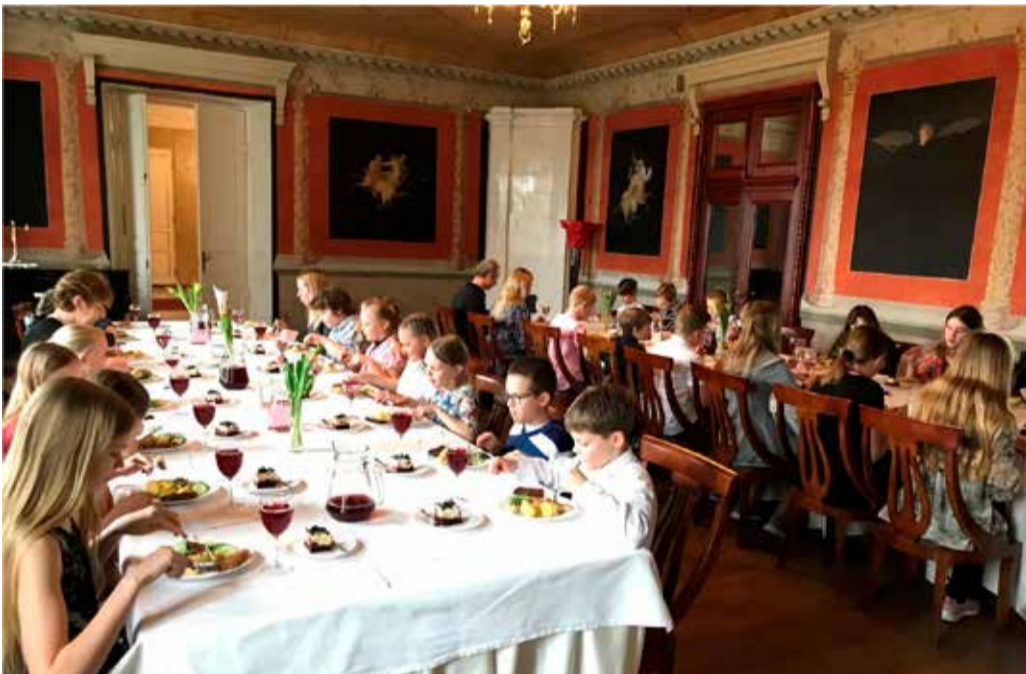
1.-5. klassi traditsiooniline pidulik lõuna mõisa söögisaalis.