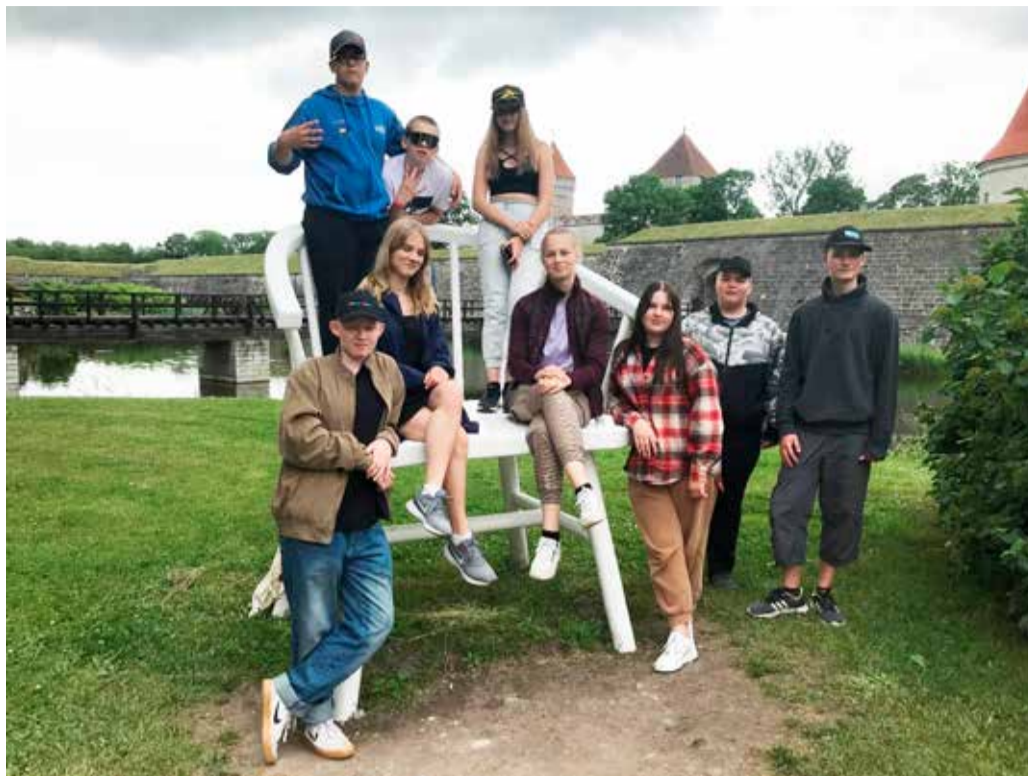
Kuressaare piiskopilinnust avastamas.

Järgmisena ootas vallutamist Kuressaare – nautisime ilusat ilma Kuressaare piiskopilinnuse vallidel jalutades. Ja loomulikult olid selleks ajaks kõigil ka kõhud tühjad – seega Kuressaare toidukohad said ka testitud. Nüüd oli aeg varuda kolmeks päevaks vajalik toidukraam meie majutuspaika, milleks oli Toomalõuka turismitalu. Saime oma kasutusse aidahoone, millest