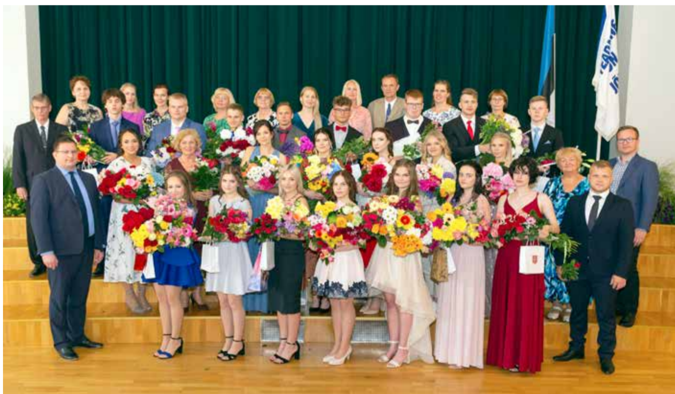
Suure-Jaani gümnaasiumi lõpetajad koos õpetajatega.