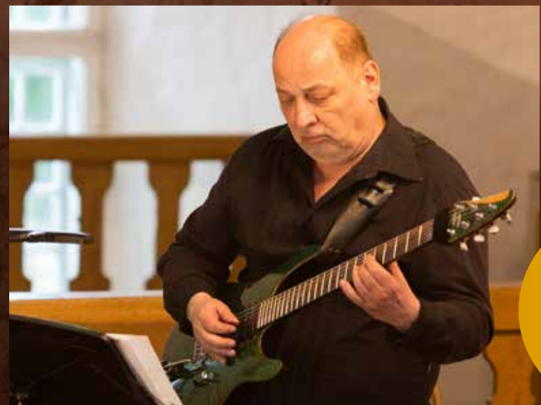
Ain Varts Suure-Jaani kirikus kontserdil „Elektrikitarr kohtab orelit”.