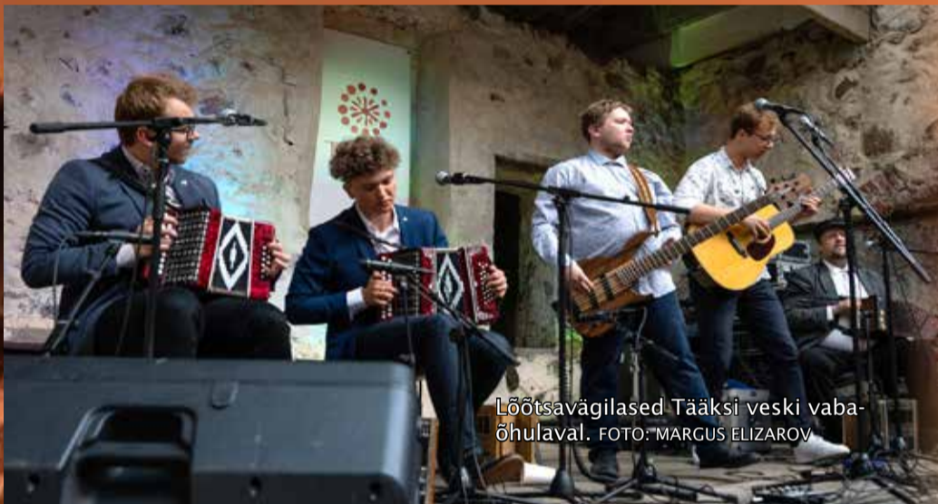
Lõõtsavägilased Tääksi veski vaba- õhulaval.