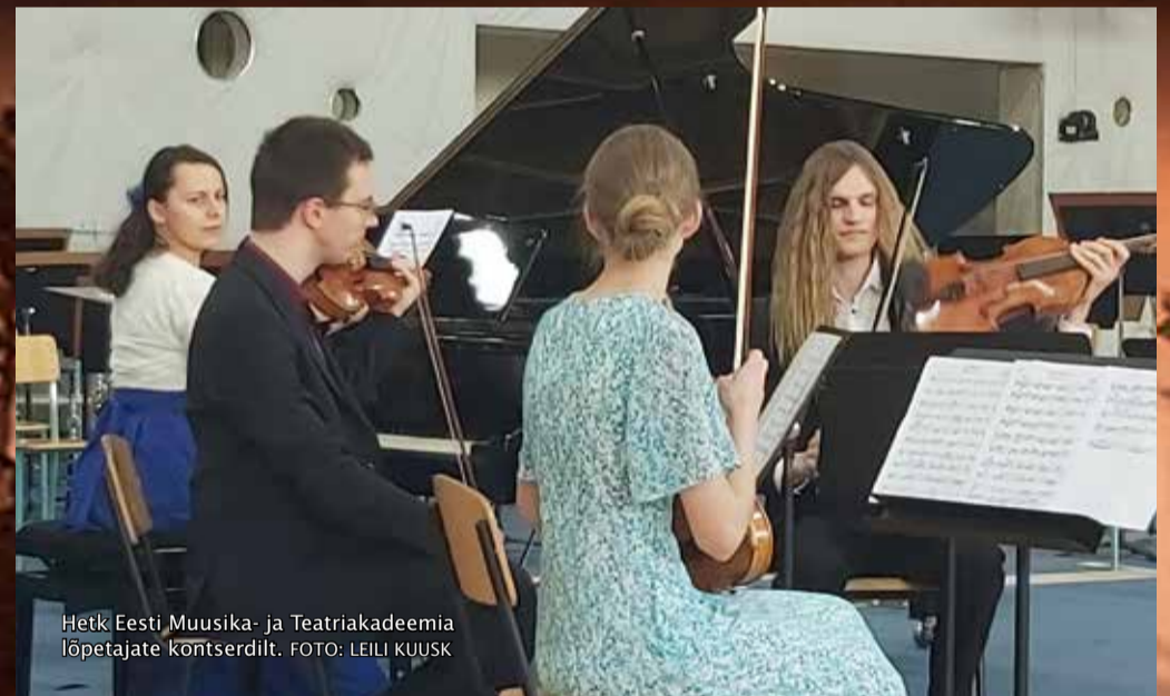
Hetk Eesti Muusika- ja Teatriakadeemia lõpetajate kontserdilt.

Ilma teie panusest ei oleks saanud festivali korraldada: