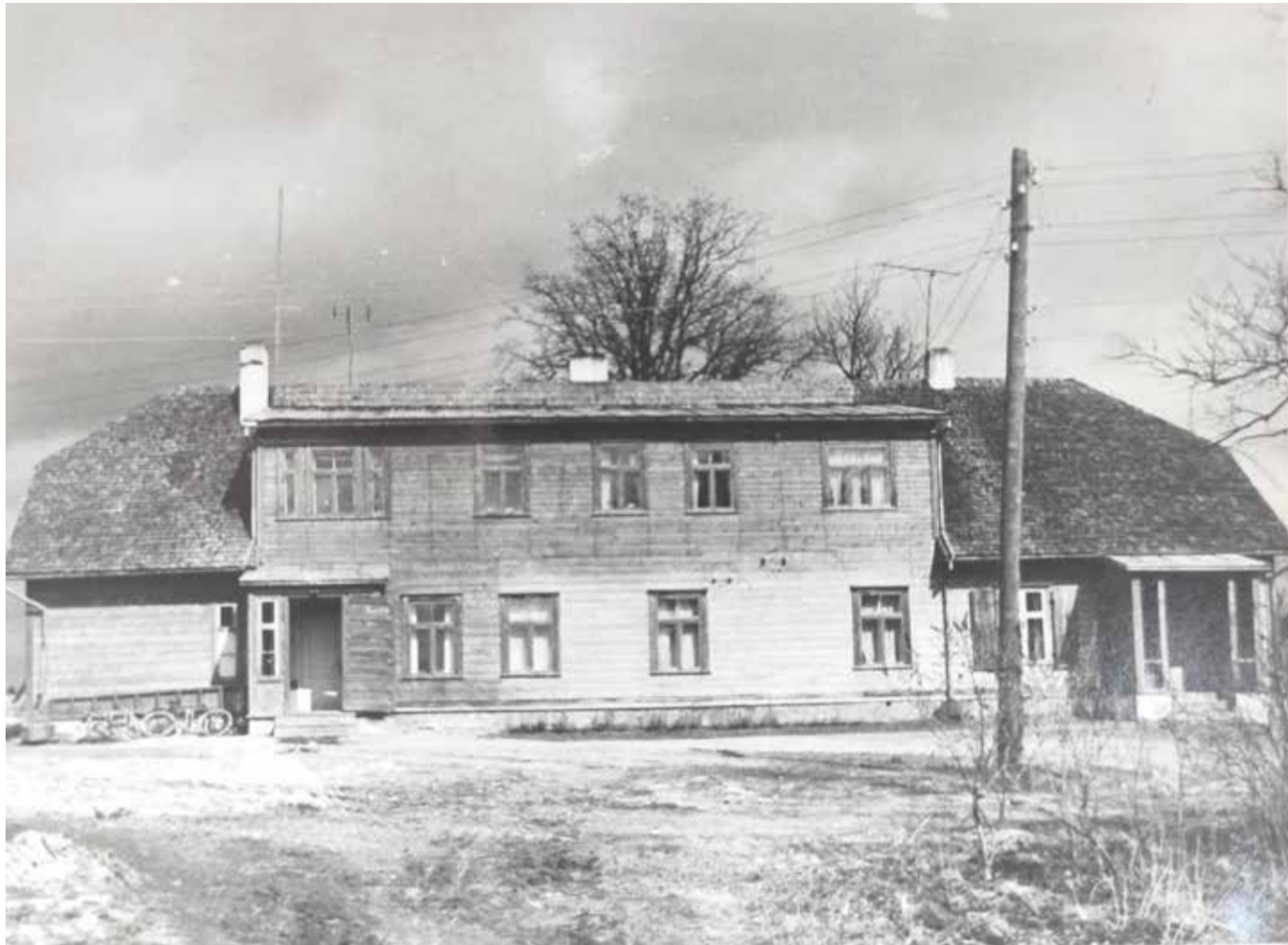
1907. aastal alustas Suure-Kõpu vallamajas tegevust raamatukogu. Vaade hoovi poolt.

Vastavalt 1925. aastal kehtestatud Eesti Avalike raamatukogude seadusele arvati Kõpu Haridusseltsi raamatukogu avalike raa- matukogude võrku ning nimetati ümber Suure- Kõpu avalikuks raamatu- koguks.