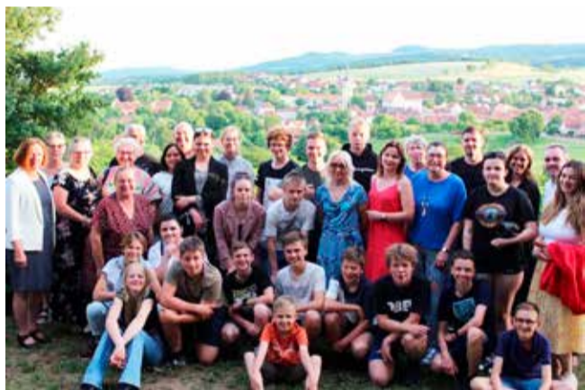
Valdade sõpruskohtumisel osalenud omavalitsuste delegatsioonid Fladungenis.