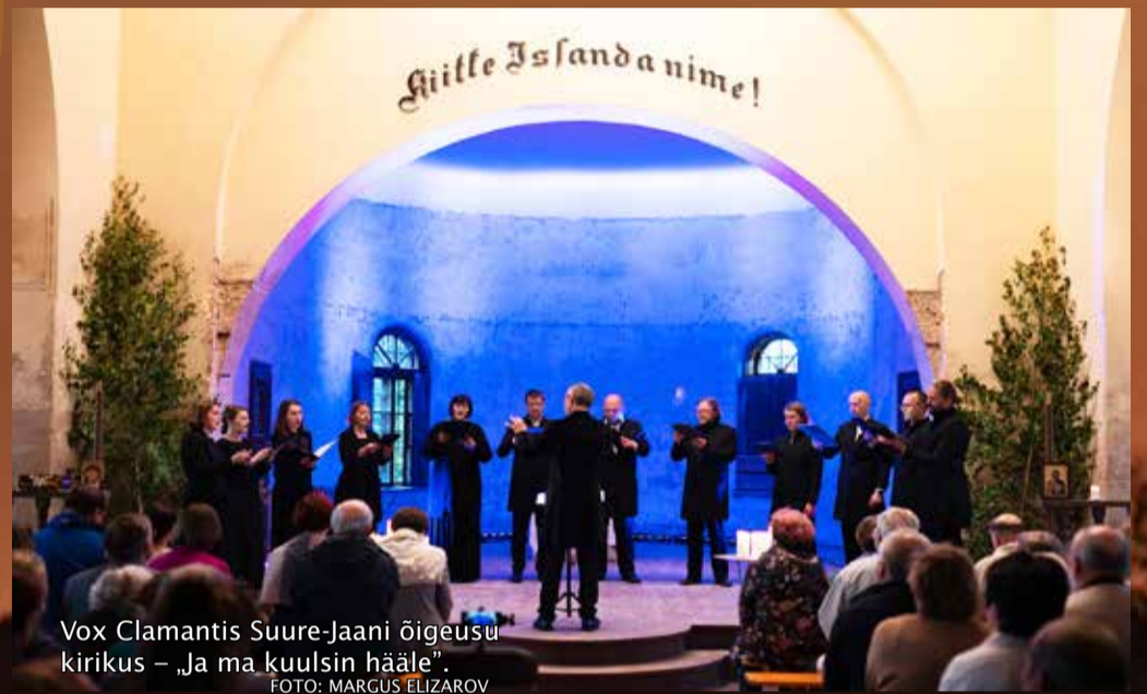
Vox Clamantis Suure-Jaani õigeusu kirikus – „Ja ma kuulsin hääle“. FOTO: MARGUS ELIZAROV

Ja päike tõusis – pärast päikesetõusukontserti. FOTO: MARGUS ELIZAROV