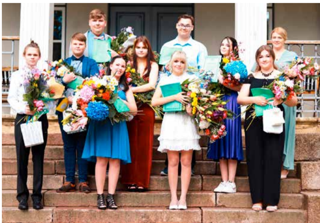
100. lennu lõpetajad.

Nii päevast-päeva koguti uusi teadmisi ja nii hästi, et tänaseks on neist vormitud tublid neid ja noormehed, kes on valmis avastama uusi mängumaid. Nad on olnud alati uudishimulikud ja loovad, korduvalt on suutnud üle kavaldada koolimaja kõige hirmsama sortsit – kodukorra! Kõiki õpetajaid on nad oma