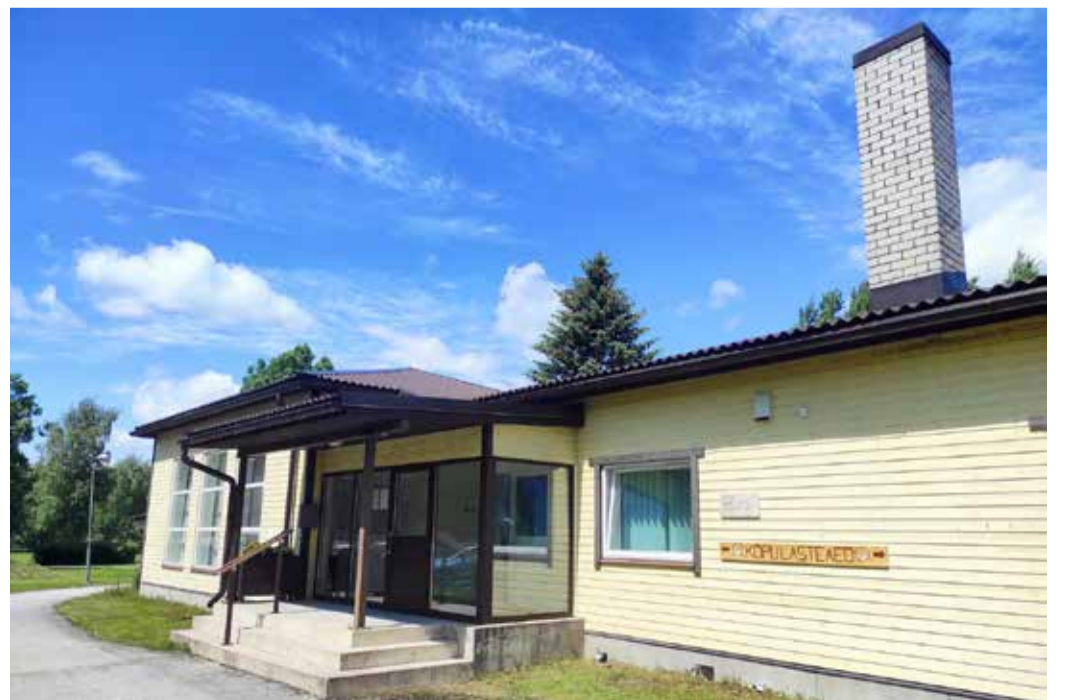
Kõpu raamatukogu ja lasteaed ühes majas.